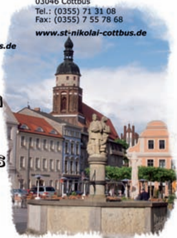
Cottbus St. Nikolai