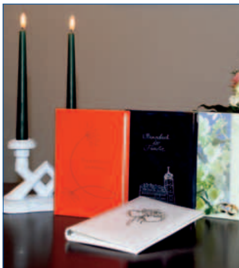
Im Standesamt sind verschieden gestaltete »Stammbücher der Familie« erhältlich

Eine gebührenfreie Bescheinigung erhalten Sie für die Taufe, die Beantragung des Kindergeldes, die Krankenkasse und das Erziehungsgeld. Alle weiteren Urkunden sind gebührenpflichtig.