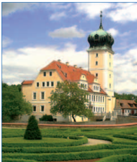
Barockschloss Delitzsch

Wir möchten Sie aber bitten, bevor Sie die notwendigen Unterlagen besorgen, sich mit uns telefonisch oder persönlich in Verbindung zu setzen, damit wir Sie umfassend beraten können.