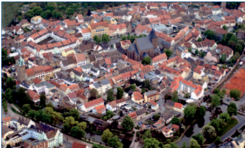
Kulisse für Traumhochzeiten: die Delitzscher Altstadt