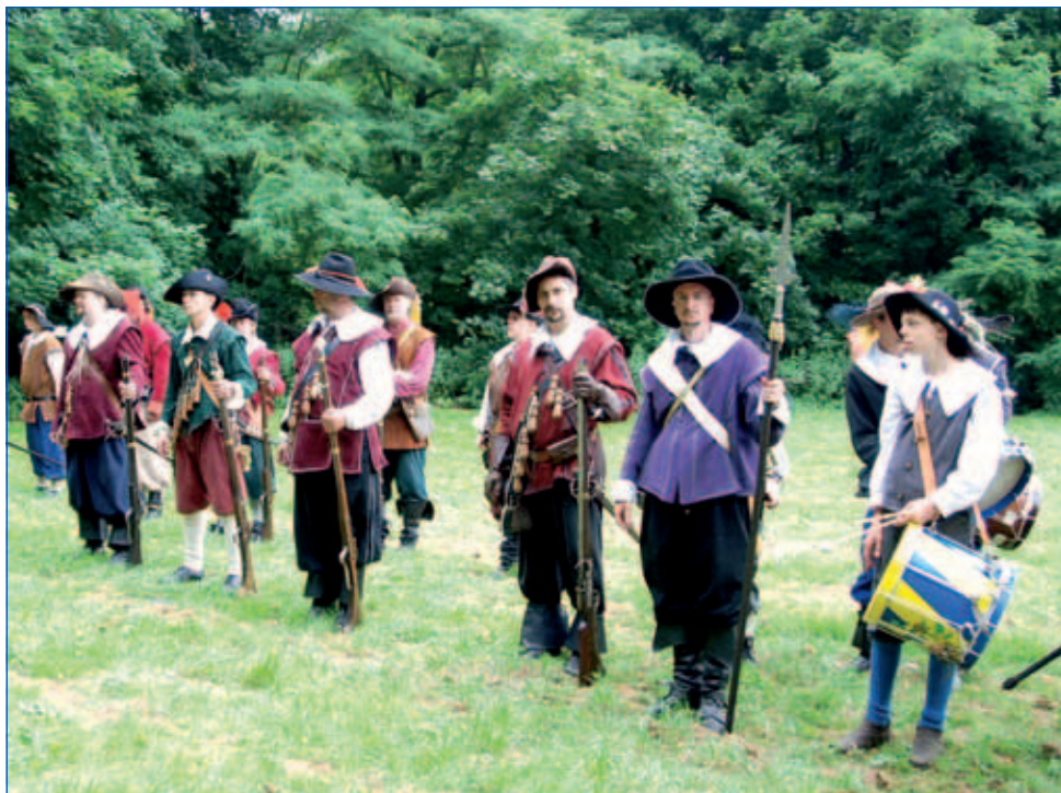
Die »Delitzscher Landsknechte« geben Ihnen Geleit.

Wenn Sie Ihren schönsten Tag im Leben mit einem außergewöhnlichen, historisch angehauchten Erlebnis beginnen möchten, dann ist »Die besondere Hochzeit« genau das Richtige.