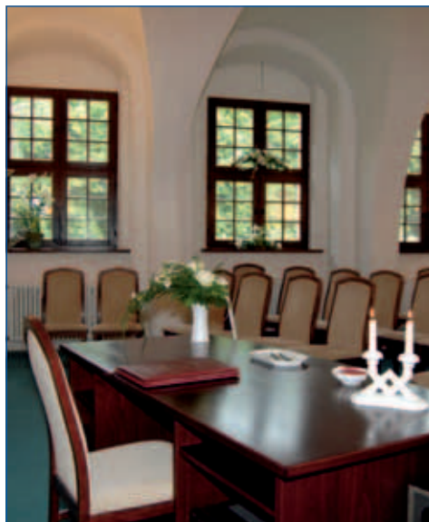
Trauzimmer im Standesamt Delitzsch

Eine Trauung dauert im Standesamt Delitzsch etwa 20 Minuten. 38 Gäste können an dieser Feierstunde teilnehmen.