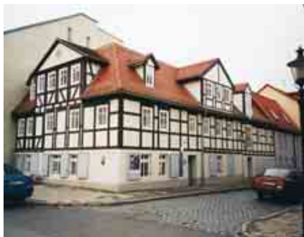
Das Heimatmuseum in der Neugasse 1/3.

Führungen auch außerhalb der Öffnungszeiten bitte telefonisch anmelden unter (0 34 48) 24 98 oder 75 15 38