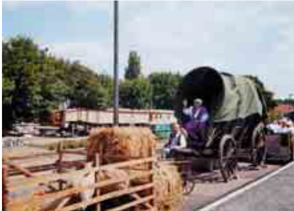
Westerntage auf der Kohlebahn