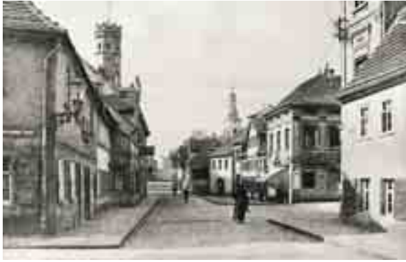
Historische Aufnahme von Meuselwitz.