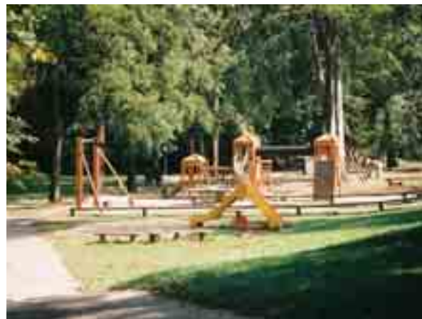
Der beliebte Spielplatz im Von-Seckendorff-Park.