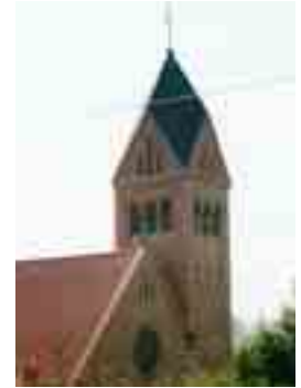
Kirche St. Elisabeth

Die katholische Kirche St. Elisabeth wurde 1908 erbaut. Das im neoromanischen Stil gehaltene Gebäude zählt zu den wenigen architektonisch anspruchsvollen Kirchenbauten des 20. Jahrhunderts. Seit 1995 wurden wesentliche Renovierungen vorgenommen.