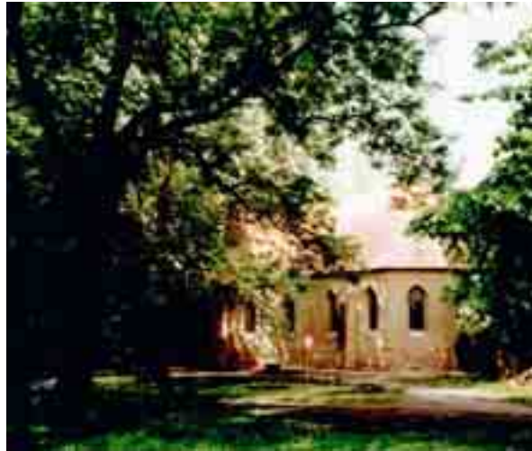
Die Falkenhainer Kirche, eine ehemalige Rittergutskapelle.

Der Ort Falkenhain, geschichtlich bis 1216 zurückzuverfolgen, war jahrhundertlang mit der Geschichte der Stadt Zeit verbunden. Erst im Jahre 1952 wurde Falkenhain dem Kreis Altenburg, Bezirk Leipzig, zugeordnet. Seit 1990 zählt Falkenhain, erstmals in seiner langen Geschichte, zu Thüringen. Die bedeutendste Persönlichkeit des Ortes ist der am 11. März 1824 in Falkenhain geborene weltberühmte Klavierbauer Julius Blüthner. Am 7. November 1853 gründete er in Leipzig eine eigene Pianofortefabrik, die heute noch, nun bereits in der 4. Generation, existiert. Falkenhain ist auch Geburtsstadt des Malers und Grafikers Herbert Gentsch (geb. am 29.03.1909 in Falkenhain, gest. am 28.12.1989 auf der ost-