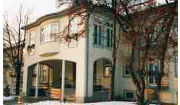
Eingangsbereich mit darüberliegender Cafeteria des Seniorenzentrums Meuselwitz.