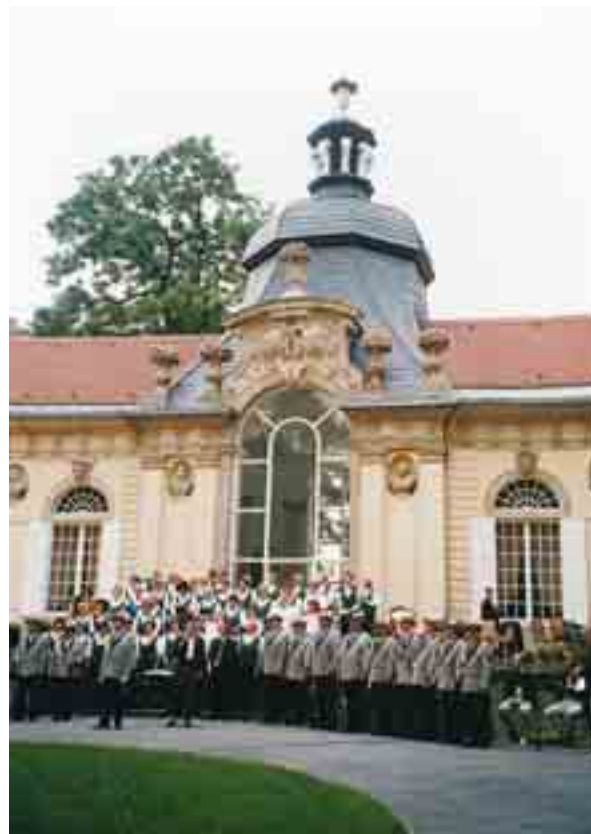
Meuselwitzer Vereine vor der Orangerie

Seckendorff die Geschicke der Stadt Meuselwitz mit prägte). Sie bildet den nördlichen Abschluss des in allen Zeiten gut gepflegten barocken Schlossgartens. Erbaut wurde sie in den Jahren 1724 bis 1727 im Rahmen der Erweiterung des Seckendorff'schen Schlosses nach Entwürfen des kursächsischen Landesbaumeisters David Schatz vermutlich durch den Ratsbaumeister Georg Hellbrunn. Man sagt dem spätbarocken Bauwerk nach, dass es als Vorlage für das 1745 erbaute Schloss Sanssouci gedient haben soll. Nach mehreren Restaurierungsphasen schien in den 80er-Jahren das Gebäude