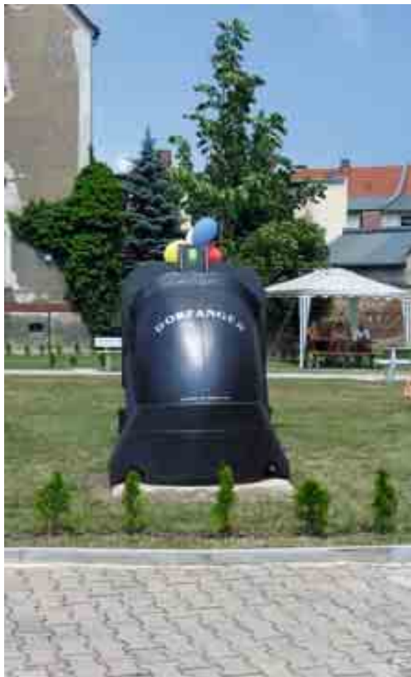
Der neugestaltete Dorfanger in Mumsdorf.

Feuerwehr und Feuerwehrverein setzen sich gemeinsam mit einem aktiv arbeitenden Ortschaftsrat für die kulturellen Interessen im Ort ein. Das Feuerwehrdepot mit neu errichtetem Gemeinschaftsraum bietet dazu verschiedene Möglichkeiten. Im Ort wohnen momentan 726 Einwohner.