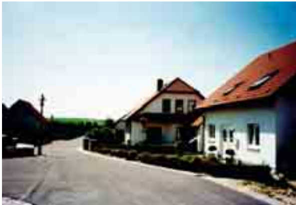
Eigenheime im Wohngebiet Obere B 180

Sowohl im barocken Von-Seckendorff-Park als auch im Wierkerpark, beide gepflegt durch die Stadtgärtnerei und entsprechend den Jahreszeiten gestaltet, finden die Einwohner von Meuselwitz und ihre Gäste Ruhe und Entspannung. Als einziger Überrest der historischen Schlossanlage stellt die Orangerie ein wertvolles Kulturdenkmal dar. Nach umfangreichen Sanierungs- und Restaurierungsarbeiten in den Jahren 1992 bis 1998 steht das Gebäude mit einem attraktiven Café/Restaurant und einem Festsaal für kulturell-literarische Veranstaltungen den Besuchern offen.