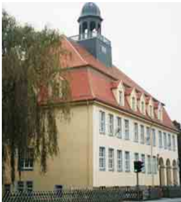
Staatl. Regel- und Medienschule „Geschwister Scholl“