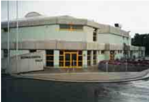
Die Schnaudertalhalle – eine moderne Dreifelderhalle für sportliche und kulturelle Veranstaltungen.

MAZ Fitness- und Freizeit GmbH (Bowling – Sauna – Aerobic – Z III) Bismarckring 2, Tel.: 75 03 33