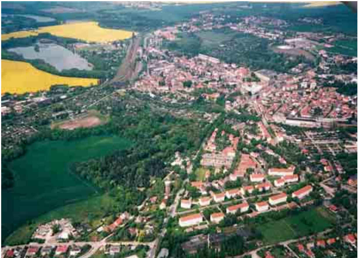
Meuselwitz – Luftaufnahme