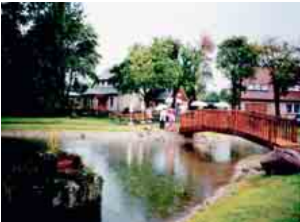
Das Teichensemble in Bünauroda.

Auch für Bünauroda wurde als Alternative zur Fernwärmeversorgung der Neuanschluss an die Versorgungsleitung Erd-