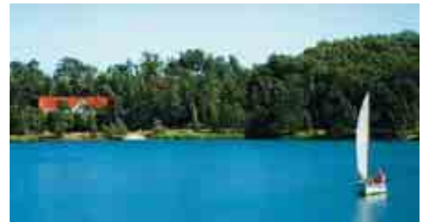
Blick über den Hainbergsee

Dieser See für Angeln und Freizeitsport entstand um die Jahrhundertwende aus dem Restloch der um 1871 aufgeschlossenen ehemaligen Grube „Vereinsglück“. Der Hainbergsee umfasst mit rund 800 m Länge und 300 m Breite eine Wasserfläche von ca. 18 Hektar. Stellenweise ist er bis zu 40 m tief. Vermutlich existiert eine unterirdische Quelle, die für die gute Wasserqualität sorgt. Der von einem kleinen Wäldchen umgebene See kann auf einem Wanderweg umrundet werden. Vor allem das Inselbiotop bietet vielen Tieren Unterschlupf. So gibt es neben dem reichen Fischbestand auch Reiher, Schwäne und Wildgänse. An den See grenzt der ca. 220 m hohe Hainberg, der zu den höchsten Erhebungen um Meuselwitz zählt.