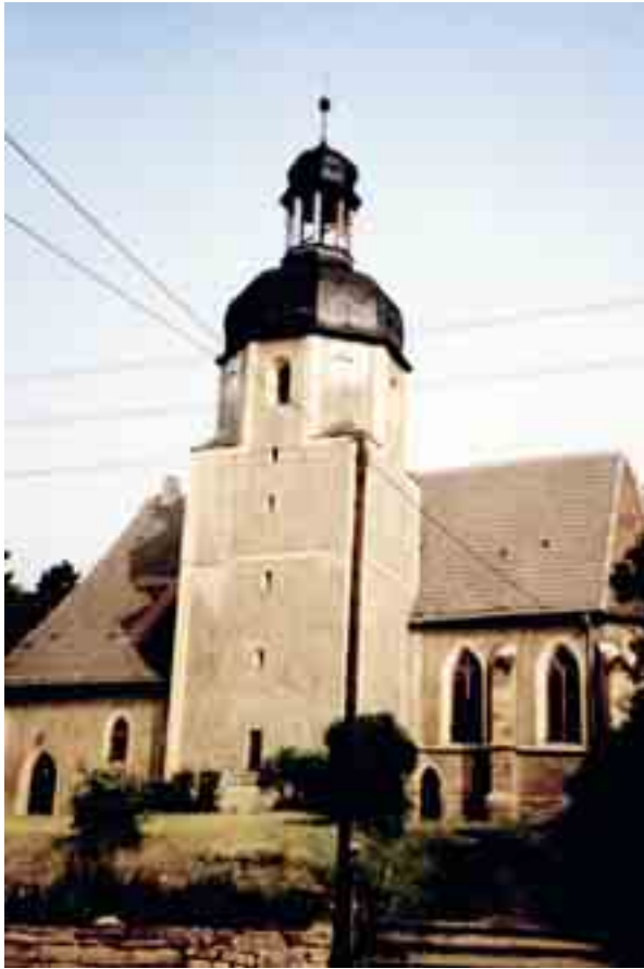
Eigenheime im Wohngebiet Obere B 180

1908 wurde die katholische Kirche gebaut, 1912 die erneuerte evangelische Kirche eingeweiht (erbaut in den Jahren 1500–1511), die allgemein als ältestes Gebäude des Ortes bekannt ist.