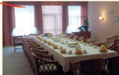
Kaffeetafel im Bowling-Club