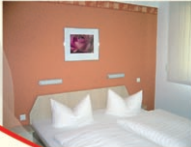
Hotel - Blick in ein 2-Bett Zimmer