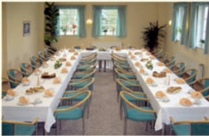
Kaffeetafel im „Kleinen Saal“

· Restaurant mit 62 Sitzplätzen und Tanzfläche