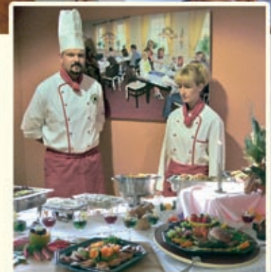
Küche - der Cefkoch präsentiert ein Buffet