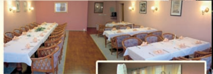
Blick in den Bowling-Club