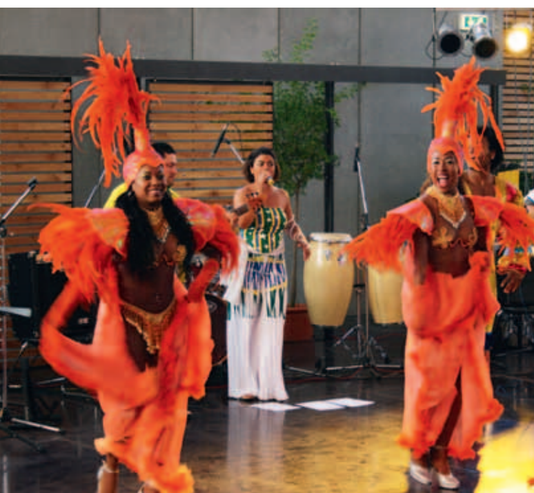
Sangerhausen auch exotisch