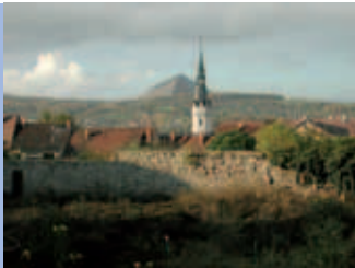
Blick auf die Ulrichkirche