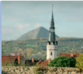
Blick zur Halde