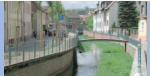
An der Gonna