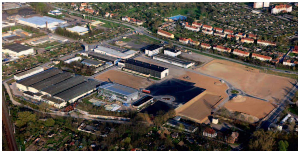
Industrie- und Gewerbe- gebiet „Alte Maschinenfabrik“