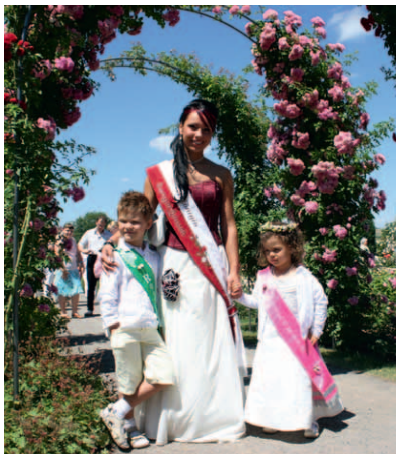
Rosenkönigin mit den Rosenkindern

Touristik-Information: Fremdenverkehrsverein e.V. Markt 18 Sangerhausen Telefon: 03464/19433 Telefax: 03464/613329