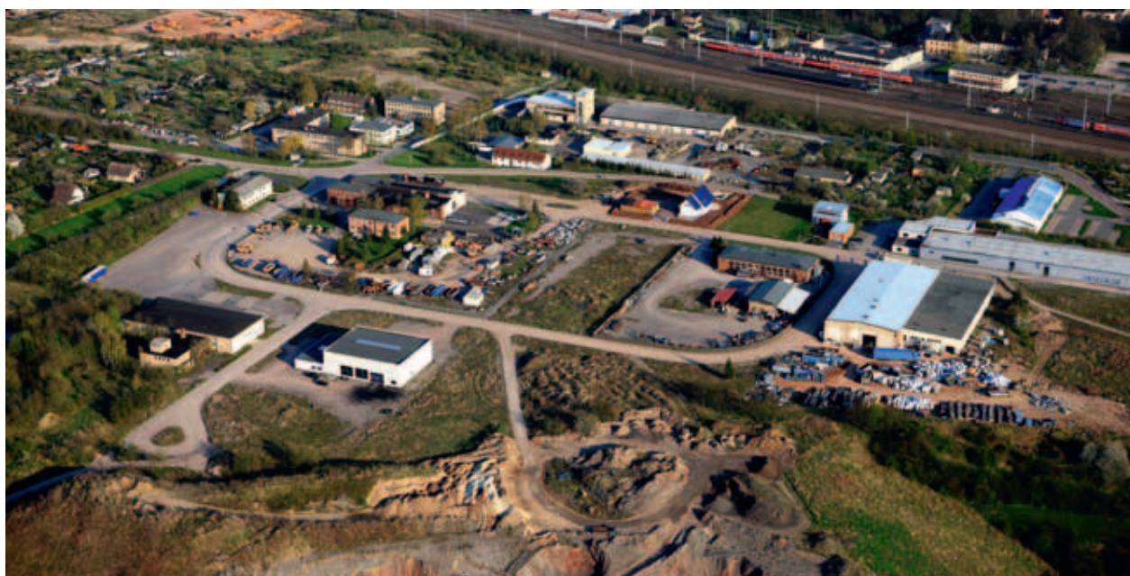
Industrie-und Gewerbegebiet „Thomas-Müntzer- Schacht“