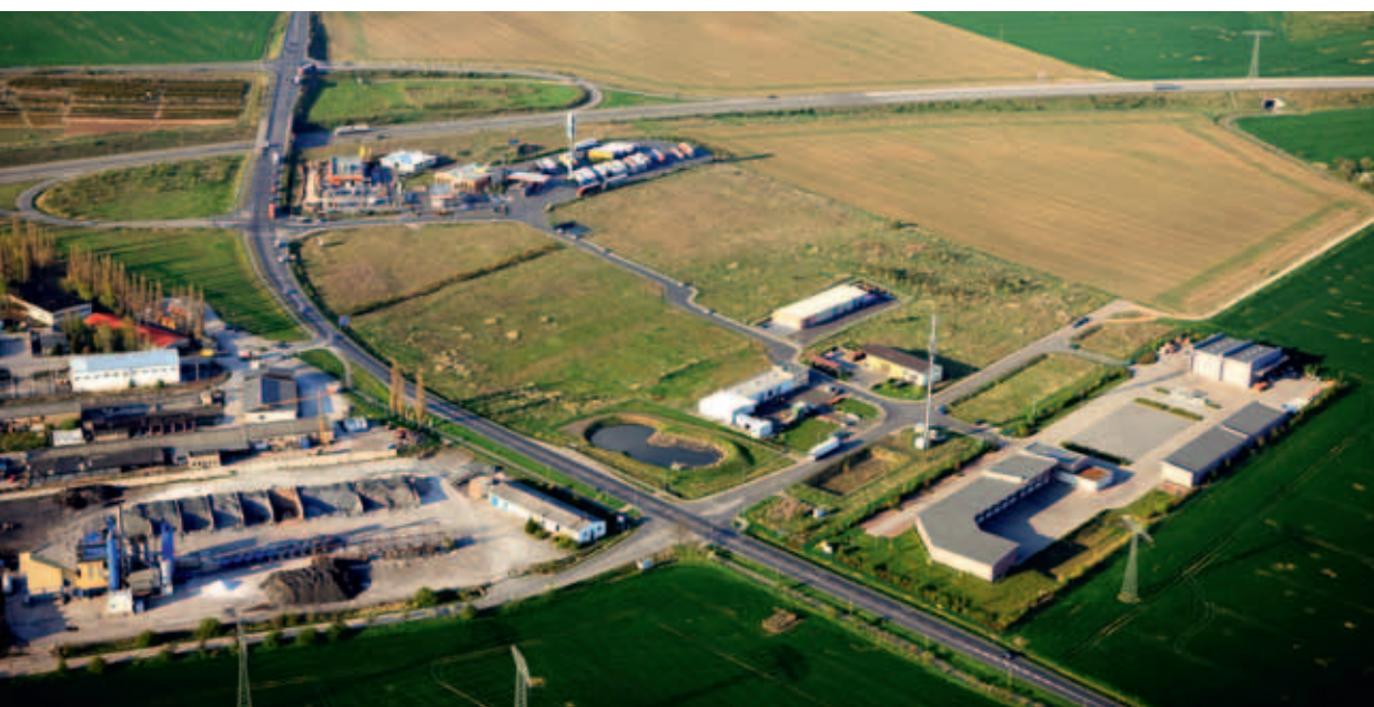
Gewerbegebiet „An der Wasserschluft“ und „Über der Wasserschluft“