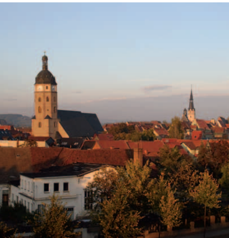
Blick über die Altstadt mit den zwei Türmen von St. Jacobi und St. Ulrich