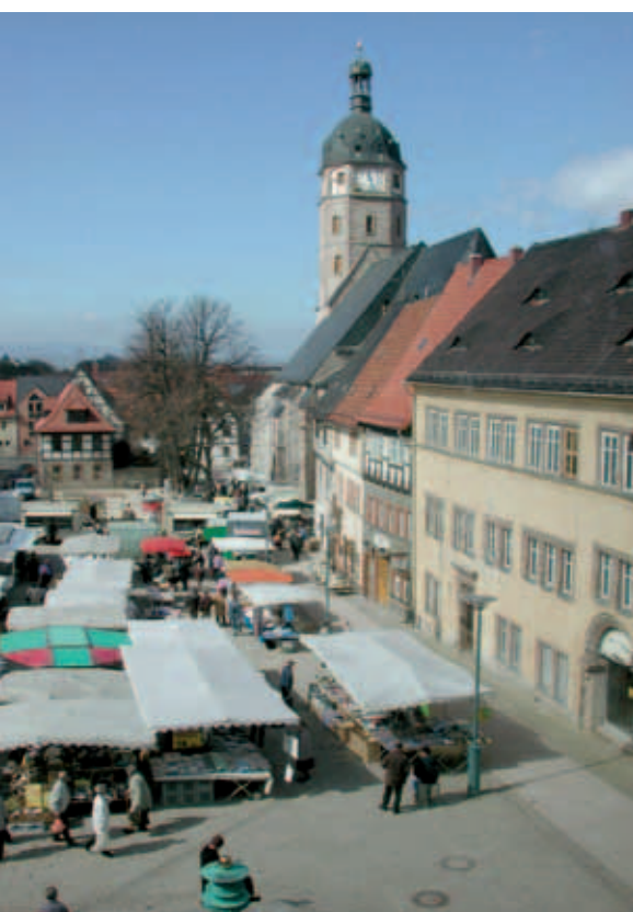
Marktplatz von Osten