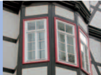
Schlossgasse 1 – 3, 1198