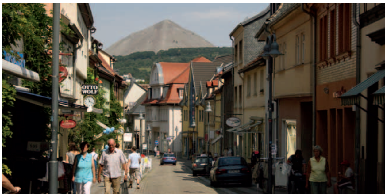
Blick zur Halde des Thomas-Müntzer-Schachtes

... und damit letztendlich die Sicherung und Schaffung von Arbeitsplätzen.