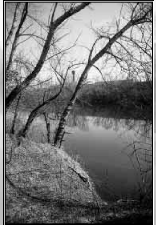
ehemaliger Tagebau Gostau