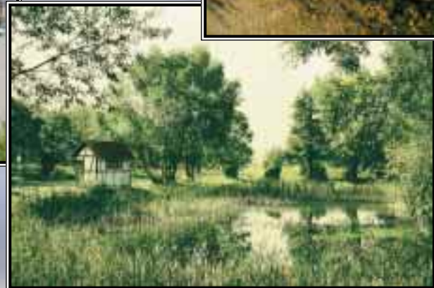
Landschaftsaufnahme Großgörschen an Bushaltestelle