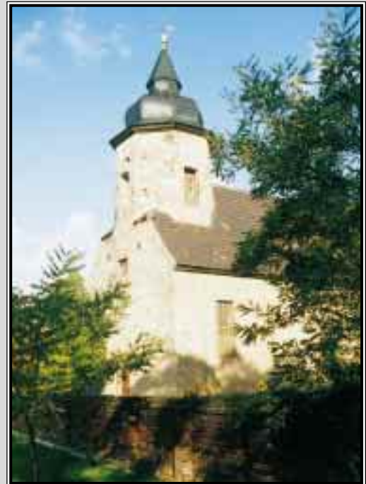
Kirche in der Gemeinde Starsiedel