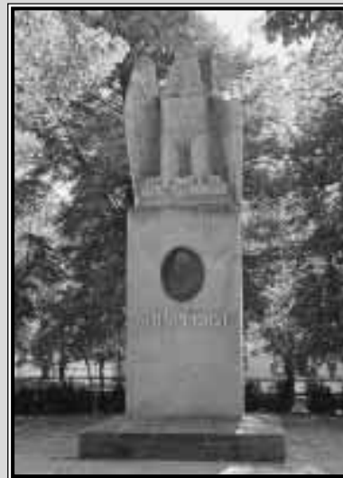
Großgörschen – Scharnhorstdenkmal