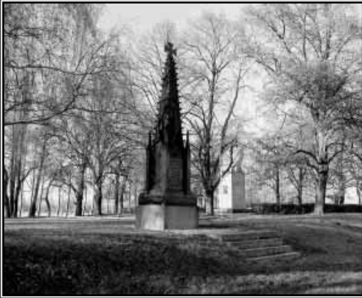
Schinkelpyramide in Großgörschen