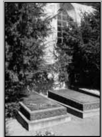
Röcken, Grabstätte Friedrich Nietzsche