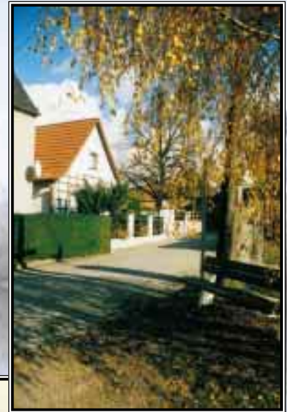
Gemeinde Sössen – Ortsansicht –