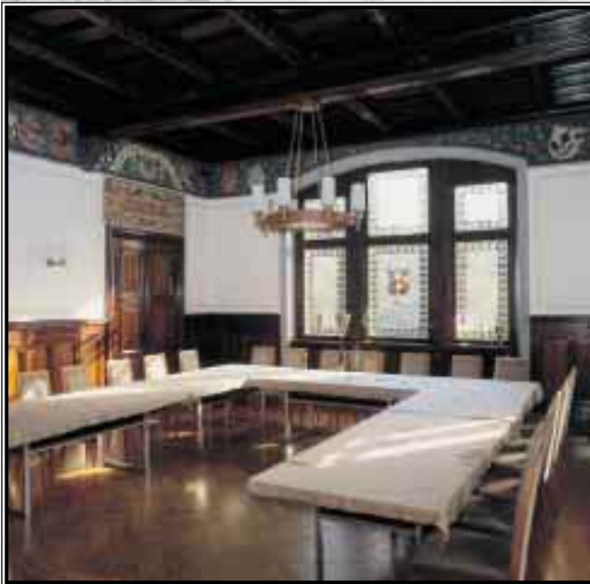
Rathaus Lützen – Sitzungssaal

Stadt Lützen, Gemeinde Großgörschen, Gemeinde Rippach, Gemeinde Röcken, Gemeinde Starsiedel, Gemeinde Poserna und Gemeinde Sössen.