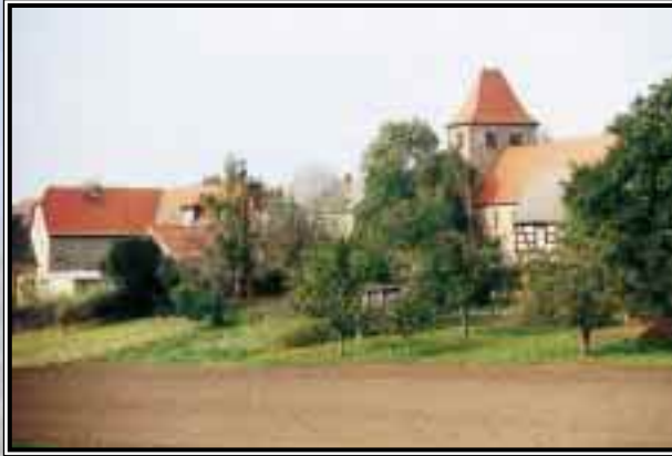
Gemeinde Rippach, Ortsteil Großgöhren – Ortsansicht mit Dorfkirche –