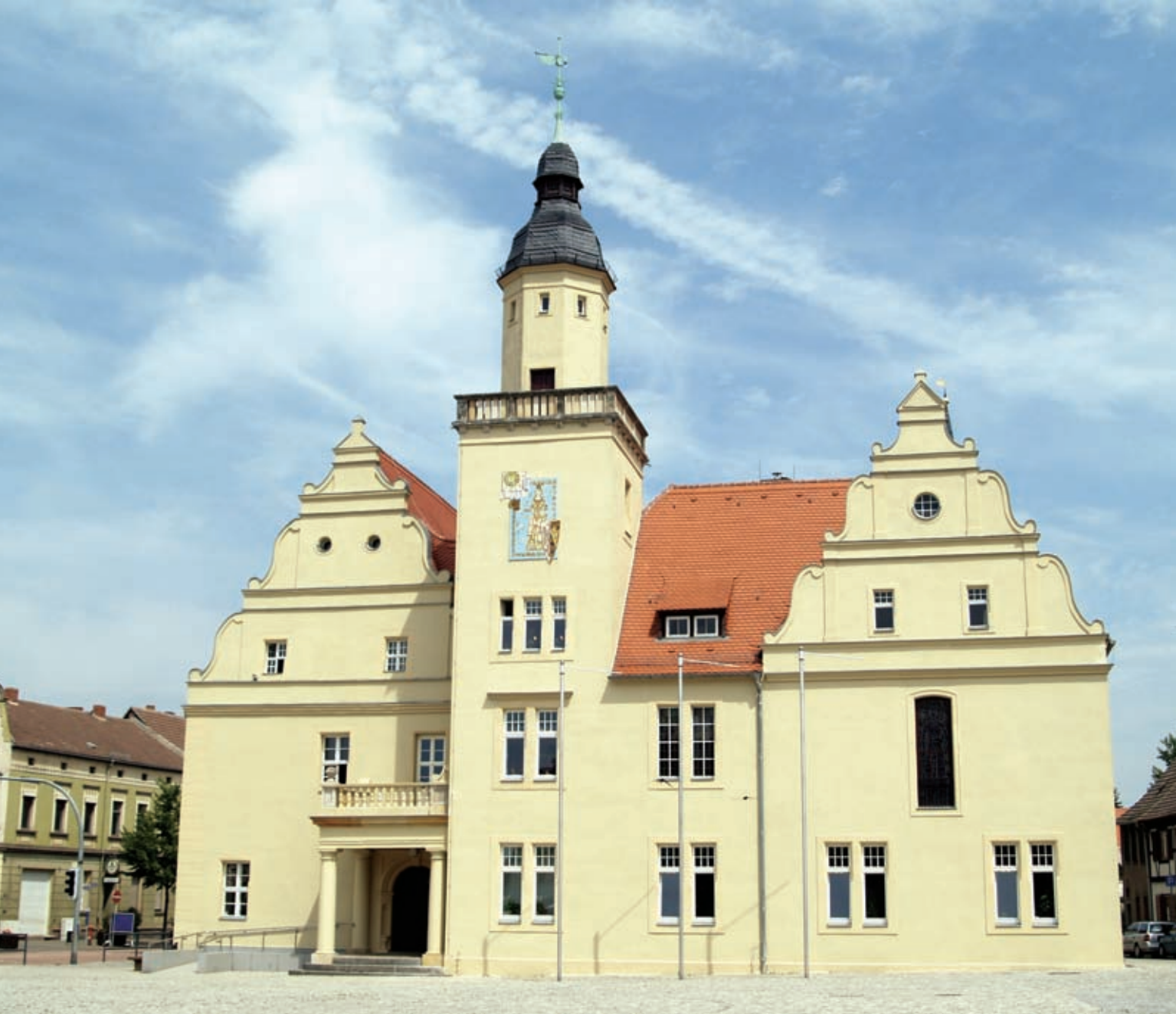
Standesamt Coswig (Anhalt)