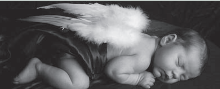
„Die Camera“ GmbH, Dessau