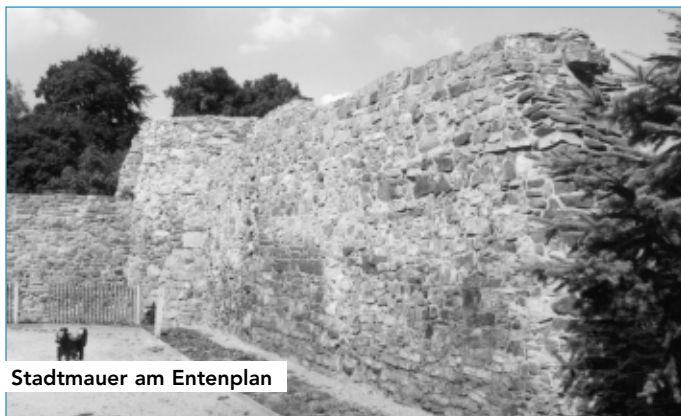
Stadtmauer am Entenplan

Die Mitarbeiter der KEWOG stehen den Bürgern zweimal wöchentlich, dienstags und donnerstags, im Bauamt Neustädter Straße 1 zur Verfügung. Beratungstermine können vorab unter Telefon 0 36 47 – 50 02 51 vereinbart werden.