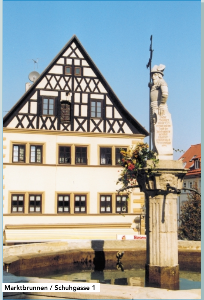
Marktbrunnen / Schuhgasse 1