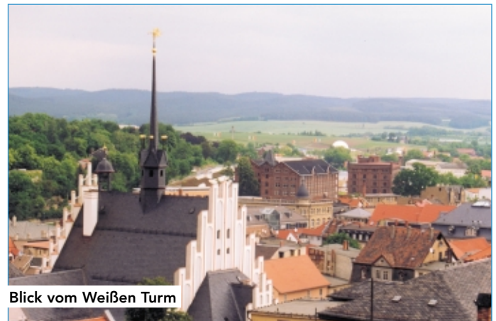
Blick vom Weißen Turm

Auf dem Plan Seite 10-11 sind die Grenzen der Sanierungsgebiete dargestellt. Der genaue Lageplan kann im Bauamt der Stadt eingesehen werden.