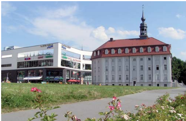
Elsterforum und Stadtmuseum

Für diesen Service sowie entsprechende Auskünfte erheben wir in der Regel eine Gebühr, die Sie ebenfalls dem nachfolgenden Auszug aus unserem aktuellen Gebührentarif entnehmen.