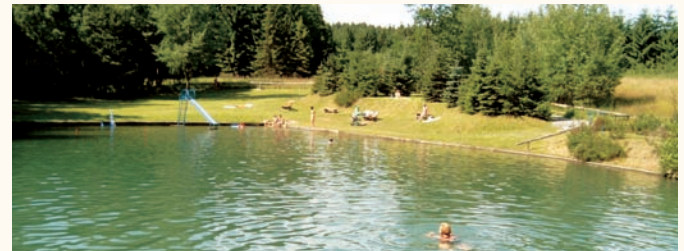
Mühlteich OT Jahnsbach

Tel. (03 72 97) 44 40 • Fax (03 72 97) 8 16 42 • Funk 01 71 / 435 54 50