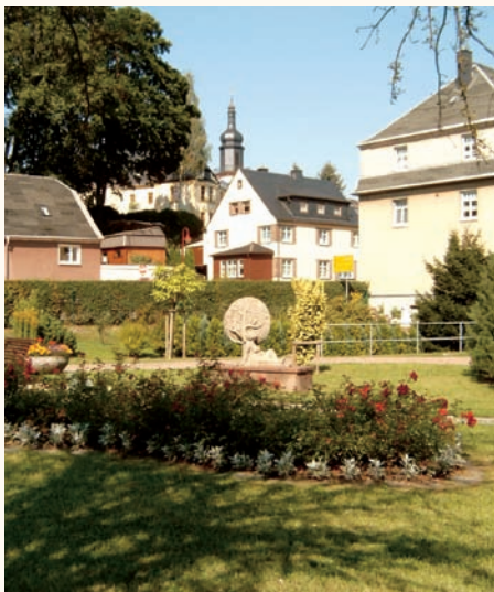
Blick von der Färberstraße Richtung Kirche im OT Thum