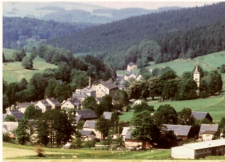
Blick auf den OT Herold