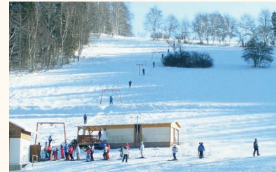
Skihang am „Löffelberg“ im OT Herold

Nähere Informationen über die Touristeninformation im Haus des Gastes „Volkshaus“ oder in der Stadtverwaltung