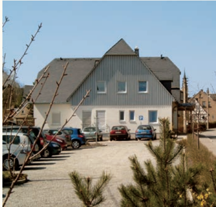
Arztpraxis im OT Jahnsbach