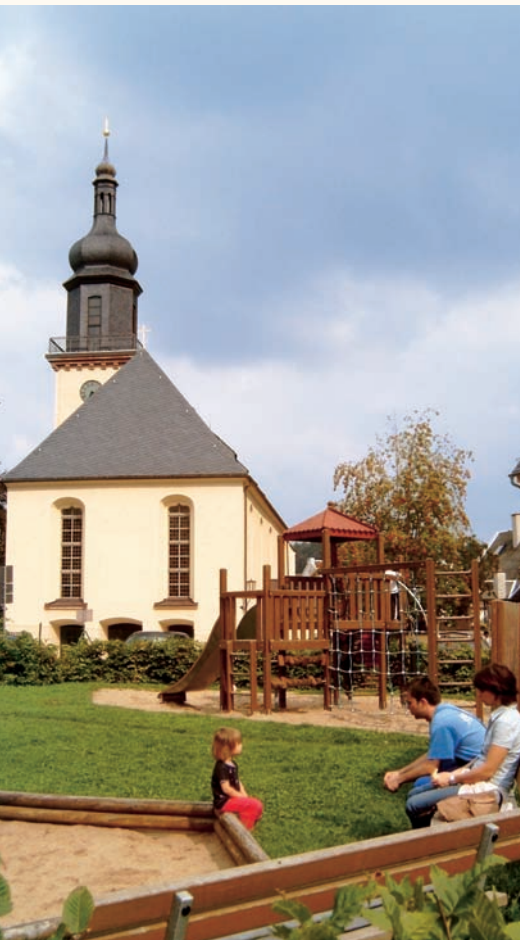
Spielplatz an der Kirche im OT Thum