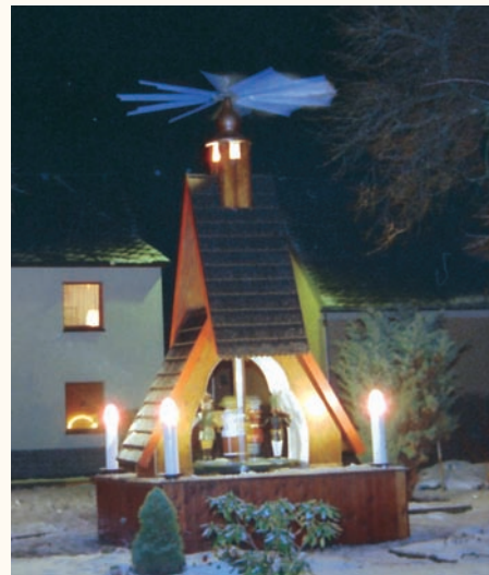
Weihnachtspyramide OT Herold

Der erste Weg zum finanziellen Erfolg: Ihr Weg zu uns.