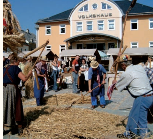
Naturmarkt auf dem Neumarkt

OT Herold – letztes Wochenende im September OT Jahnsbach – erstes Wochenende im Oktober OT Thum – zweites Wochenende im Oktober mit Schaustellern auf dem Neumarkt