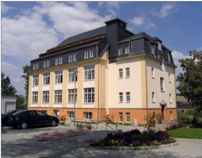
Bürgerhaus „Am Zechengrund“ Drebach

Postleitzahl: 09430 Venusberg; 09435 OT Griebbach Vorwahl: 03725 Amt Zschopau Landkreis: Mittlerer Erzgebirgskreis Reg.-Bezirk: Chemnitz Einwohner: per 30.06.2006: 2.337 Fläche: 11,3 km 2 Lage: im Seitental der „Zschopau“ Höhe: 335 bis 540 m über dem Meeresspiegel PBhf: Bahnstation Personenverkehr in Venusberg OT Wilischtal E-Mail: Gemeinde-Venusberg@t-online.de