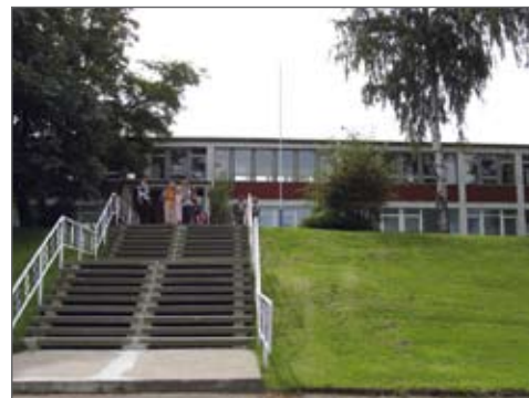
Grundschule in Drebach

Straße der Jugend 11, 09430 Drebach Tel.: 03 73 41/72 95, Fax: 03 73 41/7079 GS-Drebach@web.de