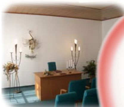
Trauraum im Verwaltungsverband „Grüner Grund“