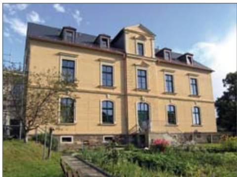
Grundschule in Venusberg