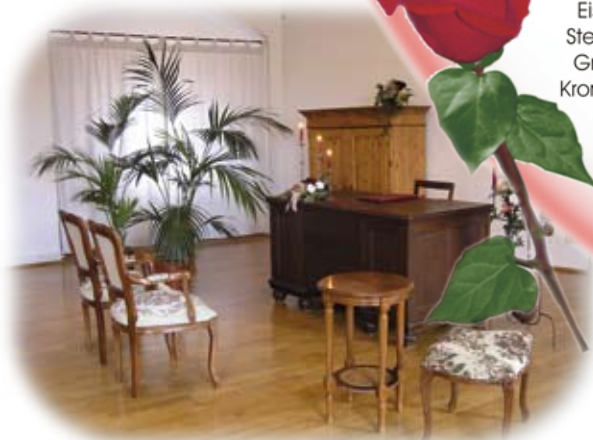
Trausaal Burg Scharfenstein

Wenn man sich entschieden hat, sich zu „trauen“, dann sollte man wissen, wann und wo man sich das Ja-Wort am schönsten Tag im Leben geben möchte.