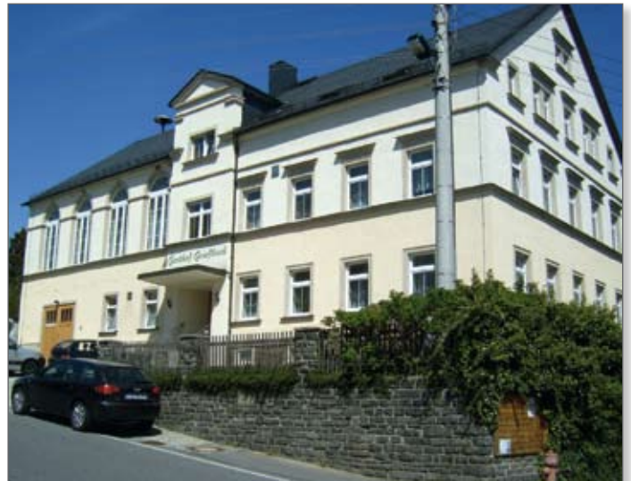
Dorfgemeinschaftshaus Ortsteil Griebbach