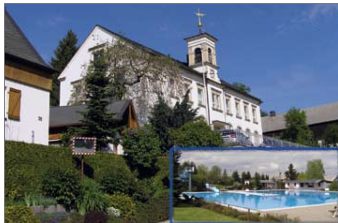
Venusberg Ortsteil Grießbach

Die ehemalige Gemeinde Grießbach war mit ihren Ortsteilen Wilischthal und Im Grund bis 1998 eine kleine Erzbergsgemeinde mit ca. 870 Einwohnern. Da sie ihre Eigenständigkeit aufgrund zu geringer Einwohnerzahlen im Zuge