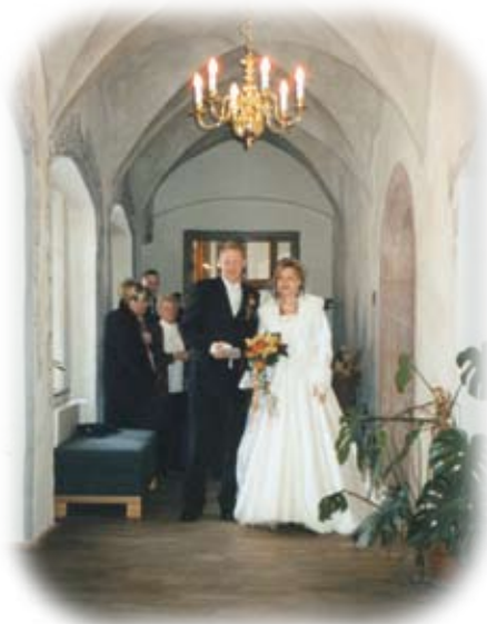
Kreuzgewölbengang zum Trausaal Burg Scharfenstein

www.hochzeitswegweiser.de www.verwaltungsverband-gruener-grund.de www.die-sehenswerten-drei.de