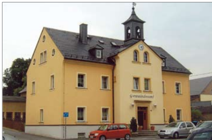
Gemeindeamt in Venusberg

Die erste urkundliche Erwähnung der Gemeinde Venusberg stammt aus dem Jahre 1414. Sicherlich ist die Gemeinde viel älter, jedoch muss man sich auf historisch gesicherte Dokumentationen, Fakten und Zahlen verlassen. Im Jahr 1981 konnte die Gemeinde Venusberg die 800-Jahrfeier begehen. Venusberg liegt in einem Seitental der „Zschopau“ und