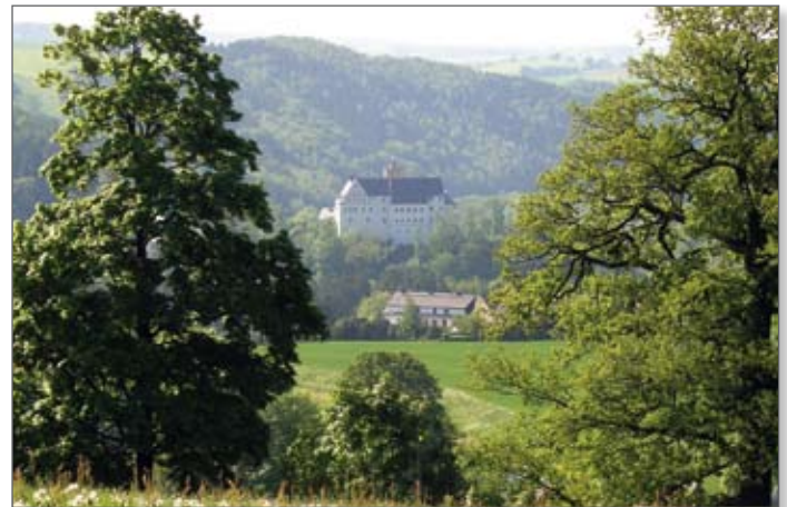
Blick zur Burg Scharfenstein

Valec, Prestanov und Chabarovice (Tschechische Republik), freundschaftliche Beziehungen unterhält die Gemeinde Venusberg zur Gemeinde Siegsdorf in Oberbayern, Ort Griesbach (zugehörig zur Gemeindeverwaltung Mähring in Großkonreuth) und zu Vereinen im Oberpfälzer Wald.