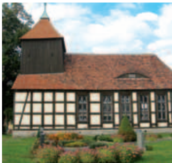
OT Schönberg (Mark)

Schönberg wurde 1525 erstmals „nach dem Schönenberge“ erwähnt. Mittelpunkt des Ortes ist die kleine Fachwerkkirche mit Friedhof auf dem erhöht gelegenen Anger. Im Bereich der Kirche sind größere Dreiseit- und Vierseitgehöfte zu finden, während sich kleinere Hofanlagen, wie für ein Straßendorf typisch, entlang der Straße aneinanderreihen.