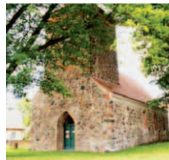
OT Vielitz, Kirche

Ortes. Entlang der Hangkante der Uferböschung erstreckt sich der ältere Teil, während der jüngere Ortsteil sich in Richtung Südosten ausdehnt. Der historische Kern liegt im Bereich der alten Feldsteinkirche. Sie steht erhöht auf dem Anger und ist von alten Kastanien und Linden umgeben. Von hier aus führt die alte Kopfsteinpflasterstraße parallel zum See. Ebenfalls zur Gemeinde gehört Vielitz-Ausbau, deren Ursprung ein