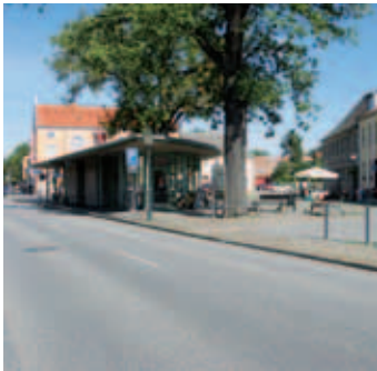
Stadt Lindow (Mark), Marktplatz

Das Jahr 1638 brachte in der Zeit des 30jährigen Krieges das „Ausgeliefert sein“ der Stadt mit sich: Im Oktober 1638 zogen die kaiserlichen Truppen unter Graf Matthias von Gallas durch Lindow und vernichteten das Kloster und die Stadt. In Flammen gingen auch Dörfer der Umgebung auf. Mit dem Edikt von Potsdam im Jahre 1685 rief der Kurfürst von Brandenburg, Friedrich Wilhelm, Kolonisten aus dem Ausland in die Mark. Nach Lindow kamen 1690 unter anderem Bauern aus der Schweiz, die teils in Lindow, teils in der Umgebung angesiedelt wurden. Durch diese Siedler wurden auch einige neue Gewerke wie Schneider, Hutmacher und Kornhüter hier eingeführt.