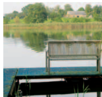
Blick zum OT Seebeck

Der östliche Dorfeingangsbereich wird durch eine als Naturdenkmal ausgewiesene alte Eiche markiert.