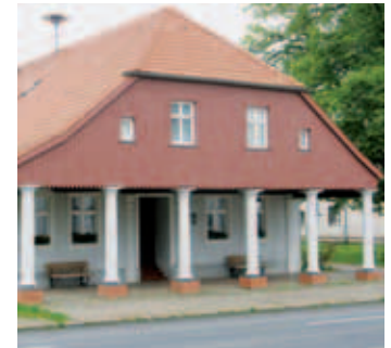
Gemeinde Rühnick, Vorlaubenhaus

Der eigentliche Ortskern erstreckt sich entlang einer heutigen Nebenstraße, die in die Durchgangsstraße mündet. An diesem Schnittpunkt steht ein märkisches Vorlaubenhaus, das gleichzeitig auch den Ortseingang von Norden her markiert.