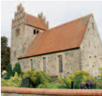
Gemeinde Herzberg, Kirche

Im Bereich des Angers mit der Kirche ist der ursprüngliche Ortskern erlebbar. Die Kirche (aus Feldstein mit markanter Klinkerverwendung) ist vom Kirchhof umgeben. Hervorzuheben ist das wunderschöne efeuberankte Friedhofsportal.