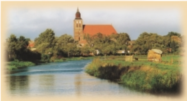
St.-Petri-Kirche mit Blick über die Tollense

Die Stadt hat ca. 6.600 Einwohner und versorgt als Unterzentrum einen Einzugsbereich von etwa 10.000 Einwohnern.