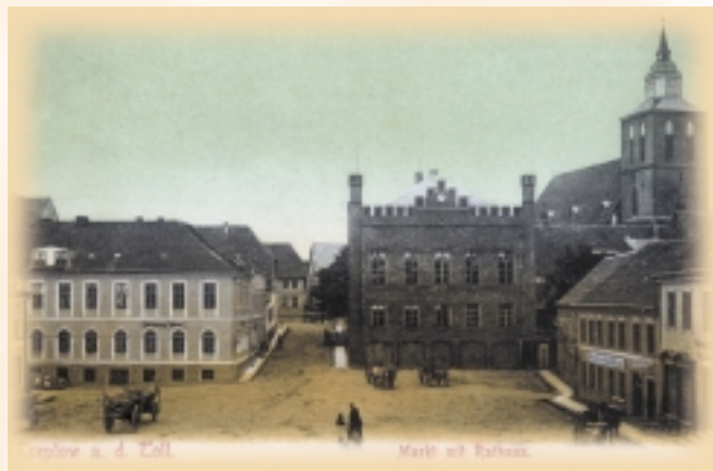
Marktplatz mit Rathaus