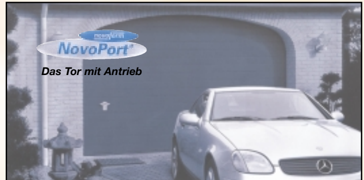
Das Tor mit Antrieb

Telefon: 03961/215254 Fax: 03961/215255 Funk: 0172/3115976 Privat: 03961/210994