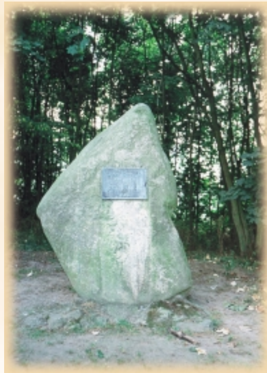
„Fritz Reuter“ Gedenkstein

Die Begräbnisstätte der Familie Peters befindet sich in Siedenbollentin. Siedenbollentin befindet sich ca. 10 km von Altentreptow entfernt.