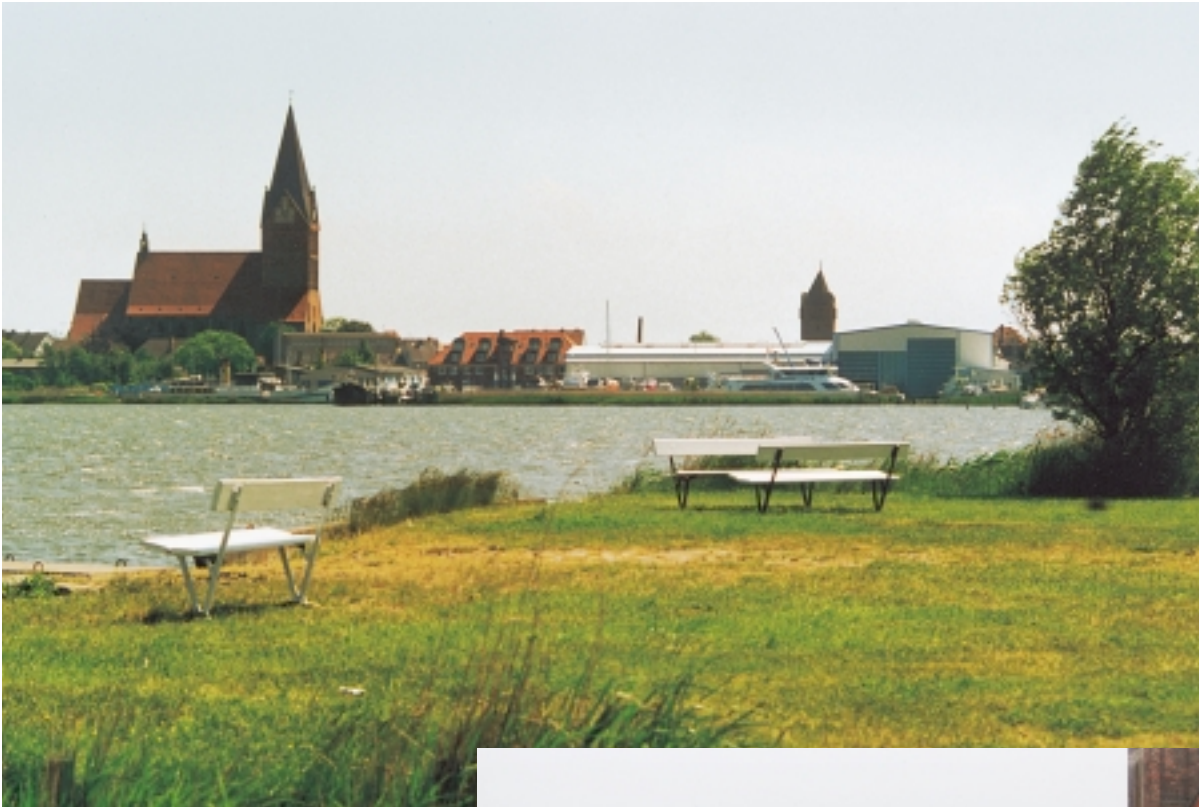
Blick vom Borgwall zum Hafen