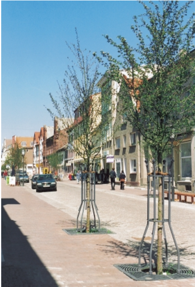
Lange Straße Barth