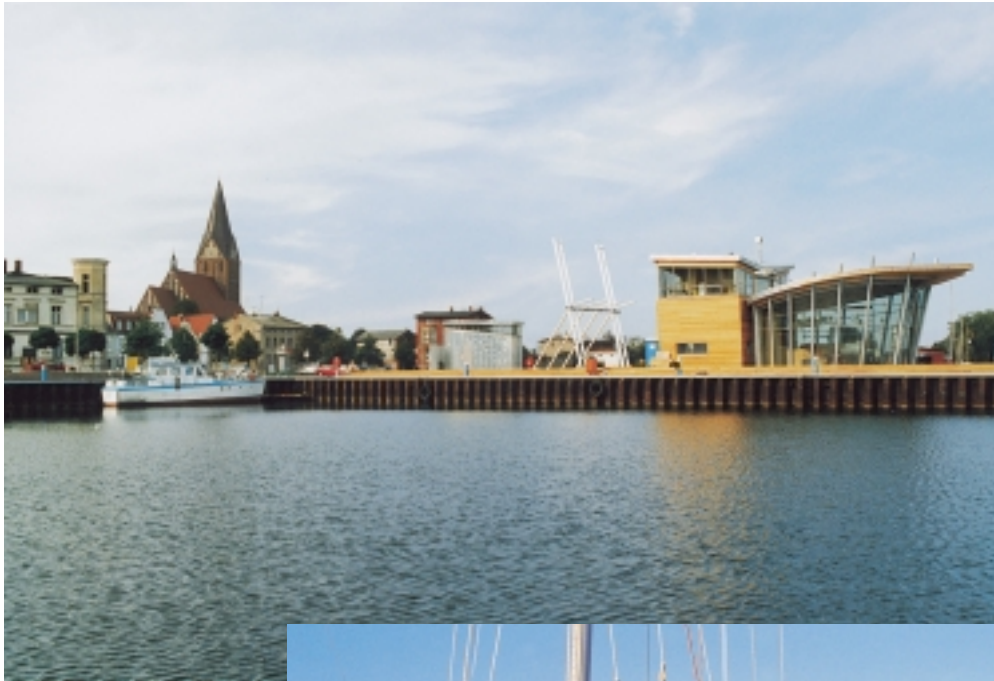
Hafen „Haus des Gastes“