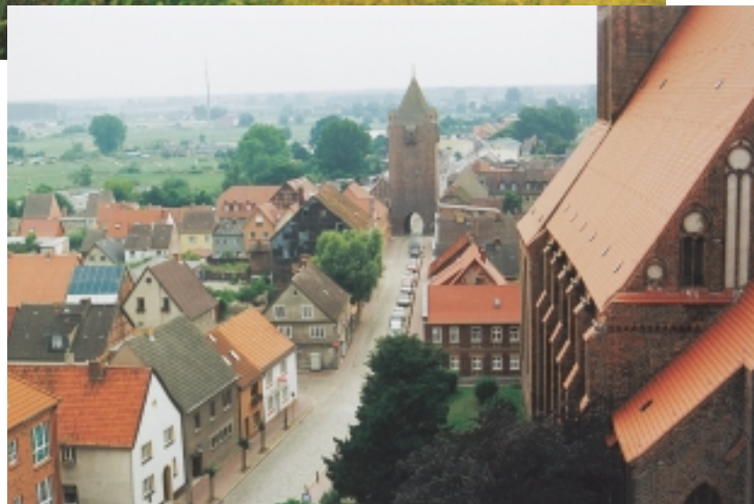
Blick zum Dammtor