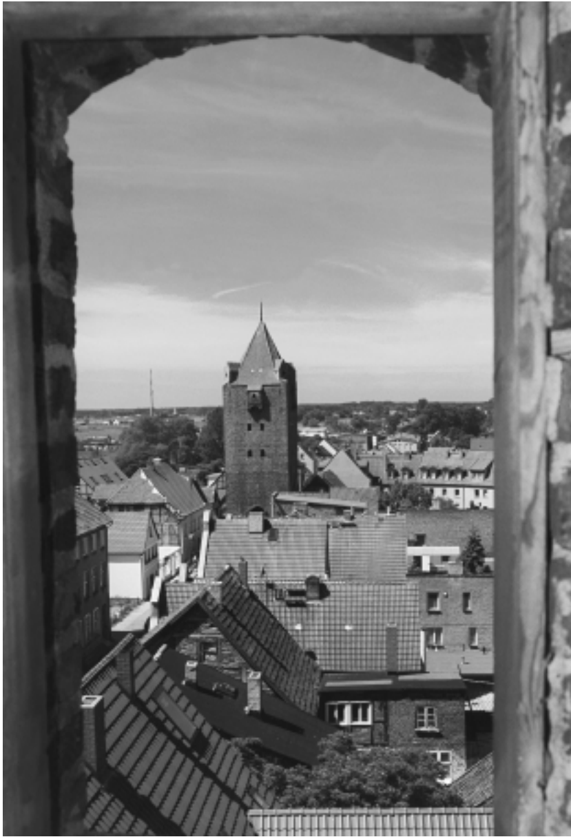
Blick vom Kirchturm zur Altstadt