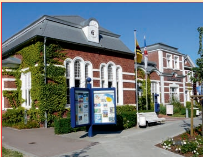
Haus des Gastes

Tel.: (038393) 376-0 Fax: (038393) 3 24 30 E-Mail: Sekretariat@nordprojekt.com