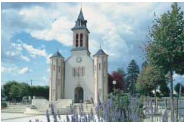
Kirche St. Germain du Puy

Der Partnerschaftsvertrag wurde im Mai 1994 in Gadebusch unterzeichnet.