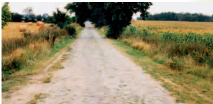
Historische Pflasterstraße bei Frauenmark, Gemeinde Veelböken

Veelböken ist mit 754 Einwohnern und 3.254 Hektar eine Gemeinde mit wenig Einwohnern auf großer Fläche. Veelböken besteht aus den