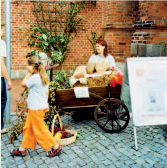
Herbstmarkt auf dem Gadebuscher Marktplatz