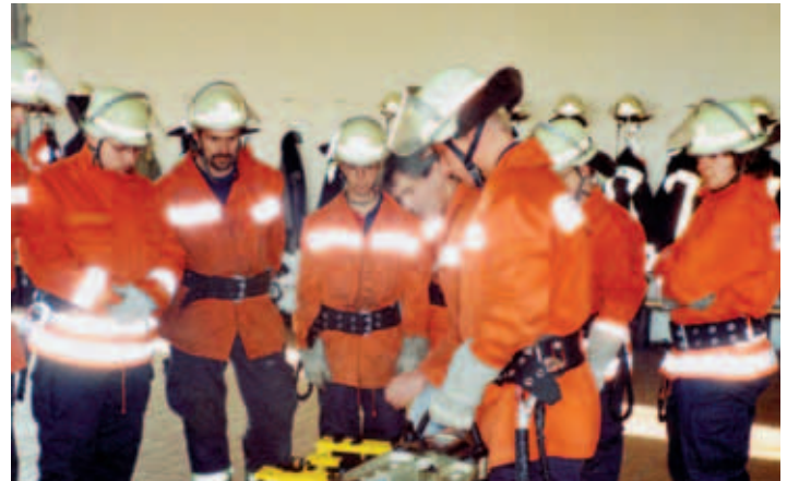
Gadebuscher Feuerwehrleute beim Training