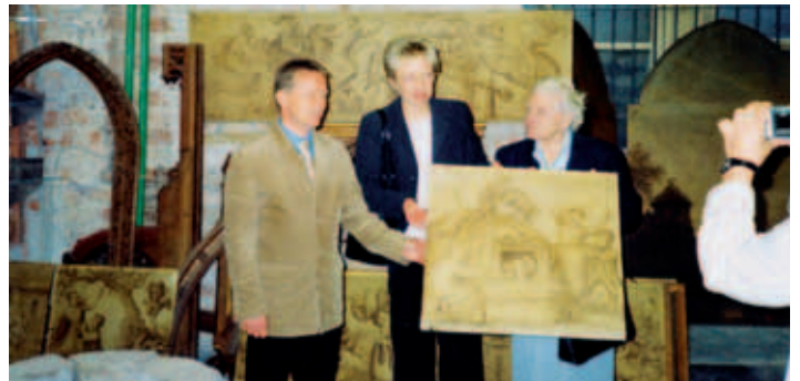
Kunstschätze aus dem abgerissenen Schloss Dutzow

Ein besonderer Anziehungspunkt ist der Arche-Hof des Lebenshilfe-werkes. Hier werden behinderte Menschen aller Altersgruppen betreut.