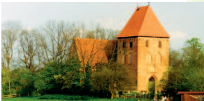
Alte Johanniterkirche in Groß Eichsen

Als größerer Ort in optimaler Lage zwischen Wismar und Schwerin sowie Grevesmühlen und Gadebusch hat die Gemeinde Mühlen Eich-