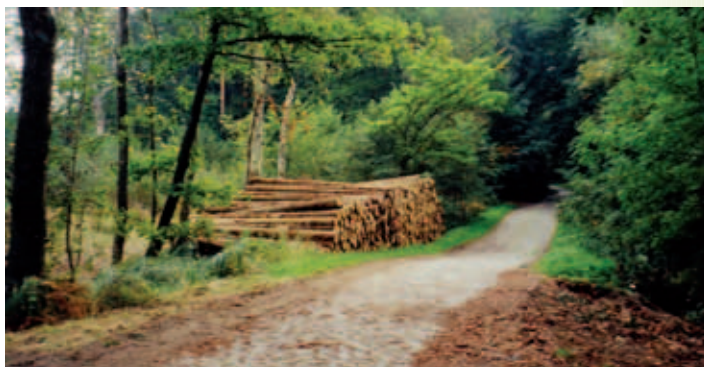
Waldweg bei Gadebusch

Als erste Hallenkirche zwischen Elbe und Oder ist die Stadtkirche eine der bedeutendsten Kirchenbauten Norddeutschlands. Der romanische Teil, das Kirchenschiff mit dem schönen Südportal, wurde wahrscheinlich zwischen 1210 und 1230 erbaut und der Turm am Anfang des 14. Jahrhunderts. Der Chor zeigt typische Merkmale der Gotik und