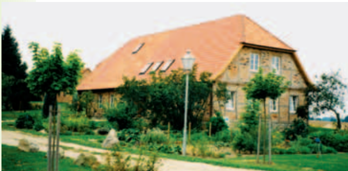
Wohnen in der Natur bei Neu Dragun

Natur und Infrastruktur der Gemeinde (Straßen, Wasserversorgung, Erdgasversorgung, Abwasserentsorgung) sowie die Nähe zu Schwerin und Gadebusch machen Dragun und seine Ortsteile zu einem gefragten Standort für den Bau von Eigenheimen und Wohnungen. Die Einwohnerzahl der Gemeinde hat sich von 530 (1991) auf heute fast 800 Einwohner erhöht. Es sind auch noch Baulücken für die Zukunft vorhanden. In Vietlütbe steht die älteste Dorfkirche Mecklenburgs, deren Ursprung auf das 12. Jahrhundert zurückgeht. Die Kirche ist im romanischen Stil gebaut und wurde in den vergangenen Jahren mit viel Liebe und Aufwand restauriert.