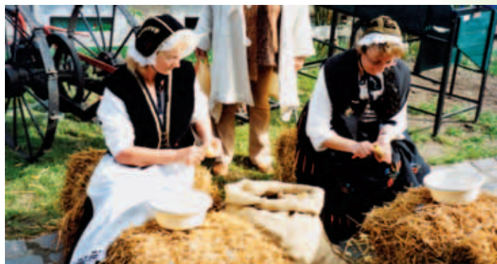
Frauen in Mecklenburger Tracht beim Kartoffelschälen

Im besten Fall hat das Sport- und Freizeitangebot einer Gemeinde für jeden etwas zu bieten: Von den Kleinsten bis hin zu den jungen Erwachsenen, Eltern und Senioren wollen alle fit und beschäftigt sein. Sowohl die Stadt Gadebusch als auch die amtsangehörigen Gemeinden liegen eingebettet in eine wundervolle Naturlandschaft, die zu vielseitigen Freizeitaktivitäten an der frischen Luft einlädt. Sind Sie gern mit dem Rad oder zu Fuß unterwegs, erkunden mit Ihrem Pferd die Gegend oder verbringen Ihre Freizeit am liebsten mit der Angel in der Hand? Für alle diese Aktivitäten bieten sich in der Region die besten Möglichkeiten. Außerdem versüßen zahlreiche regelmäßig stattfindende Veranstaltungen den Bewohnern und Besuchern der Region die freie Zeit. Maifeste, Erntefeste, Aktivitäten der Vereine und Feuerwehrtreffen bieten das ganze Jahr über die Gelegenheit zum geselligen Beisammensein.