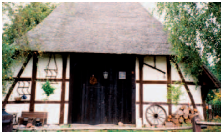
Altes Bauernhaus in Botelsdorf, liebevoll restauriert

Amt Gadebusch Am Markt 1, 19205 Gadebusch Telefon: 03886 2121-0 Telefax: 03886 2121-21 E-Mail: hauptamt@gadebusch.info Internet: www.gadebusch.de