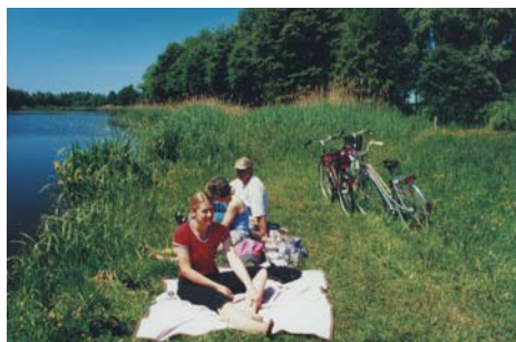
Rast an der Krainke