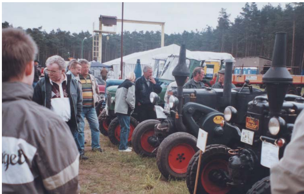
Oldtimer und Lanz-Bulldog Freunde Kaarßen e.V.