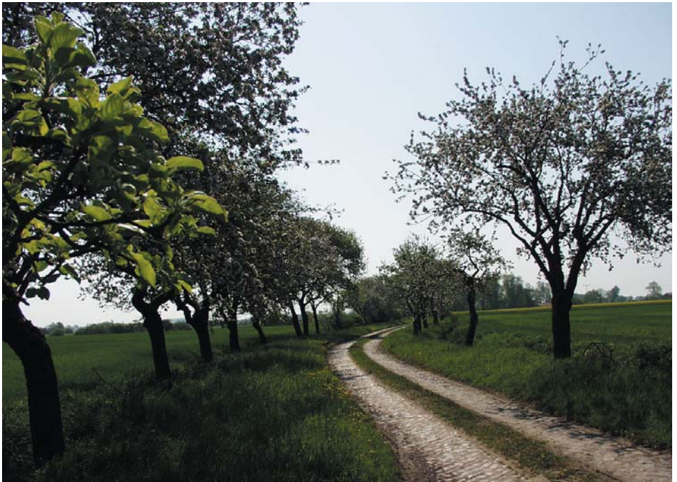
Obstbaumallee im Amt Neuhaus