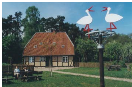
Storkenkarte in Preten