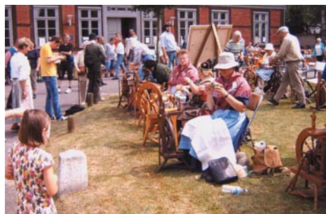
Marktplatzfest in Neuhaus