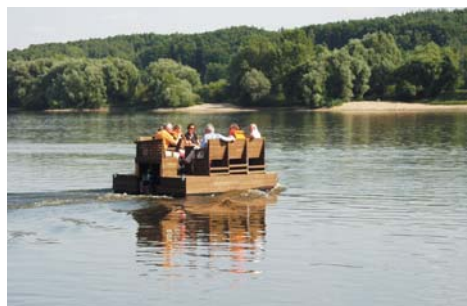
Vom Floss aus die Natur der Elbtalau erleben