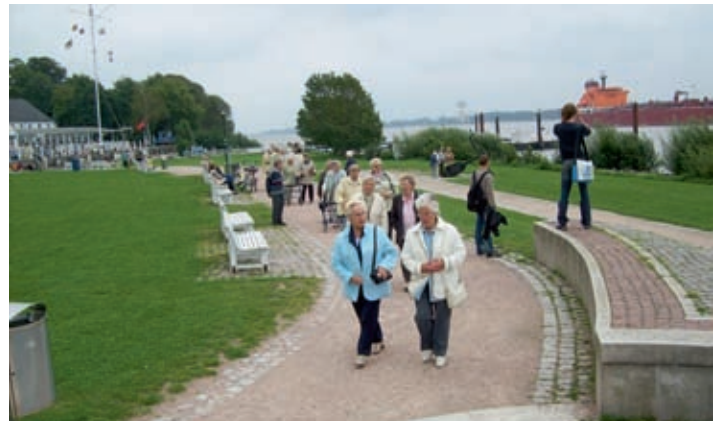
Foto links und rechts: Gemeinde Neu Wulmstorf, Seniorenausfahrt August 2008