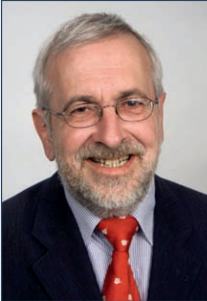
Wolf-Egbert Rosenzweig Bürgermeister