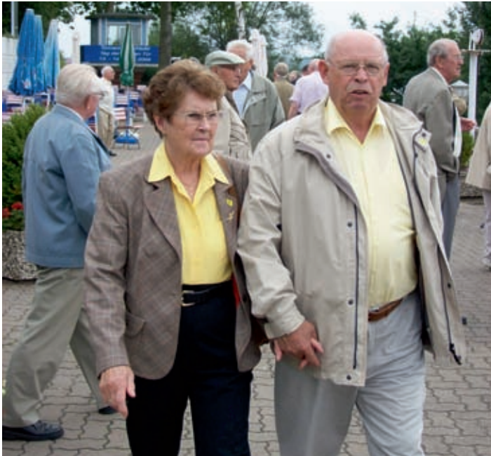
Gemeinde Neu Wulmstorf, Seniorenausfahrt August 2008

Antragsformulare liegen im Flur der Sozialabteilung im Rathaus Neu Wulmstorf bereit.