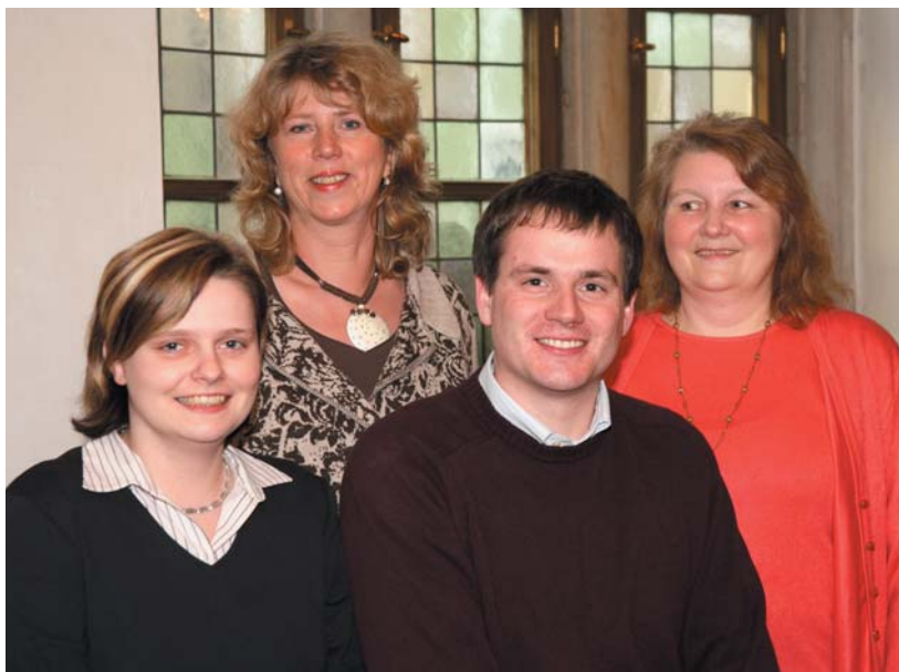
Ihre AnsprechpartnerInnen im Standesamt

Diese Bescheinigungen sollten in der Regel nicht älter als 1 Woche sein. Für ausländische Staatsangehörige gelten besondere Vorschriften.