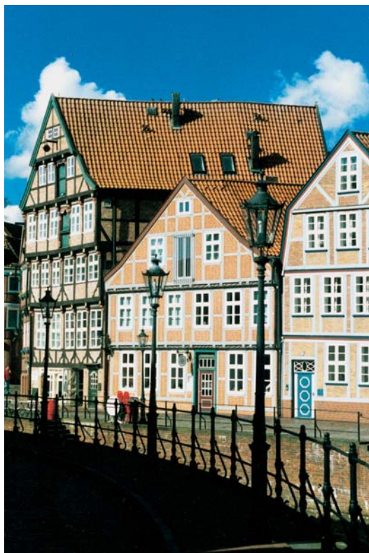
Wasser Ost am Alten Hafen

Auch wenn Stade von den verschärften wirtschaftlichen Rahmenbedingungen nicht unberührt geblieben ist, so hat die Stadt, mit heute gut 46.000 Einwohnerinnen und Einwohnern, doch als Standort moderner Industrie-, Gewerbe- und Dienstleistungsunternehmen weiterhin gute Wachstumschancen.