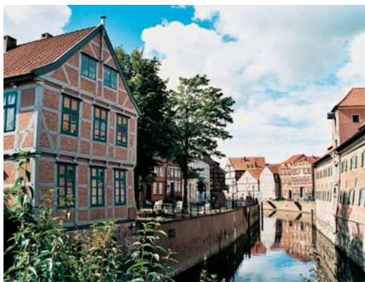
Blick in den Alten Hafen mit Schwedenspeicher

Dem Kraftwerk, seit 1962 in Betrieb, folgte sehr schnell die Stader Saline, die in niederländischen