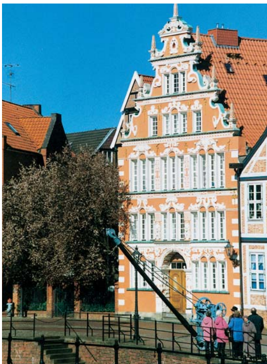
Wasser West am Fischmarkt

1209 erhielt die Stadt das volle Stadtrecht und trieb bereits eine weitgehend selbständige Außenpolitik.