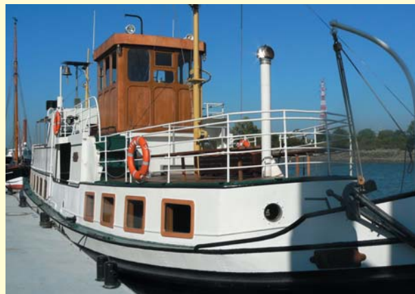
Trauung auf der MS Lühe