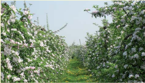
Blüten der Obstbäume

Die Samtgemeinde Lühe, gebildet aus den Gemeinden Grünendeich, Guderhandviertel, Hollern-Twielenfleth, Mittelnkirchen, Neuenkirchen und Steinkirchen, liegt im Herzen des Alten Landes, bekannt als das größte zusammenhängende Obstanbaugebiet Nordeuropas. Die Landschaft ist geprägt durch Millionen von Obstbäumen, durchzogen von