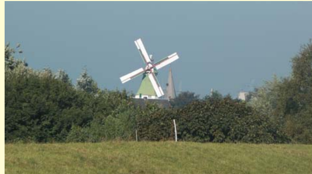
Mühle Venti Amica

niedergelassen und verdienen ihr Brot als Elblotsen, d.h. sie lotsen die großen "Pötte" von der Elbmündung bis in den Hafen Hamburg.