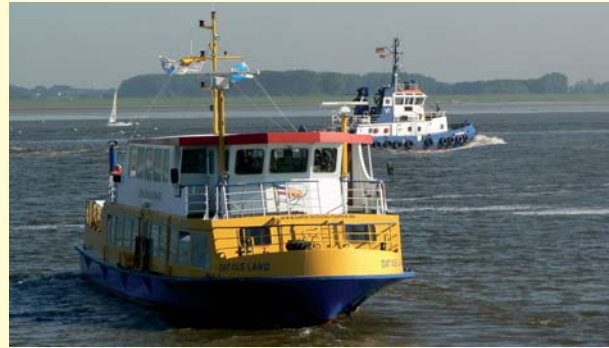
Lühe Schulau Fähre

rd. 10.000 Einwohnern der Samtgemeinde ist ein wesentlicher Teil im Erwerbsobstbau tätig. Die unmittelbare Nähe der Elbe führt ferner dazu, dass viele Schifffahrtsbetriebe hier angesiedelt sind. Die Orte Grünendeich und Twielenfleth werden als "Lotsen-Dörfer" bezeichnet. Kapitäne, die nicht mehr über die Weltmeere "schippern", haben sich hier