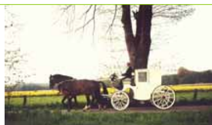
Braaker Straße 18 • 23701 Eutin Tel. 04521/2692 • Fax 04521/73187 info@holsteiner-kutschfahrten.de