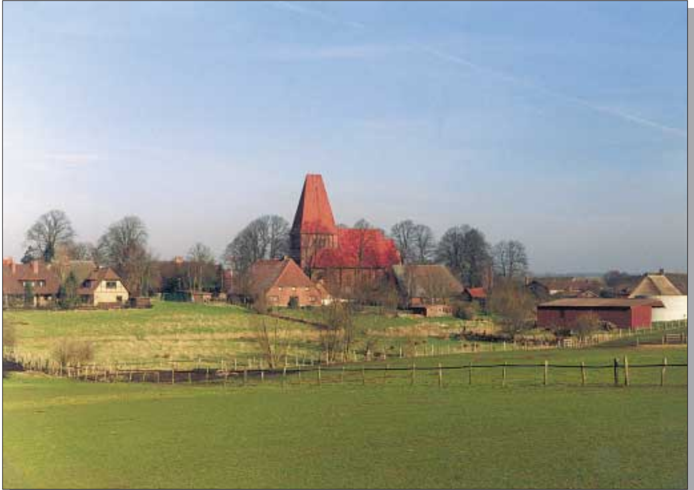
Gemeinde von Nusse