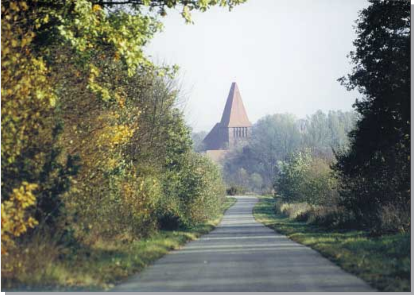
Kirche in Nüsse