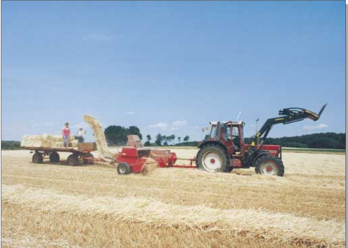
Landwirtschaft – Ernteeinsatz