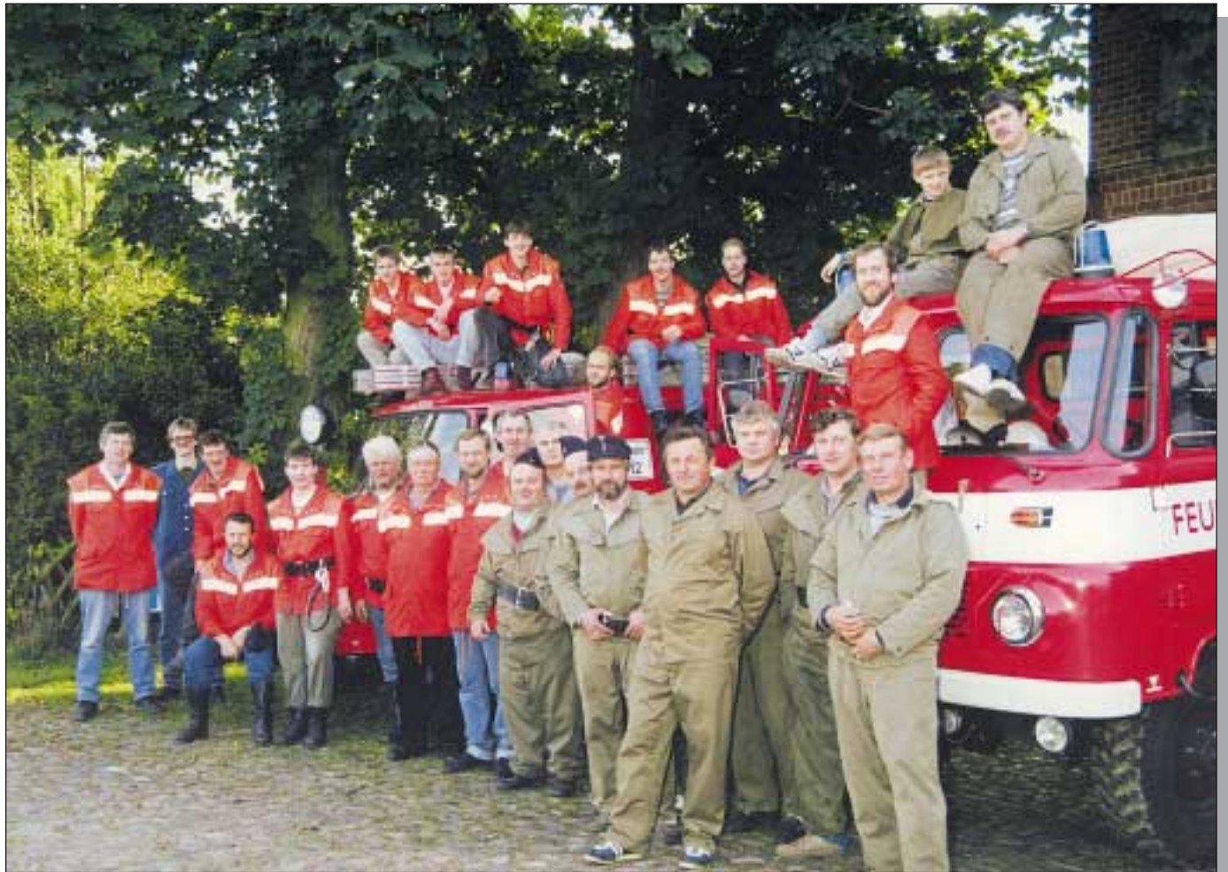
Die „Feuerwehr“ – Helfer und Retter Kulturträger der Gemeinden Kameradschaftspflege