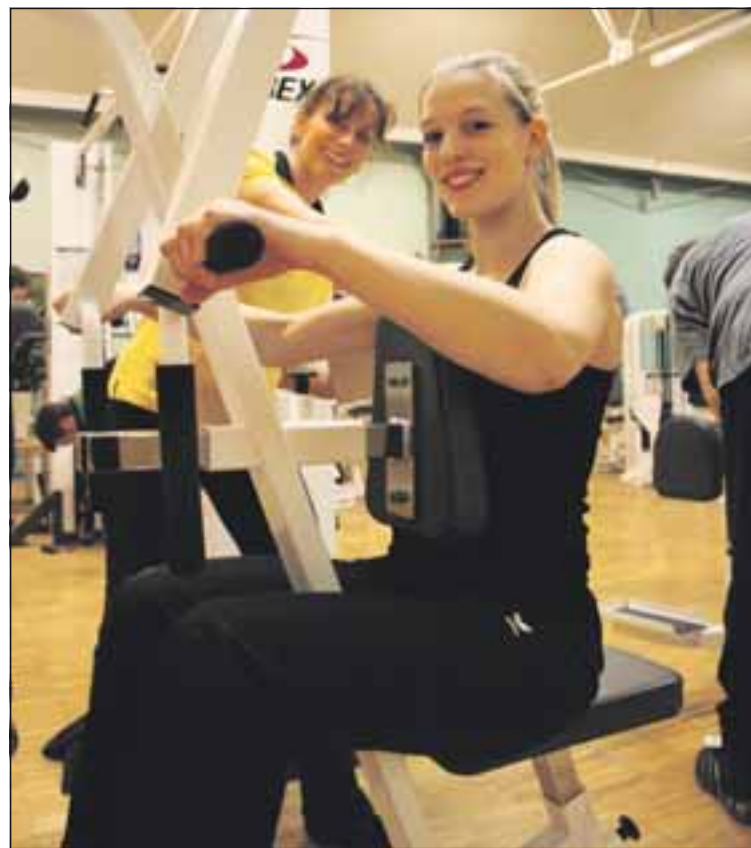
Das Fazit der Testpersonen: Es war super, dass alle Geräte und sogar die Kurse ausprobiert werden konnten.