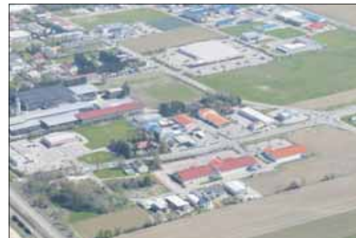
Im Gewerbegebiet Ost, östlich der Bahnlinie Augsburg-Kaufering, ist ein interessanter Branchenmix entstanden.