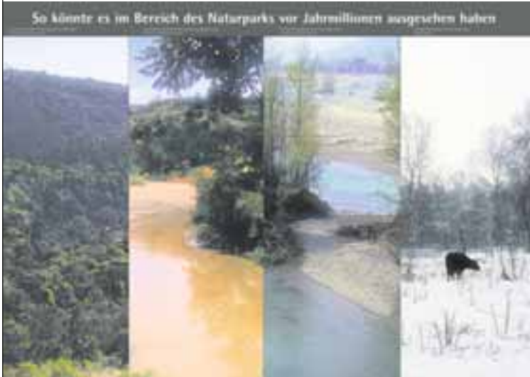
So könnte es im Bereich des Naturparks vor Jahrmillionen ausgesehen haben

Das Naturpark-Haus ist täglich außer montags von 10 bis 17 Uhr geöffnet. Führungen durch die Dauerausstellung können beim Naturparkverein vereinbart werden, Telefon 0821 / 3102-2278. Informationen gibt es auch im Internet unter www.naturpark-augsburg.de