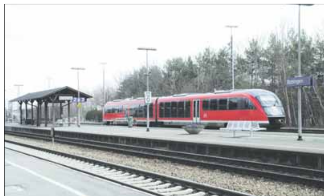
In Bobingen lässt es sich gut arbeiten und wohnen – und gut erreichbar ist die Stadt allemal.

Als weitere Freizeitmöglichkeiten seien neben den zahlreich vorhandenen Sportplätzen und Sporthallen folgende Einrichtungen stichpunktartig erwähnt: Der Grillplatz am Leitenberg, die Großgolfanlage in Burgwalden, Kegelbahnen, eine Reitanlage, Minigolf- und Tischtennisplätze, ein Naturlehrpfad, ein Trimm-Dich-Parcours sowie ein Inliner-Hockeyplatz und eine Skate-Board-Bahn runden das vielfältige Angebot ab.