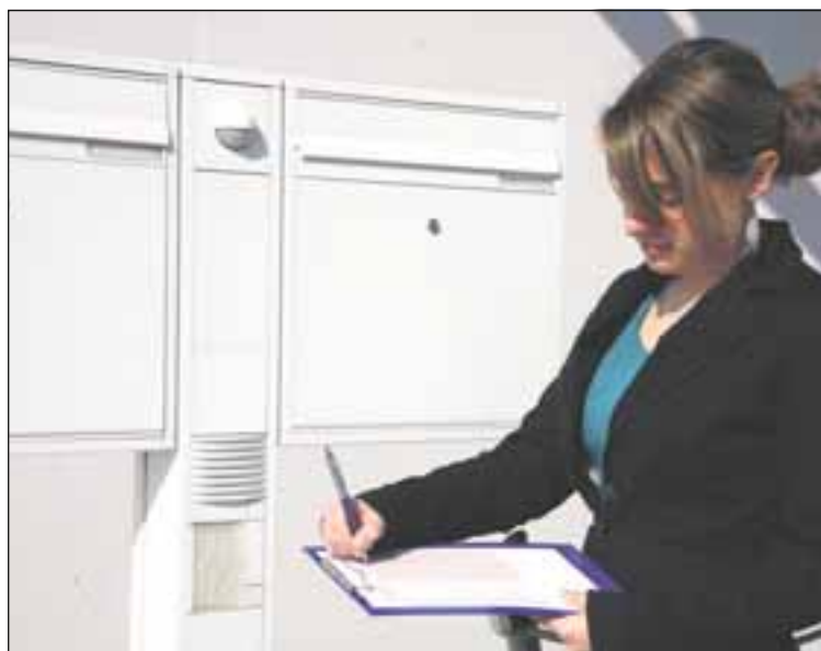
Die Vor-Ort-Überprüfung ist ein wichtiger Teil im Qualitätsmanagement.