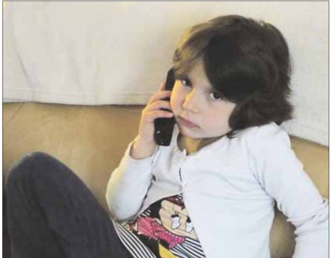
0800 6522265 – unter dieser Nummer wird Kindern und Jugendlichen geholfen.