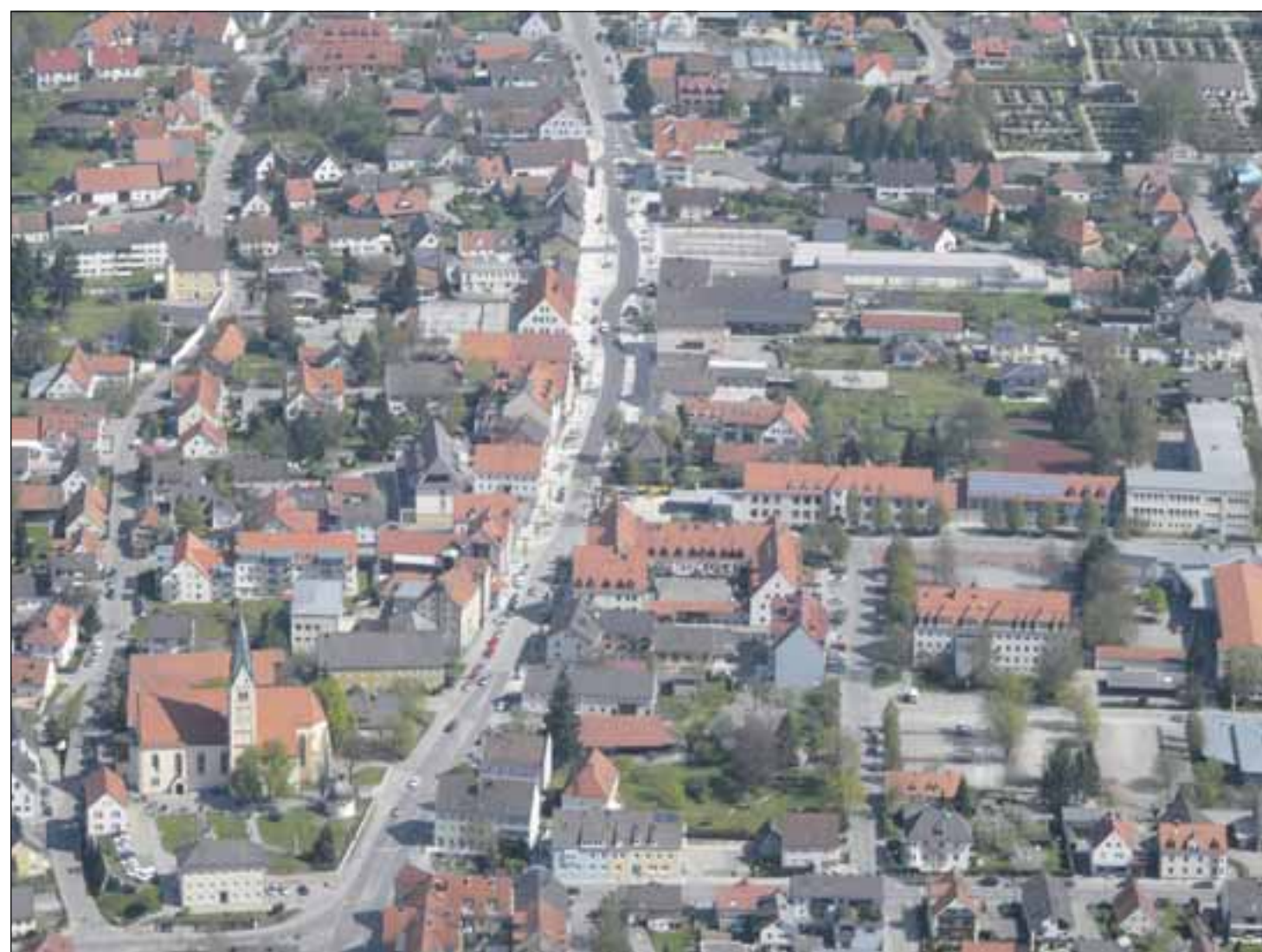
Die Innenstadt Bobingens lädt zum Flanieren ein und ist allzeit einen Besuch wert.