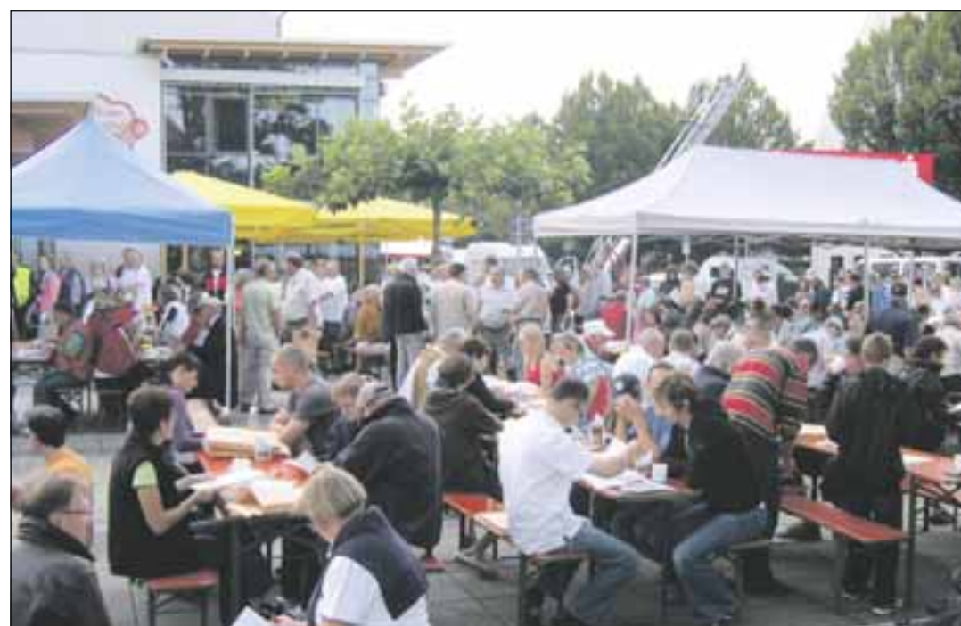
Die Oldtimerrallye zog zahlreiche Besucher an.

Die Nähe zum Naturpark Westliche Wälder, die Singold-Aue inmitten der Stadt, die attraktiven Wohnlagen, das gute Versorgungsniveau und die Lage vor den Toren der Schwabenmetropole Augsburg macht Bobingen interessant für Unternehmen und Arbeitnehmer. Bobingen bietet Naturerlebnis und Erholung ebenso wie ein reichhaltiges Kultur- und Bildungsangebot und viele Erwerbsmöglichkeiten.