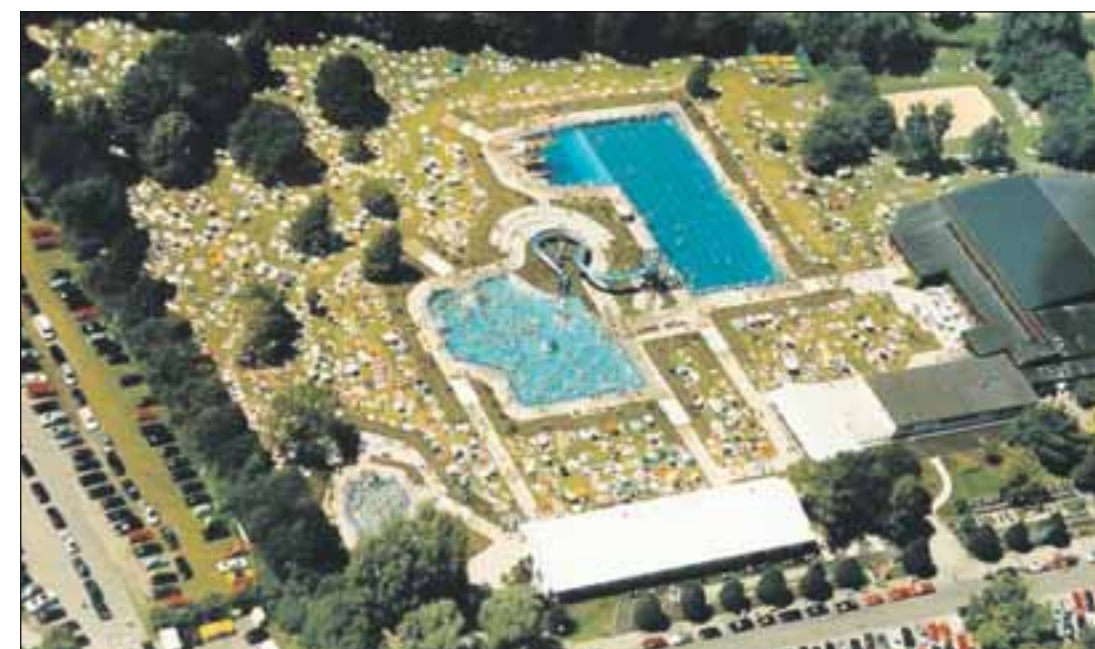
Das Aquamarin ist vor allem im Sommer der Treffpunkt Nummer eins in Bobingen.

Ein wirkliches Badejuwel stellt das Bobinger Frei- und Hallenbad „Aquamarin“ dar.