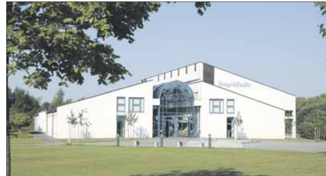
Neben zahlreichen Menschen, die im Industriepark Bobingen arbeiten, verhilft die Singoldhalle Bobingen der Stadt zu einem interessanten Veranstaltungsort.

Die überwiegende Zahl der sozialversicherungspflichtig Beschäftigten in Bobingen arbeiten im produzierenden Gewerbe. Allerdings ziehen die modernen Dienstleistungen am Standort Bobingen kräftig nach: So entwickelt sich Bobingen von der Industriestadt zu einem Standort mit einem höchst interessanten