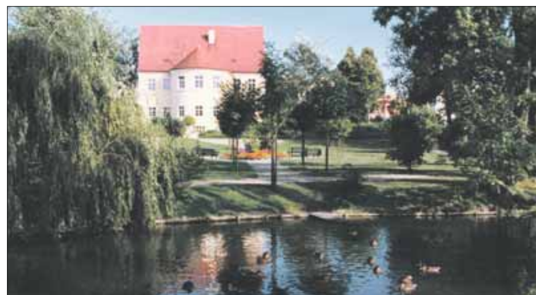
Natur pur und ein Touch Romantik erwarten die Besucher des Schlosschenparks.