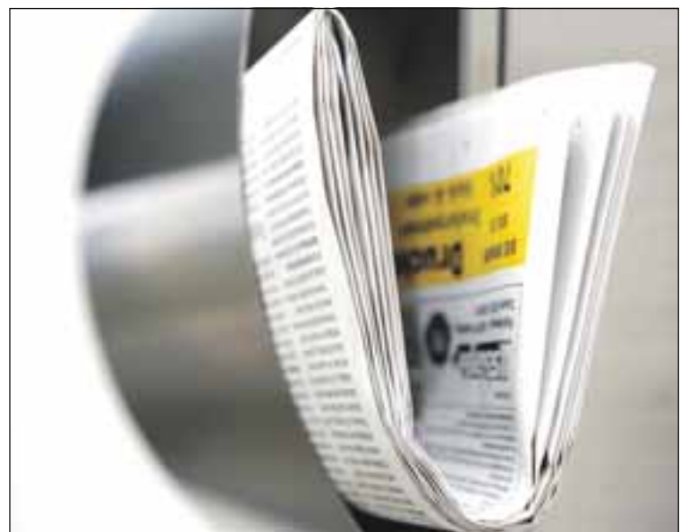
Rund 5000 Zusteller sorgen dafür, dass die Printprodukte ordentlich und zuverlässig im Briefkasten landen.