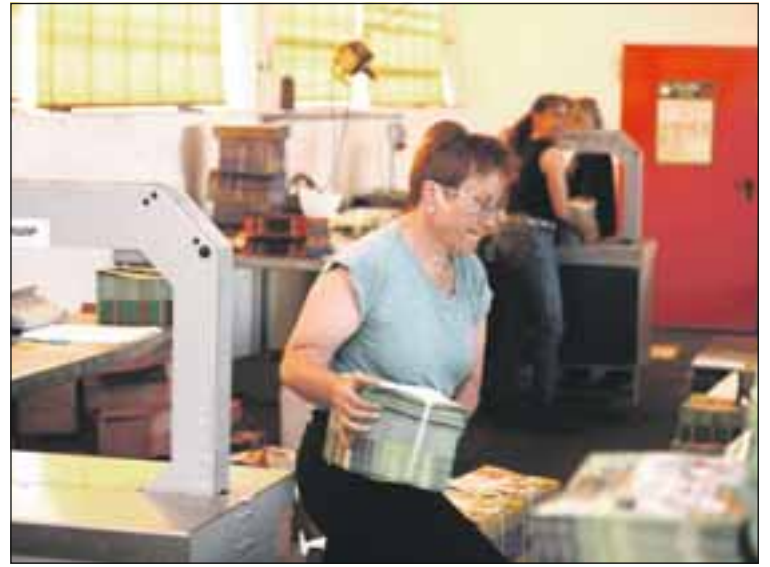
Im 1. Schritt werden die Drucksachen nach der vorgegebenen Stückzahl verpackt und den Verteilbezirken zugeordnet.

Interessierte Austräger können sich unter der Nummer 0821-455165-54 oder im Internet unter www.direktwerbungbayern.de melden.