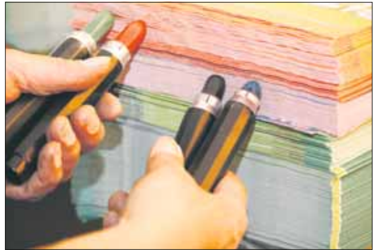
Die Farbcodierung ist für das Qualitätsmanagement nötig.