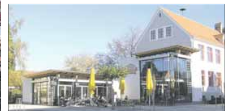
Wer möchte im Bobinger Zentrum nicht die Sonne genießen?