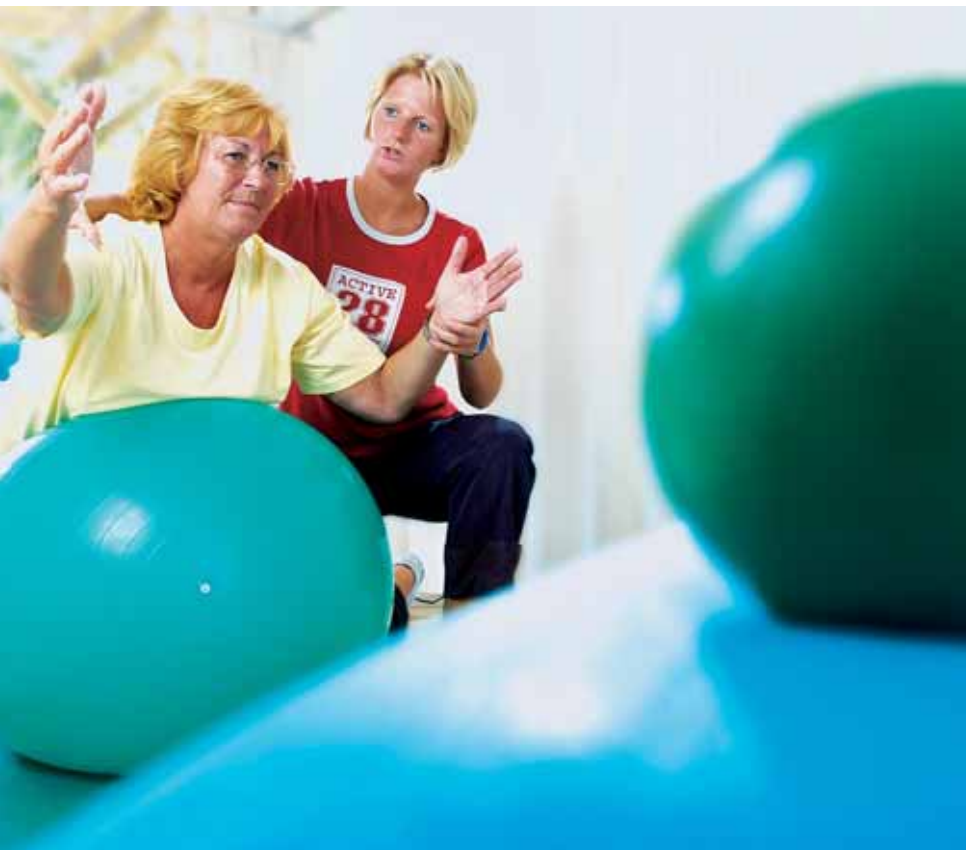
Krankengymnastik / Koordinationstraining

Physiotherapeutische Einzeltherapie für Patienten bei denen die eingeschränkte Belastbarkeit und / oder die Schwere der Erkrankung eine individuelle Therapie erfordern: