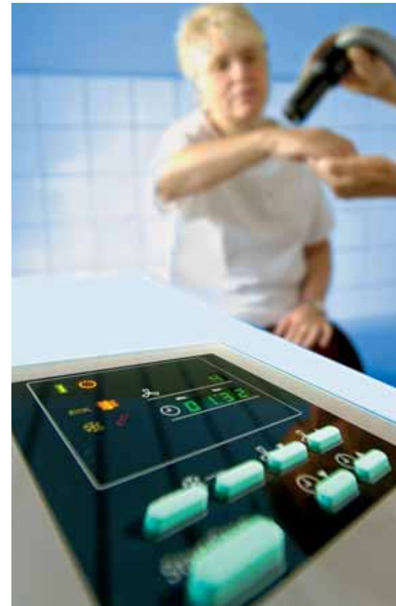
Kältebehandlung gegen den Schmerz