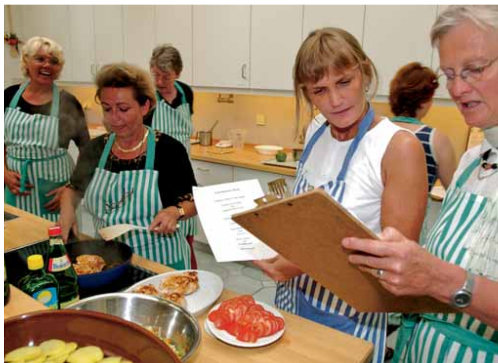
Lernen Sie mit unseren Diätassistentinnen die gesunde Küche kennen