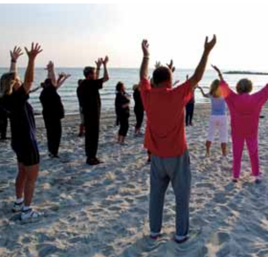
Gymnastik am Strand

Die im Therapieplan verordneten Medikamente werden Ihnen von der für Sie zuständigen Stationschwester ausgehändigt. Mitgebrachte, zu kühlende Medikamente können auf der Station im Kühlschrank gelagert werden.