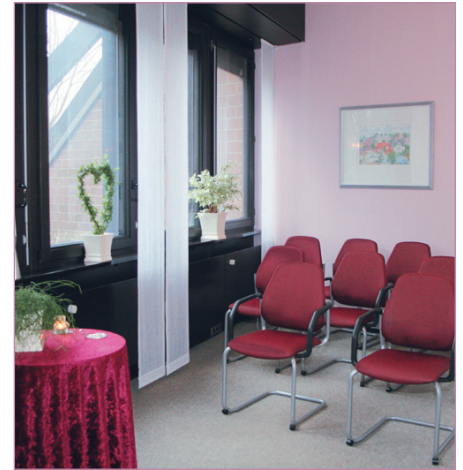
Trauzimmer im Neuen Rathaus

Auch im Neuen Rathaus von Rendsburg können Sie sich das Ja-Wort geben. Hier lautet das Motto „klein aber fein“. Unser Trauzimmer bietet den passenden Rahmen für eine Hochzeitsgesellschaft von bis zu acht Personen.