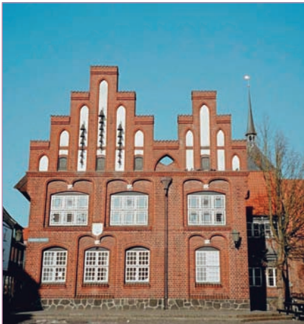
Altes Rathaus, Außenansicht

Das Gebäude wurde bereits im 16. Jahrhundert erbaut und mehrfach eingreifend restauriert.