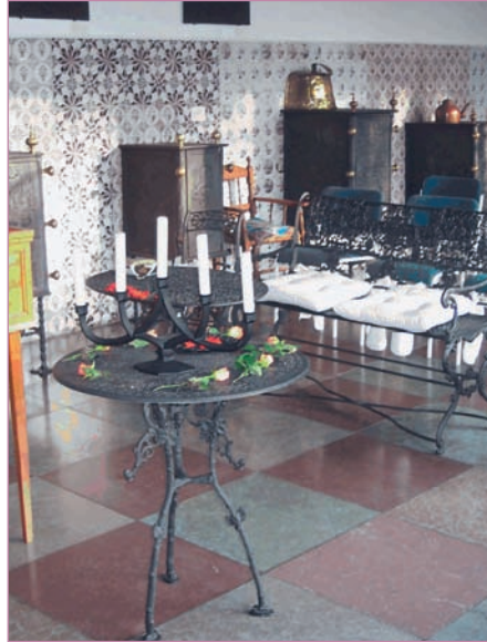
Trauzimmer im Eisenkunstgussmuseum

Zwischen Billeger-, Etagen- und Säulenöfen mit 250 Jahre alter Geschichte, Kaminplatten, Broschen, Medaillons und Halsketten können Sie sich hier das Ja-Wort geben.