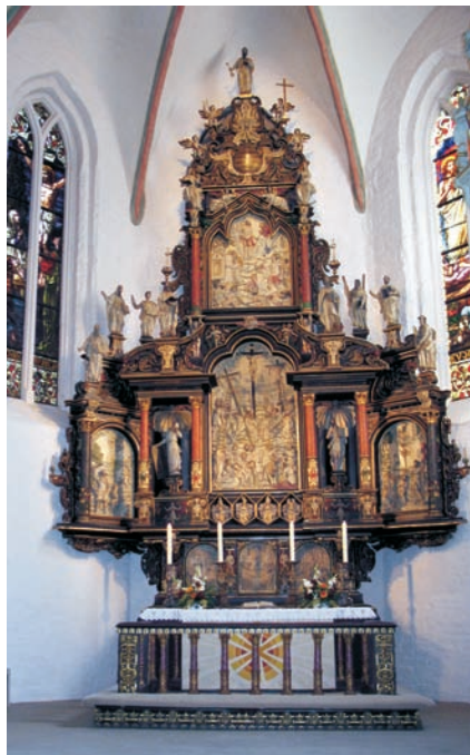
Altar in der St.-Marien-Kirche, Rendsburg