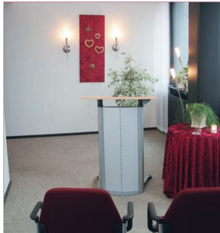
Trauzimmer im Neuen Rathaus

Auch im Neuen Rathaus von Rendsburg können Sie sich das Ja-Wort geben. Hier lautet das Motto „klein aber fein“. Unser Trauzimmer bietet den passenden Rahmen für eine Hochzeitsgesellschaft von bis zu acht Personen.