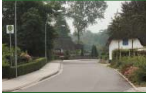
Blick ins Dorf, Idstedt

Das Klärwerk konnte bereits im Jahre 2000 in Betrieb genommen werden. Im Zuge dieses Baues werden auch die Straßen neu gestaltet. Im Jahre 2000 ist ebenfalls ein neues Baugebiet erschlossen worden, um für junge Familien eine Baumöglichkeit zu schaffen. Eine Erweiterung ist geplant. Die Gemeinde verfügt über ein sehr gut ausgestattetes Sportschützenheim. Ferner konnte der Sportplatz so umgestaltet werden, dass auch Kindern vielfältige Spielmöglichkeiten geboten werden. Direkt am Sportplatz liegt die im Gemeindeeigentum stehende Gaststätte „Zur Alten Schule“. In der Gemeinde besteht ein vielfältiges Vereinsleben, deren Aktivitäten im Kulturkreis Idstedt gebündelt und koordiniert werden. Die Gemeinde Idstedt hat eine Chronik herausgegeben, die über das Amt Schuby (Telefon 04621/945014) bezogen werden kann.