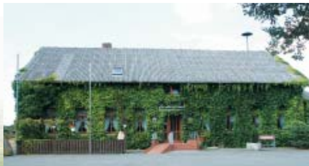
Gaststätte „Zur alten Schule“, Idstedt