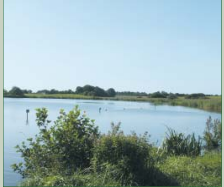
Badestelle Arenholzer See