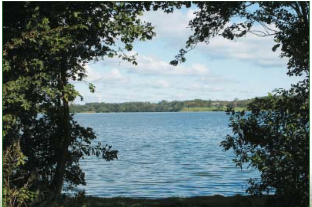
Arenholzer See, Lürschau