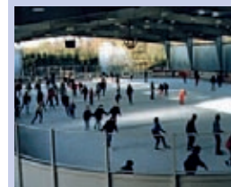
Eissporthalle von Oktober bis März