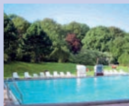
Schwimmbad ganzjährig (nicht nur für Hotelgäste)

An der B 200 • D-24955 Harrislee Telefon (04 61) 70 20 • Telefax (04 61) 70 27 02 E-Mail: info@hotel-des-nordens.com Internet: www.hotel-des-nordens.com