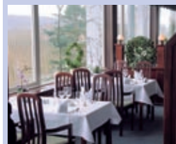
20–500 Personen können bei uns feiern