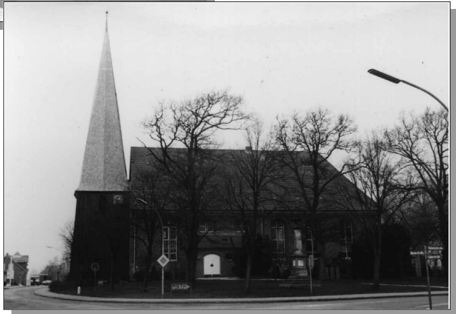
Kirche in Eddelak