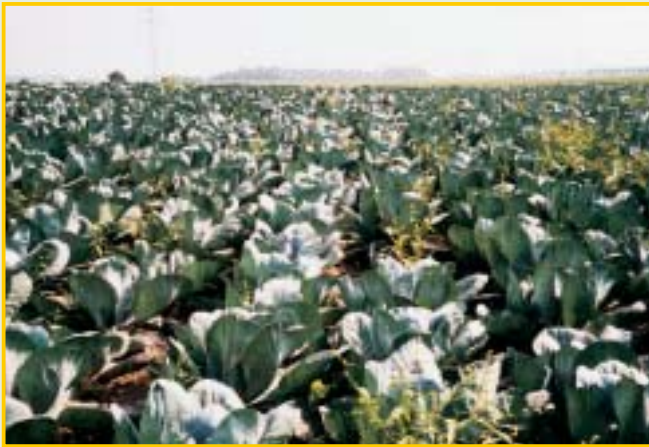
Kohlfeld in Karolinenkoog

Östlich dieser Nehrung bildete sich ein Haff, das verlandete. Heute ist daraus eine Moorniederung mit verlandenden Seen entstanden. Im Westen dagegen lagerten sich feine Sand- und Tonmassen ab, aus denen sich die Marsch bildete. Der Eiderstrom wurde von der Nehrung abgelenkt und floss nördlich um Lunden herum.