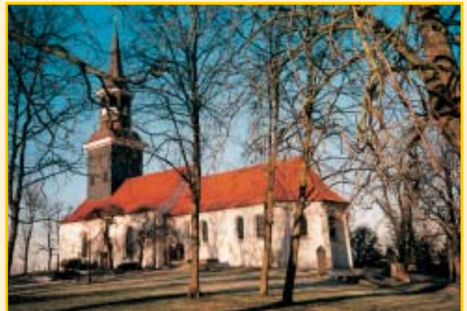
Kirche in Lunden mit Geschlechterfriedhof