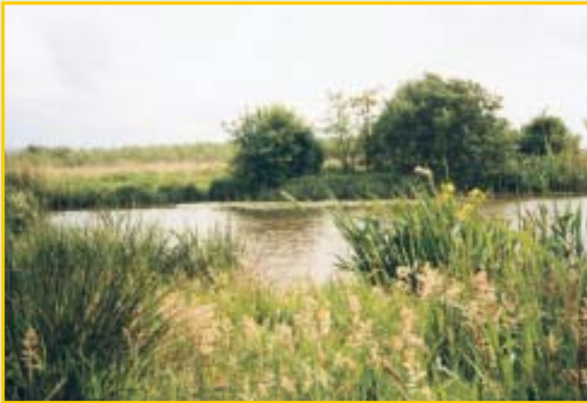
Biotop im Naturerlebnisraum

Mit dem Bau von Schutzhütten und Bänken, dem Aufstellen von Papierkörben und Hinweisschildern und dem Anbringen von Nistkästen wurde die Anlage vervollkommenet.