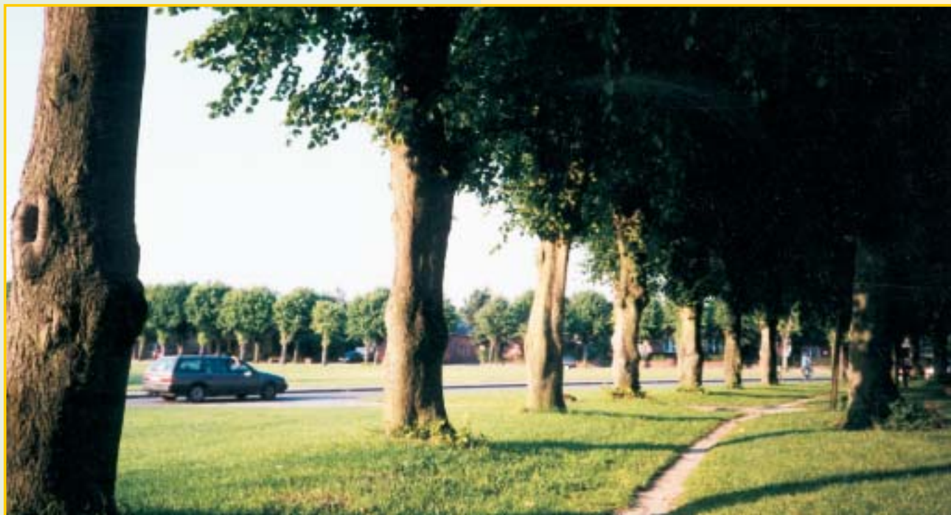
Blick auf den Gänsemarkt in Lunden

Die 1916 erbaute große Eisenbahnbrücke bildet die Verbindung zur Halbinsel Eiderstedt. Mit dem Auto ist das Holländerstädtchen Friedrichstadt über die Autobrücke in 5 Minuten zu erreichen.