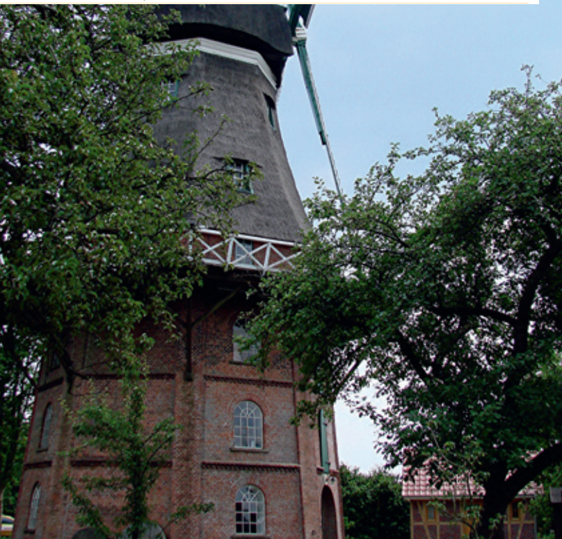
Galerie Holländermühle in Schiffdorf

Wir führen auch an jedem ersten Samstag im Monat in der Zeit von 10.00 bis 14.00 Uhr standesamtliche Trauungen durch.