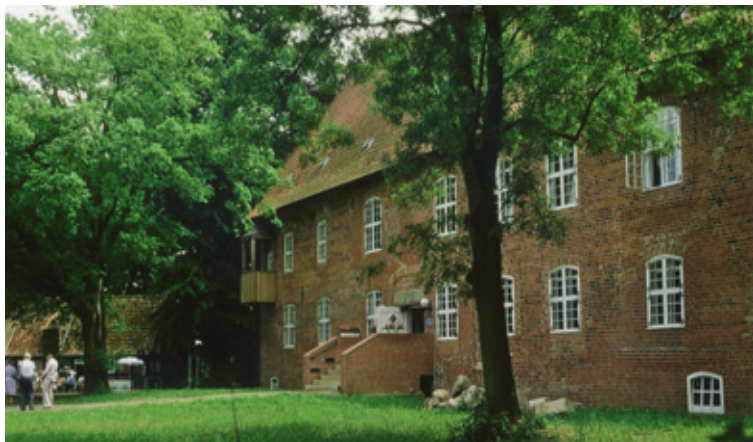
Burg zu Hagen