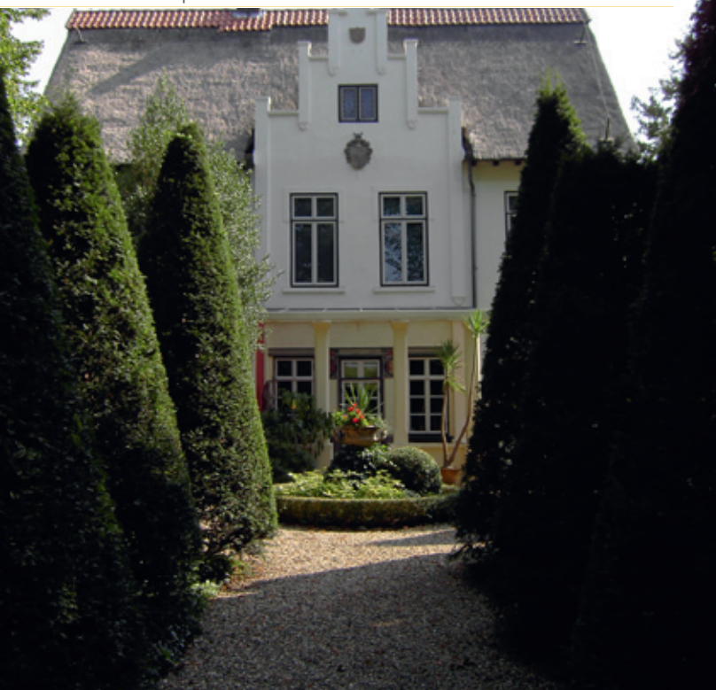
Hermann Allmers Haus – Antikensaal in Rechtenfleth