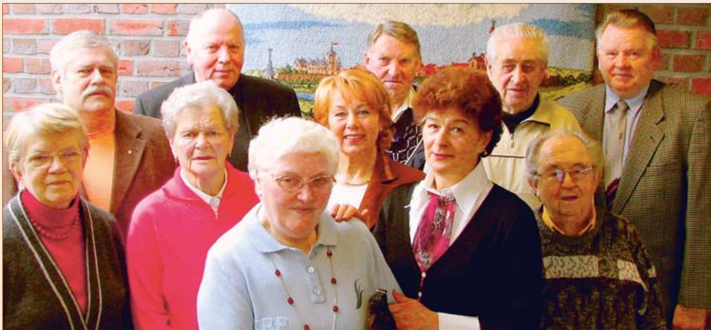
Mitglieder des Seniorenbeirates (Frühjahr 2007)

Der Seniorenbeirat gilt als die Interessenvertretung der älteren Mitbürgerinnen und Mitbürger und Ansprechpartner der Stadt Wildeshausen. Die Satzung des Seniorenbeirates regelt, dass die in der Stadt Wildeshausen in der Seniorenarbeit tätigen Organisationen Mitglied im Seniorenbeirat sein können.