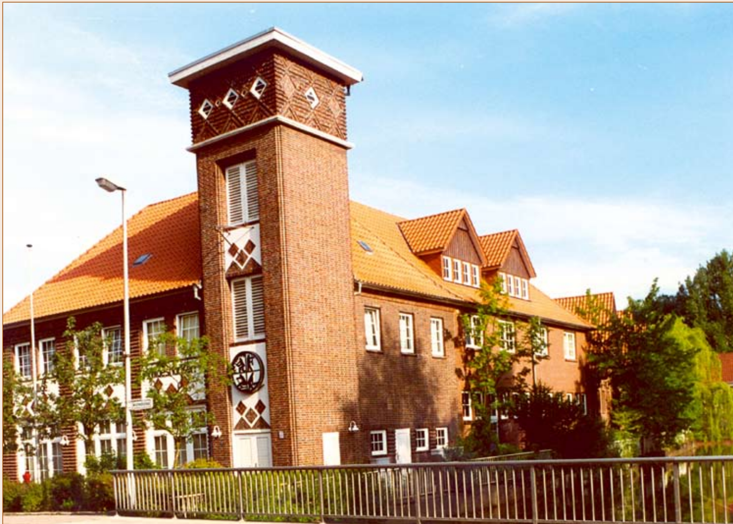
Feuerwehrhaus der Stadt Wildeshausen

wird der zuviel gezahlte Betrag erstattet. Den Antrag auf „Befreiung von Zuzahlungen“ erhalten Sie bei Ihrer Krankenkasse.