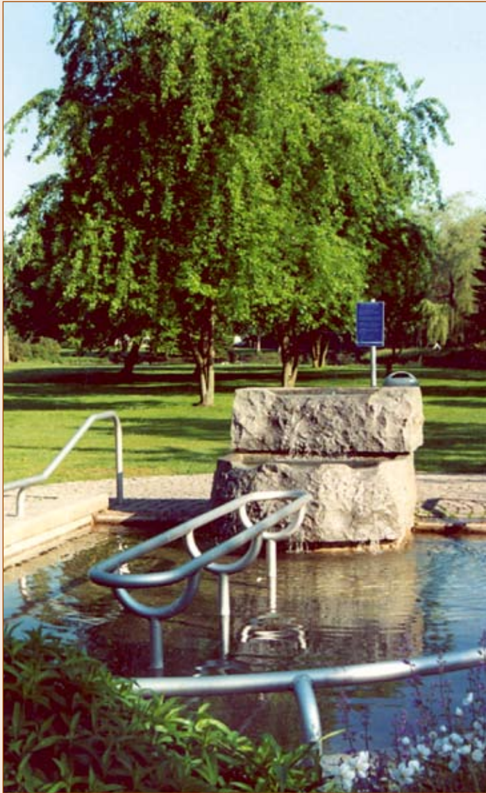
Kneippanlage in der Burgwiese