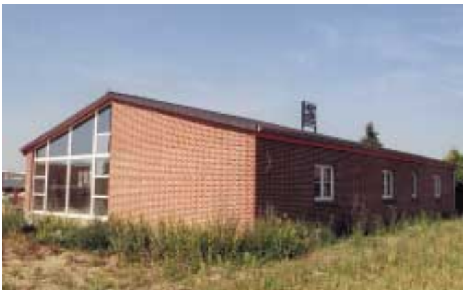
Neubau des Büro- und Verwaltungsgebäude

Erd B Tief B Kanal -A Rohrleitungs -A Straßen U Kultur U