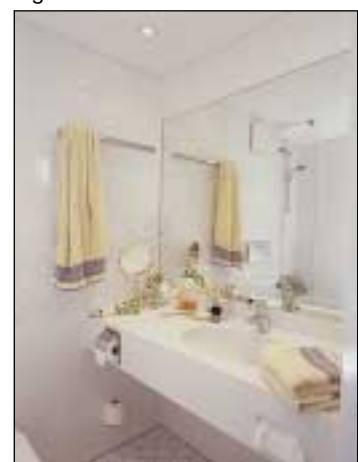
Modernes DEBA Hotelbad

Sanitärzellen sind sogar in bewohnten Objekten schnelle und „gäste- oder mieterfreundliche“ Renovierungen problemlos möglich.