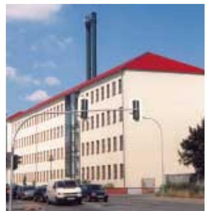
Verwaltungsgebäude der Stadtwerke

bedeutet die Versorgung einzelner Gebiete mit Gas oder Fernwärme durch die Stadtwerke.