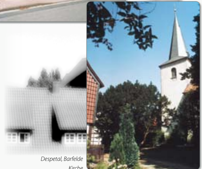
Despetal, Barfelde Kirche