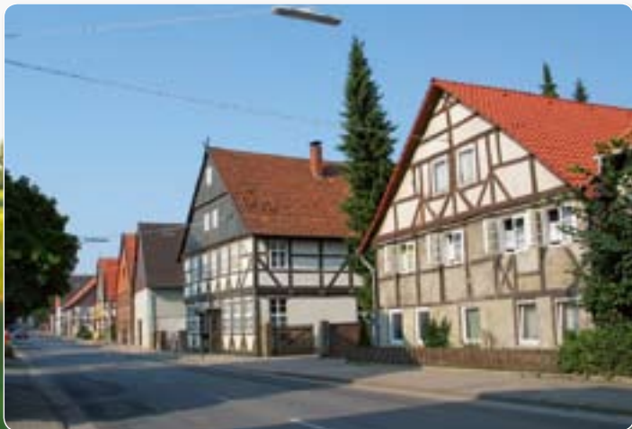
Eime – Hauptstraße

Die älteste bekannte Urkunde, in der Eime erstmals erwähnt wurde, ist datiert auf den 24. Juli 1209. Erst 1550 wurden dem ländlich strukturierten Eime die Fleckenrechte zuerkannt, woraufhin der Flecken Eime eine Bürgermeisterverfassung, die niedere Gerichtsbarkeit und das Recht zur Abhaltung eines Marktes erhielt. Die Gewinnung von Kalisalz wurde früh als Handelsquelle genutzt, bereits 1905 wurde mit dem Versand der Salzmineralmischung begonnen. Mit der Begrenzung der Kali-Förderung wurden diese Quelle und das Werk 1925 stillgelegt. Durch die hannoversche Ämterreform von 1852 kam Eime 1853 zum Amt Gronau und von 1885 bis 1932 zum Kreis Gronau. Durch die Gebiets- und Verwaltungsreform 1974 wurden die Orte Deinsen, Deilmissen und Dunsen dem Flecken Eime eingegliedert und dieser mit gleichzeitiger Auflösung der seit 1964/1968 bestehenden Samtgemeinde Eime der Samtgemeinde Gronau (Leine) angeschlossen.