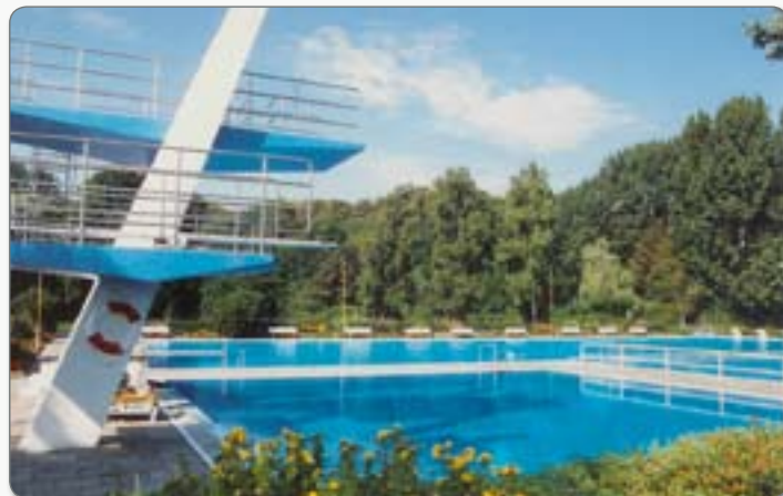
Beheiztes Freibad Gronau