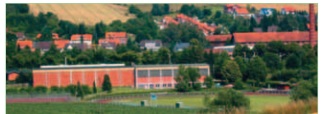
Sport- und Freizeitzentrum Freden (Leine)