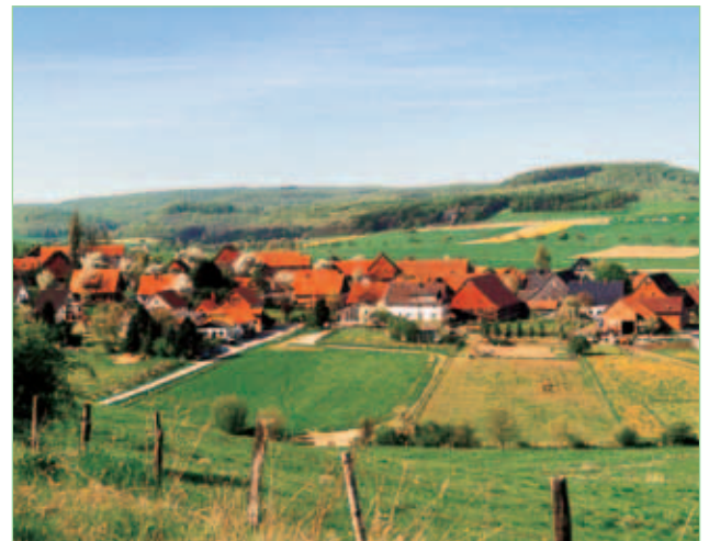
Blick auf Wetteborn