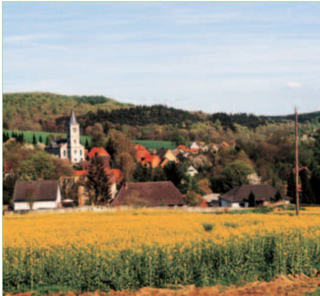
Katholische Kirche Winzenburg