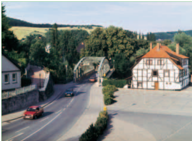
Leinebrücke und alte Ölmühle

Besonders hervorzuheben sei hierbei noch die sehr gute Gastronomie, die in allen Orten der Samtgemeinde vorhanden ist.