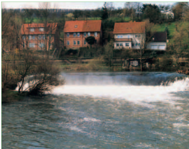
Leinewehr Greener Straße