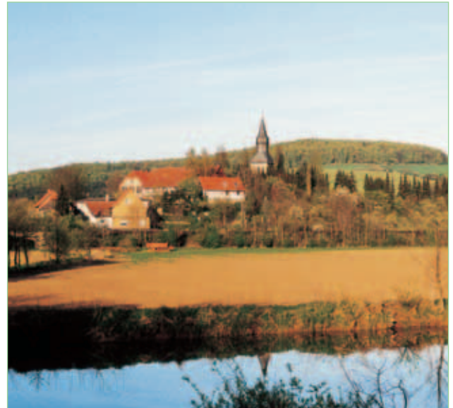
St. Laurentius Kirche