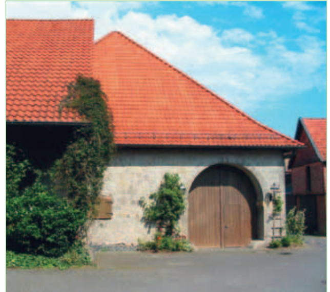
Zehntscheune in Freden