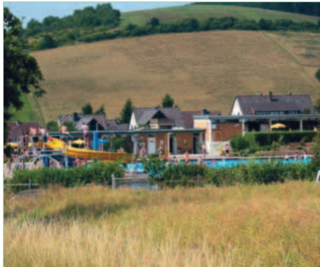
Freibad Freden (Leine)