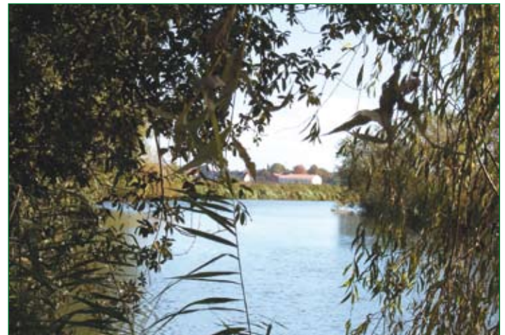
Blick auf Schule in Ahrbergen