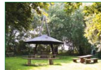
Grillplatz Schulwiese Hasede