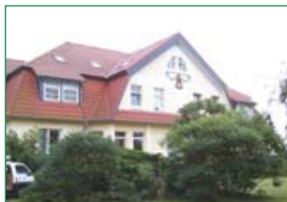
Therapiezentrum für autistische Kinder