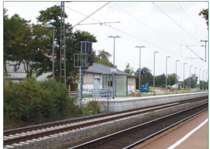
Bahnhof in Emmerke