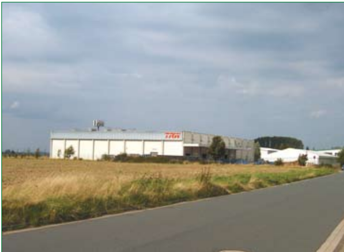
Gewerbegebiet in Emmerke