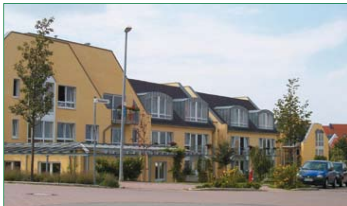
Seniorenwohnpark in Giesen