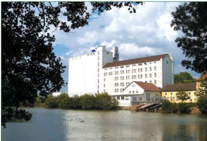
Große Mühle in Hasede