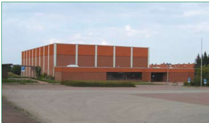
Sport- und Mehrzweckhalle in Giesen