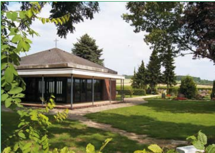
Friedhofskapelle in Emmerke

Das Landschaftsbild der zwischen dem Kippput und dem Giesener Wald gelegenen Orte wird sichtbar mitbestimmt von der Kalihalde des früheren Kaliwerks „Siegfried“, das seit Beginn