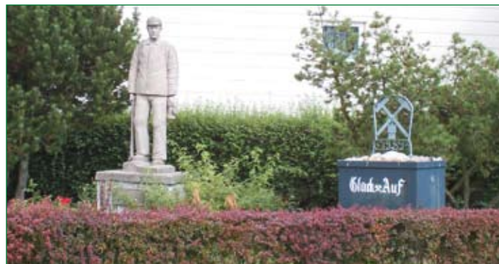
Bergmannsdenkmal in Giesen

Auch in Zukunft wird es Schwerpunkt der Arbeit der Gemeinde sein, dafür Sorge zu tragen, dass sich alle Bürger in ihrem Gemeindegebiet wohl fühlen werden.