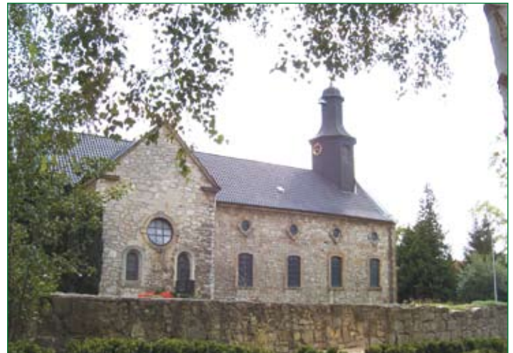
St.-Andreas-Kirche in Hasede