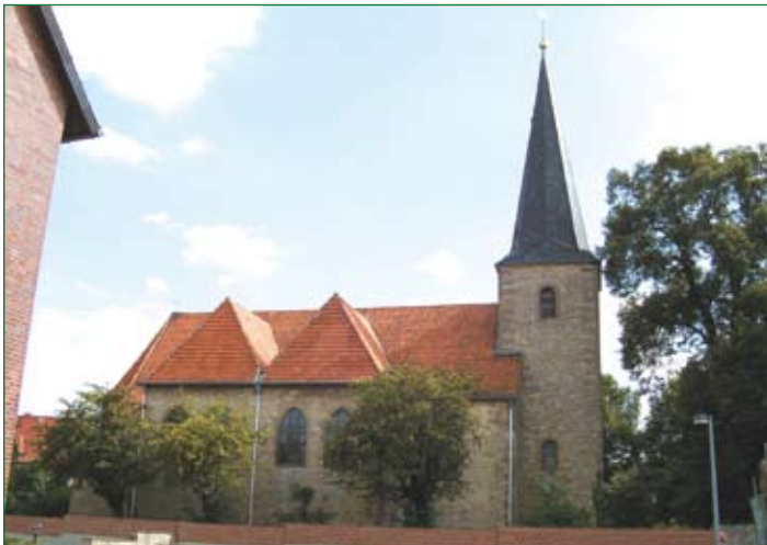
St. Vitus Kirche in Giesen

Der Inhalt besagt, dass die Äbtissin Alberat der Hildesheimer Kirche Erbgrundstücke in Lungerbache, Steinvörde und Wathlingen (Kreis Celle) übereignete, wogegen ihr vom Bischof Hezilo Nutznießungen von Gütern in „Arebergun“ zuerteilt wurden. Von dem Ortsgeschlecht ist 1147 bis 1190 ein Kono de Arebergun erwähnt, dieser erscheint in vier Urkunden unter Bischof Udo und Bischof Berthold als Zeuge. Mit dem hiesigen alten „Rittergut“ ist die Geschichte dieses Geschlechts, das dem sächsischen Uradel entstammte, eng verbunden.