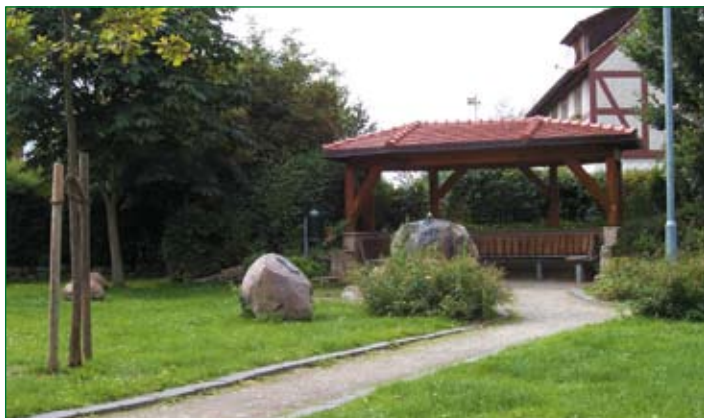
Chabanaisplatz in Emmerke