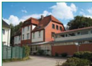
Grundschule in Hasede