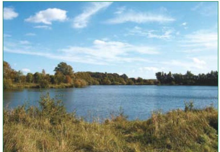
Kiesseen in Ahrbergen