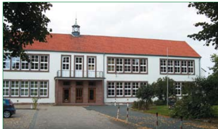
Grundschule in Giesen