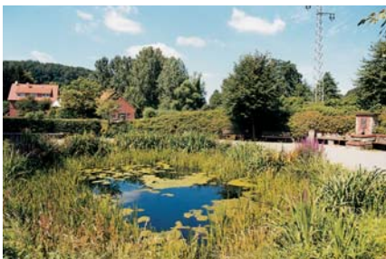
Ortsteil Nalhof, Zieglerplatz

Kommunale Selbstverwaltung besaß im Extertal ursprünglich nur der Flecken Bösingfeld. Seit seiner Gründung wurde er von Bürgermeister und Rat verwaltet. 1926/28 konnte ein repräsentatives neues Rathaus errichtet werden. Die übrigen Orte erhielten zwischen 1848 und 1919 allmählich die kommunalen Rechte. Erst 1937 wurden die Ortsvorsteher „Bürgermeister“. Eigene Verwaltungsgebäude gab es aber nicht.