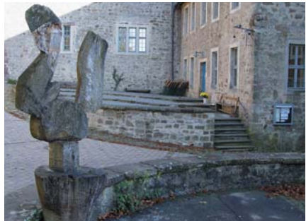
Innenhof Burg Sternberg

Die Entwicklung der modernen Technik führte um die Jahrhundertwende allgemein zu gesteigerten Bildungsanforderungen im Berufsleben. Deswegen wurden überall Realschulen errichtet. Nach einer langen Vorgeschichte (1901 - 1940) konnte 1952 ein Aufbauzug an der Volksschule Bösingfeld begründet werden, aus dem 1966 die Realschule hervorging (Gebäude 1967/70).