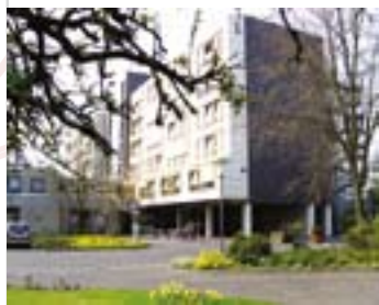
Seniorenzentrum St. Elisabeth

Seniorenzentrum St. Elisabeth Am Rondell 14 33378 Rheda -Wiedenbrück Telefon (05242) 416 100 elisabeth.rheda@vka-ev.de