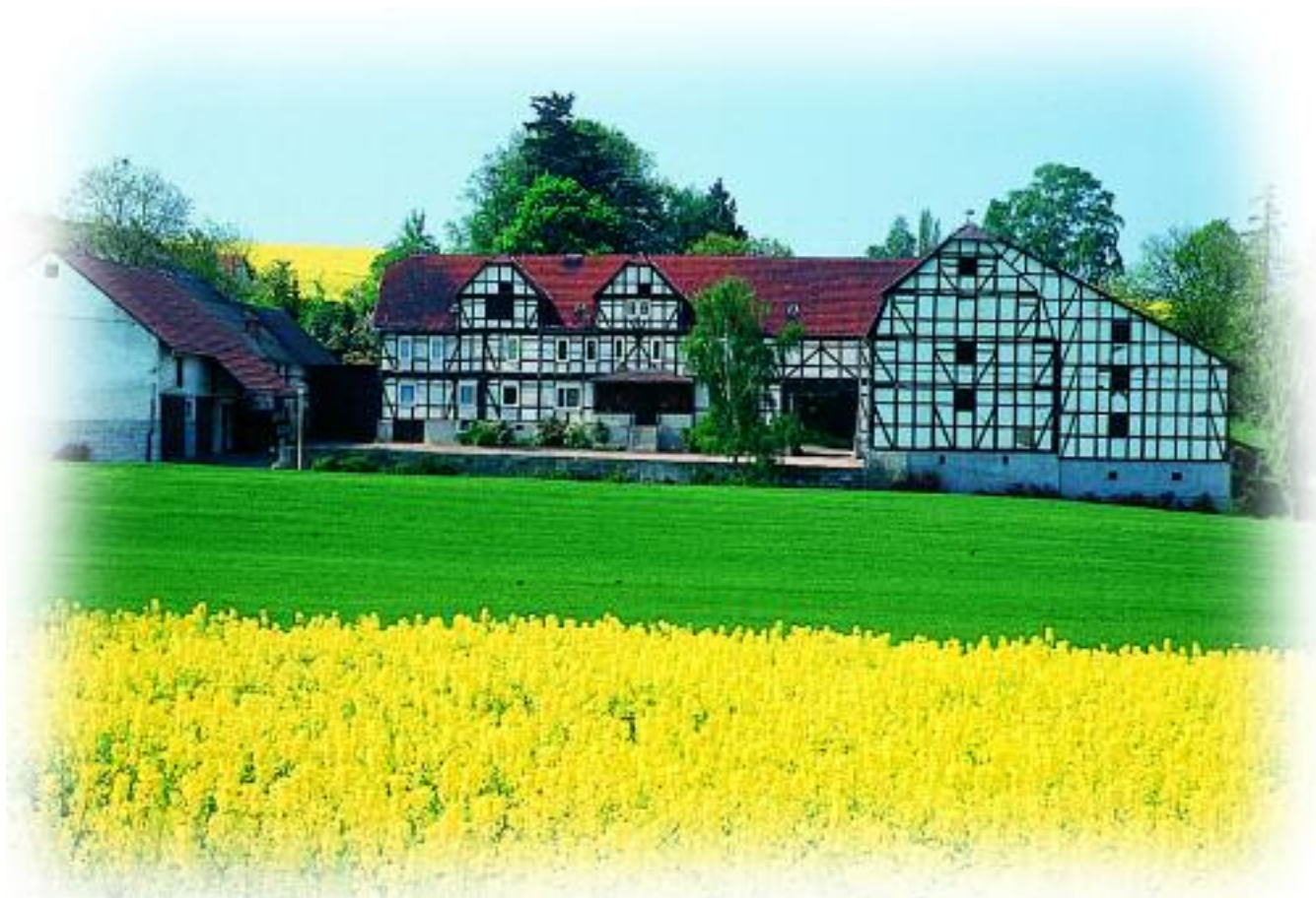
Imposante landwirtschaftliche Gebäude, Gut Wolfram in Unteralbshausen