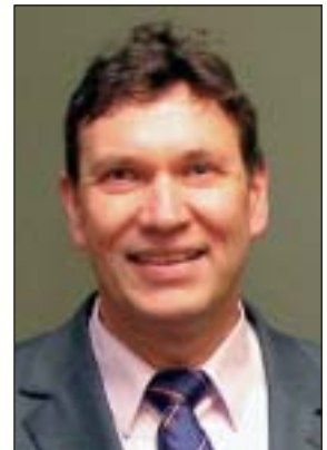
Edgar Slawik Bürgermeister