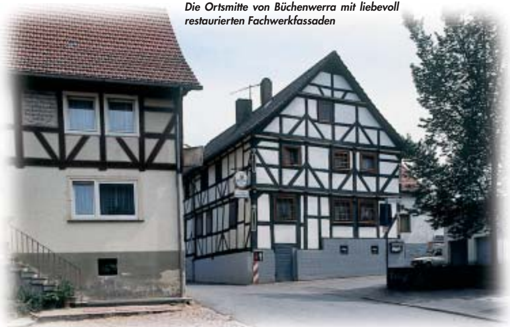
Die Ortsmitte von Büchenwerra mit liebevoll restaurierten Fachwerkfassaden

Büchenwerra ist von seiner Entstehung bis zum Ausgang des 12. Jahrhunderts ein kleiner beachteter Ort gewesen. 1256 erwirkt das Kloster größere Teile der Gemarkung und sorgt für den Aufbau des Dorfes. Es werden 1585