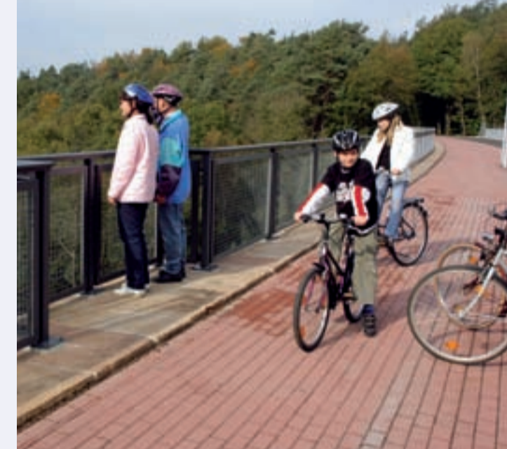
Tal überspannt. Diese Brücke wurde in den ersten Kriegsjahren verbreitert, um eine Zweigleisigkeit der Strecke zu ermöglichen. Von den Aussichtspunkten auf der Brücke bietet sich ein Blick bis zur Hochrhön und über das Haunetal.