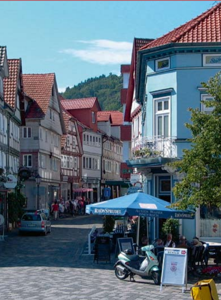
Gemütliche Gassen zum Bummeln und Verweilen

Noch heute besteht fast ganz Alt-Rotenburg aus Fachwerkbauten, die sich entlang der Gassen und Straßen aneinander reihen. Zusammen mit dem Rathaus, dem Schloss und den Kirchen bietet Rotenburg ein malerisches Stadtbild. Die meisten der Fachwerkbauten stammen aus dem 17. und 18. Jahrhundert, nur einige wenige Gebäude haben die großen Stadtbrände früherer Zeiten überstanden. Historische Prachtbauten, kleine bunte Fachwerkhäuser, Gässchen und Winkel, noch geschlossene historische Ensembles ergeben ein romantisches Stadtbild.