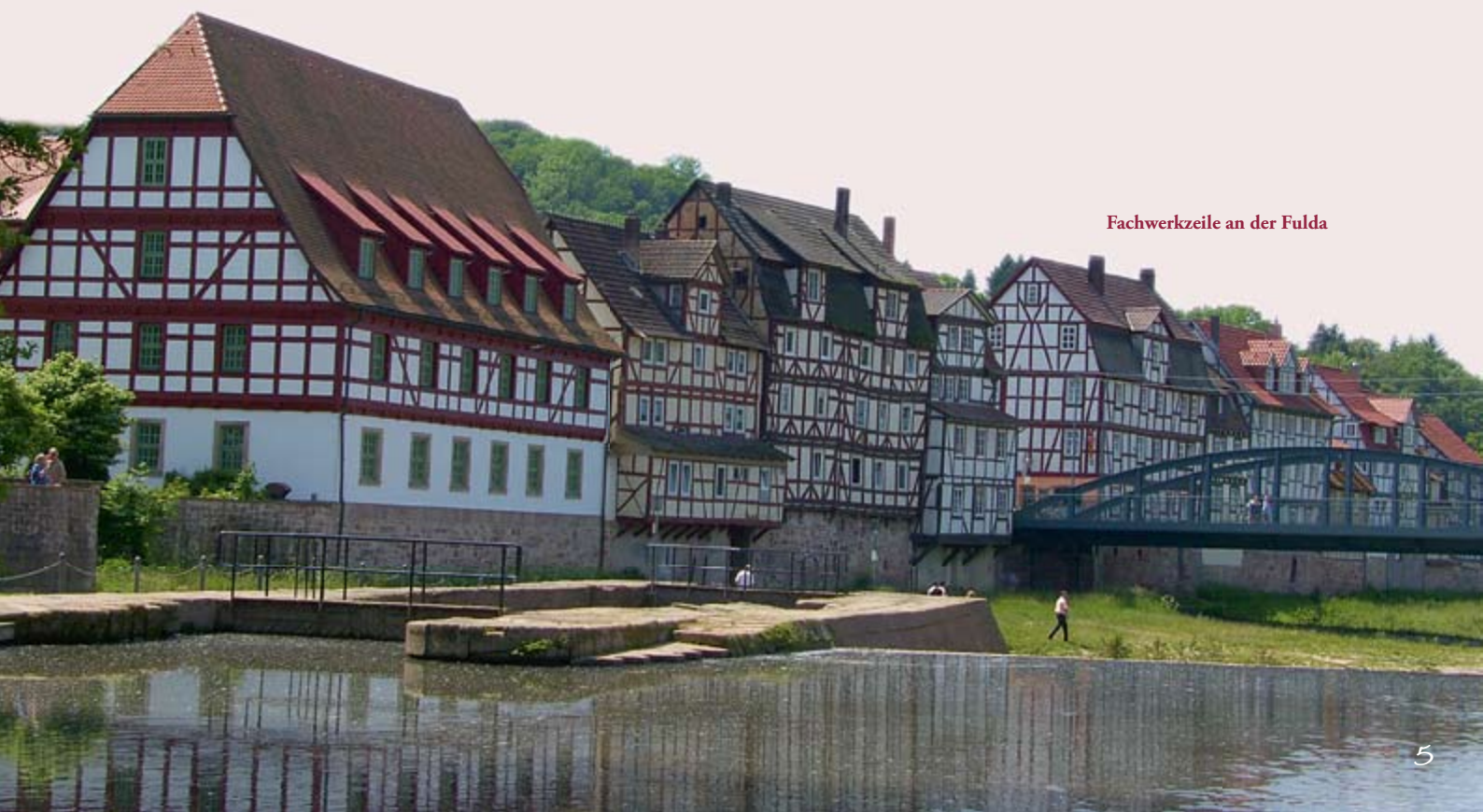
Fachwerkzeile an der Fulda