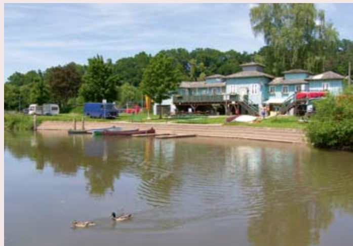
Campingplatz an der Fulda