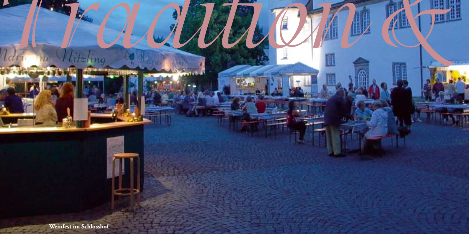
Weinfest im Schlosshof

Neben den vielen Veranstaltungsangeboten der örtlichen Hotellerie, Gastronomie und der Vereine gibt es regelmäßig größere Veranstaltungen, die über das Jahr verteilt sind. Während des Heimat- und Strandfestes geht Ihnen ein Licht auf. Immer Anfang Juli glänzt der Rotenburger Schlosspark unter den Sternen im Licht flackernder Kerzen und bunter Lampions. Livebands spielen open-air im Schlosspark. Ein Fest, das Sie mit Rotenburg verbindet.