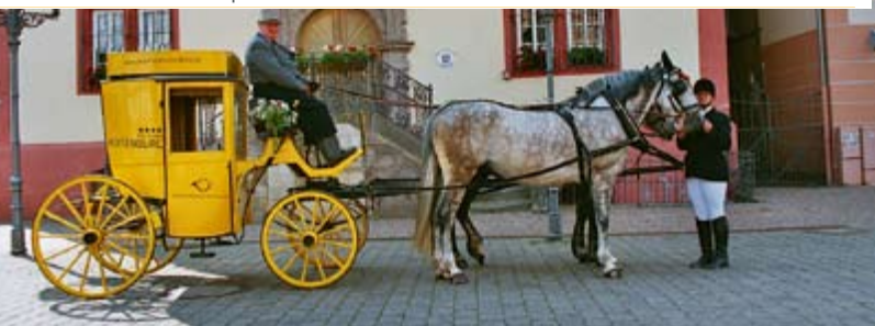
Kutsche vor dem Rathaus