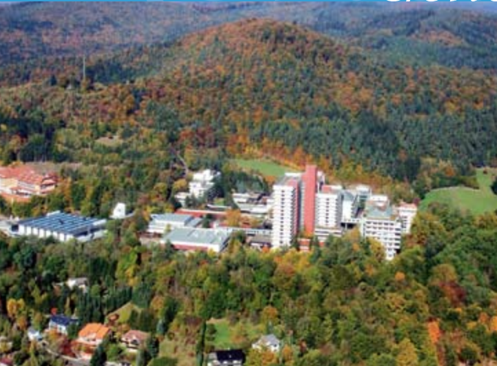
Herz- und Kreislaufzentrum Rotenburg an der Fulda