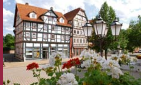
Bilder des Rotenburger Marktplatzes