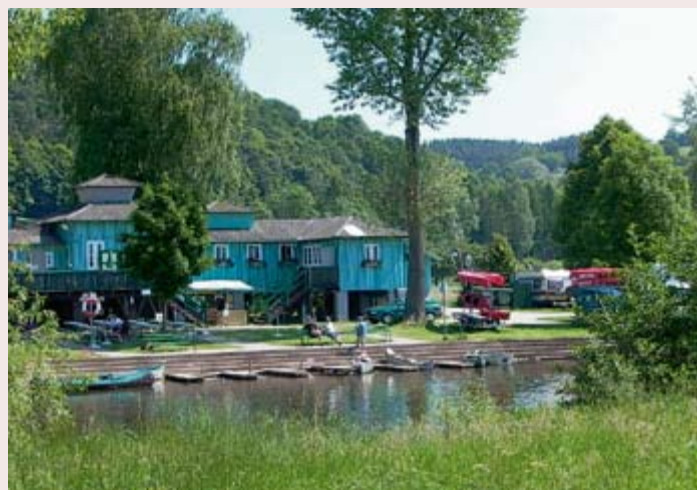
Campingplatz an der Fulda

Eis Cafe De Fanti Inh. Emanuele De Fanti