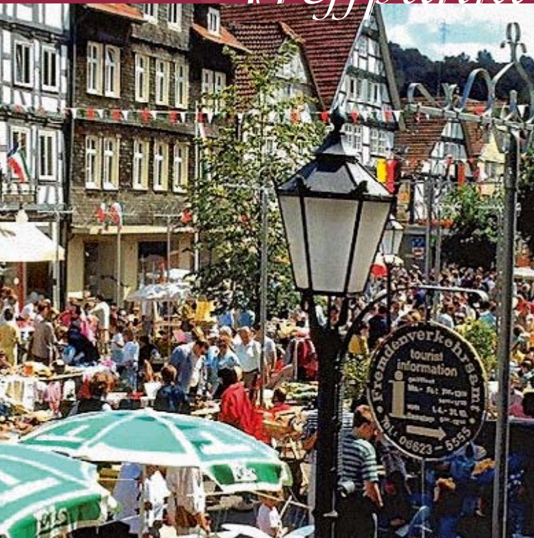
Marktplatz während des Heimat- und Strandfestes

Der in seiner Ursprungsform erhaltene Marktplatz in der Altstadt, umrahmt vom wuchtigen Rathaus mit schönem Renaissanceportal und von der Jakobi-Kirche mit der prächtigen Orgel aus dem 16. Jahrhundert sowie dem alten Stadtbrunnen (Kump), ist in seiner erhaltenen Geschlossenheit ein echtes Zentrum und Treffpunkt.