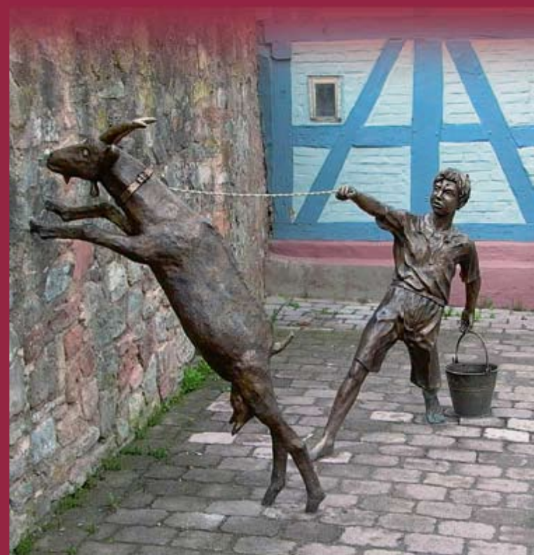
„Hütejunge mit Ziege“ – Bronzeskulptur in der Querweingasse

Der öffentliche Raum als Ort sensibler Kunst. Bronzefiguren in der Kernstadt befinden sich an historischen Stellen und sind lebensgroße und lebendige Darstellungen aus dem bürgerlichen Leben verschiedener Epochen in Rotenburg. Ein weit über die Grenzen der Region hinaus bekannter regionaler Künstler hat sie geschaffen.