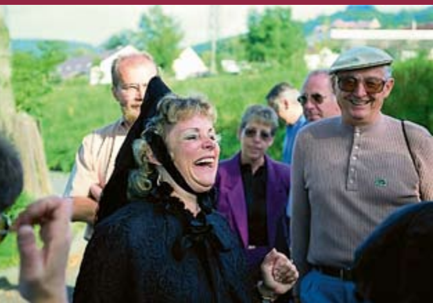
Stadtführerin in Tracht

Unsere kleine malerische Fachwerkstadt mit ihrer 750-jährigen lebhaften Geschichte hat es dank ihres romantischen Flairs über all die Jahrhunderte hinweg stets verstanden, Bewunderer unter ihren Gästen zu gewinnen. Sicherlich hat nicht zuletzt das Zusammenspiel von buntem Fachwerk, erhabenen historischen Bauten, grünen Berghängen und dunklem Flusslauf den Reiz auf den Betrachter ausgemacht.