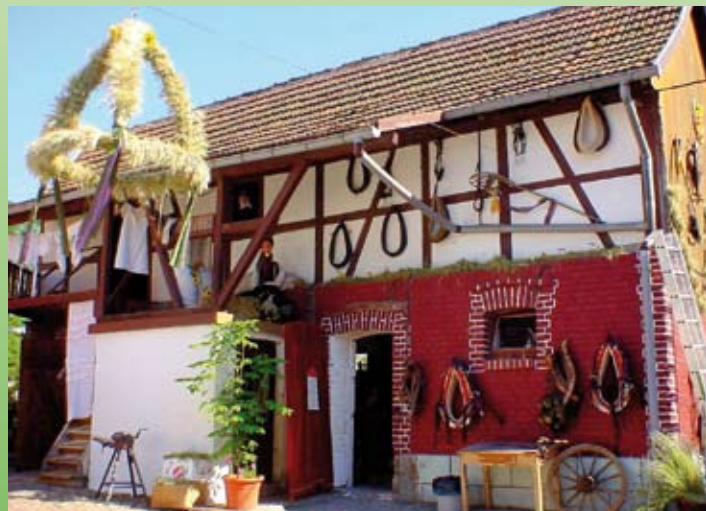
Geschmückter Bauernhof in Kieselbach

Friedhofsverwaltung/Bestattungswesen/Archiv ..... Erika Gutsch Tel.: ..... 036969 / 537-16 eMail: ..... r.gutsch@gemeinde-merkers-kieselbach.de Ansprechpartner für: Archiv, Bestattungswesen, Friedhofswesen, Grabräumung, Sterbefallanzeige, Straßenbeleuchtung