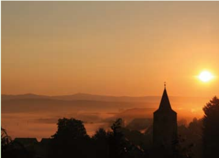
Nebel über Merkers mit Blick zum Inselberg

Kieselbach, der nördliche Ortsteil der Einheitsgemeinde Merkers-Kieselbach, mit seinen etwa 1.710 Einwohnern liegt im grünen Herzen Deutschlands zwischen dem Thüringer Wald und der Rhön, eingebettet in eine landschaftlich äußerst reizvolle Gegend, ca. einen Kilometer rechts der Werra am Nordwesthang des Krayenberges mit seiner historischen Burg.