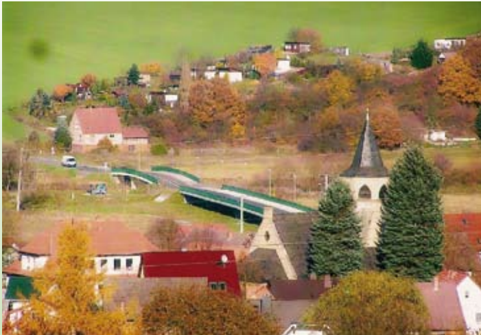
Werrabrücke zwischen Merkers und Kieselbach