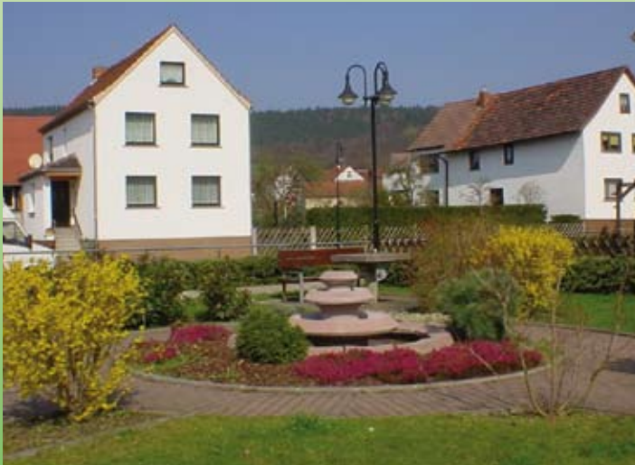
Park und Brunnen am Brauhaus in Kieselbach

Auskünfte: Gemeindeverwaltung Merkers-Kieselbach Salzunger Straße 59, 36460 Merkers, Tel.: 036969 / 537-0 Ortsteil-Verwaltung Kieselbach Fuchsgasse 5, 36460 Kieselbach Tel.: 036963 / 60 60 3 (DO 12.00 – 16.00 Uhr)