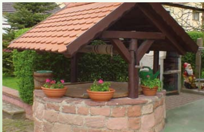
Liebevoll restaurierter Brunnen in Kieselbach

Der „Eisenacher-Haus-Weg“, der „Werratalradweg“ und der „Rhönradweg“ führen Urlauber und Naturbegeisterte aus Nah und Fern durch die grüne Idylle des Werratal und verbinden unsere Einheitsgemeinde im Süden und Westen mit den grünen Hügeln der Rhön und im Norden und Osten mit den erhabenen Höhen des Thüringer Waldes.