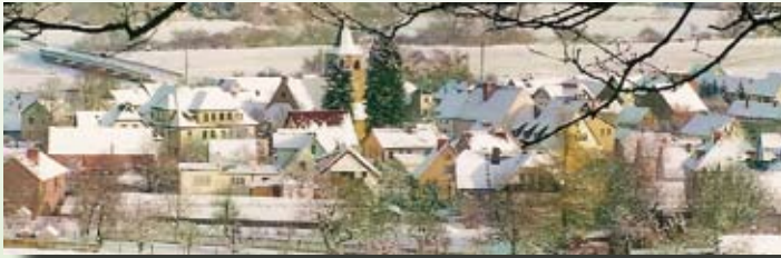
Blick zum Krayenberg im Winter