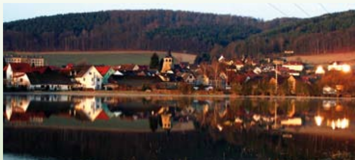
Werrahochwasser bei Merkers

Februar ..... - Karneval Mai ..... - Floriansfeuer Juni ..... - Handball- und Sportfest Oktober ..... - Kirmes