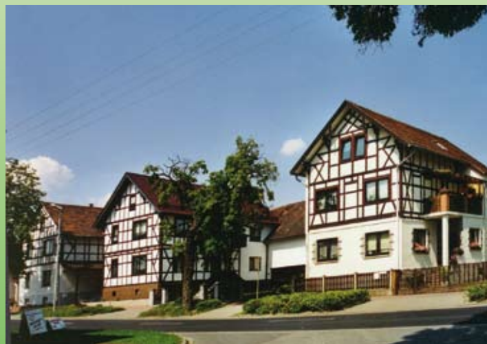
Alte Kieselbacher Fachwerkhäuser

Salzunger Straße 38, 36460 Merkers, Tel.: 036963 / 5 01 14