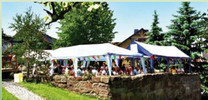
Dorffest auf dem Lindenplatz in Kieselbach