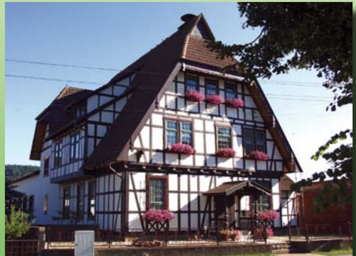
Abt-Geschenke-Haus in Kieselbach

Ein beliebtes Ausflugsziel nicht nur zu Himmelfahrt ist der „Country-Canyon“ - der ehemalige alte Sandsteinbruch wurde vom Country Club Kieselbach liebevoll und detailgetreu zum Westerndorf ausge-