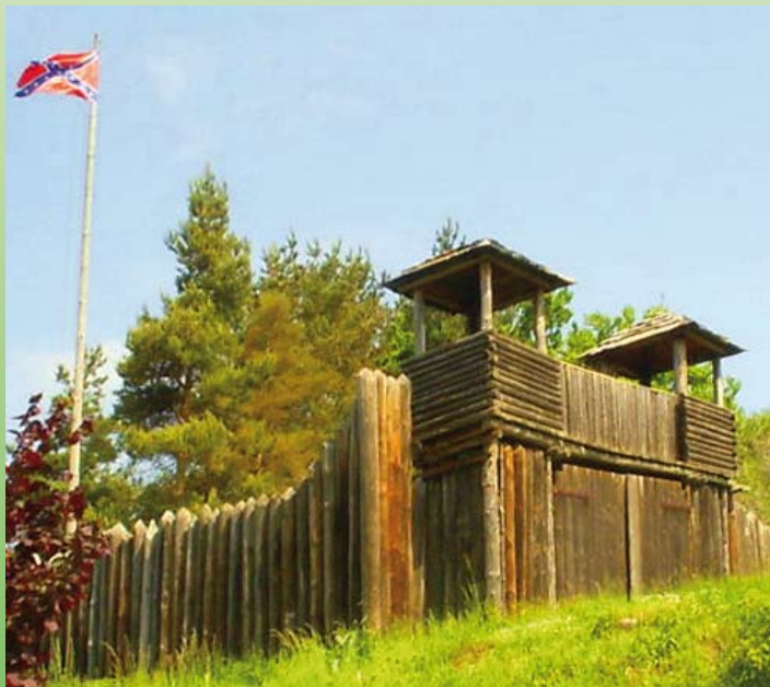
Country Canyon in Kieselbach