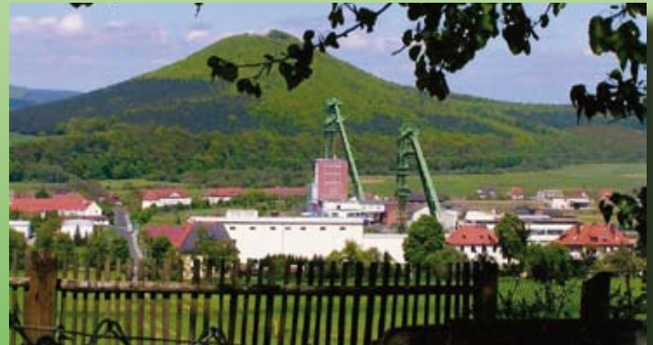
Krayenberg mit Kali

Montag: ..... 08.00 Uhr bis 12.00 Uhr Dienstag: ..... 08.00 Uhr bis 12.00 Uhr und 13.00 Uhr bis 18.00 Uhr Donnerstag: .. 08.00 Uhr bis 12.00 Uhr und 13.00 Uhr bis 15.30 Uhr