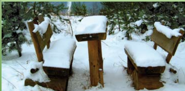
Ruheband am Arnsberg in Merkers