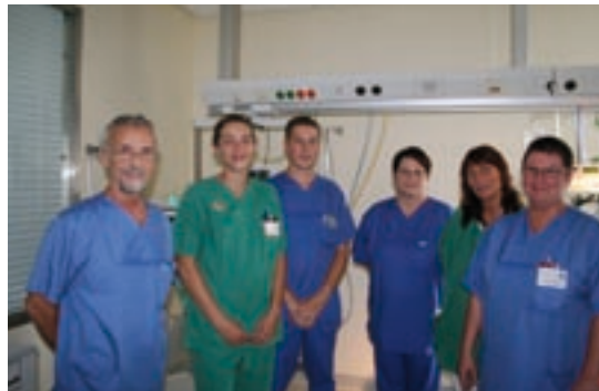
Team der Anästhesie

Hierfür stehen erfahrenes, qualifiziertes und engagiertes Fachpersonal und moderne Geräte zur Überwachung, Beatmung und Kreislauftherapie einschließlich maschineller Autotransfusion und Hämofiltration zur Verfügung.