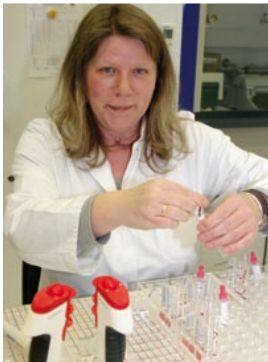
Klinische Chemie bietet umfassende Sicherheit

Am Krankenhaus können alle Arten von Verletzungen behandelt werden. Dazu steht neben einem modern ausgestatteten Schockraum, eine 24-Stunden geöffnete Notaufnahme mit enger räumlicher Anbindung an eine Röntgeneinrichtung und CT zur Verfügung. Das Gleiche gilt für Erkrankungen der inneren Organe. Die 24 Stunden geöffnete internistische Notaufnahme bietet mit Röntgen und Laborbereitschaft, Spiral-CT, Schockraum und Intensivstation eine umfassende Notfallversorgung (u. a. moderne Beatmungstechniken und kooperierendes Herzkatheterlabor im 24-Stunden-Dienst).