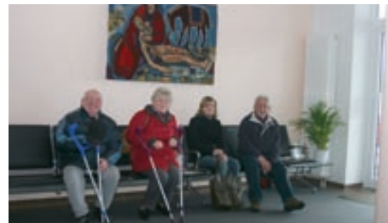
Wartezone im Eingangsbereich der Klinik

Der Gesetzgeber verpflichtet alle Versicherten der gesetzlichen Krankenkassen, für Krankenhausaufenthalte eine Zuzahlung zu leisten. Diese ist durch das behandelnde Krankenhaus zu erheben und an die jeweilige gesetzliche Krankenkasse weiterzuleiten. Den Patienten wird die Rechnung/Überweisung nach Hause geschickt.