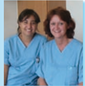
Geriatrisches Fachpflegepersonal auf Station

„Dem Leben Jahre und den Jahren Leben geben“