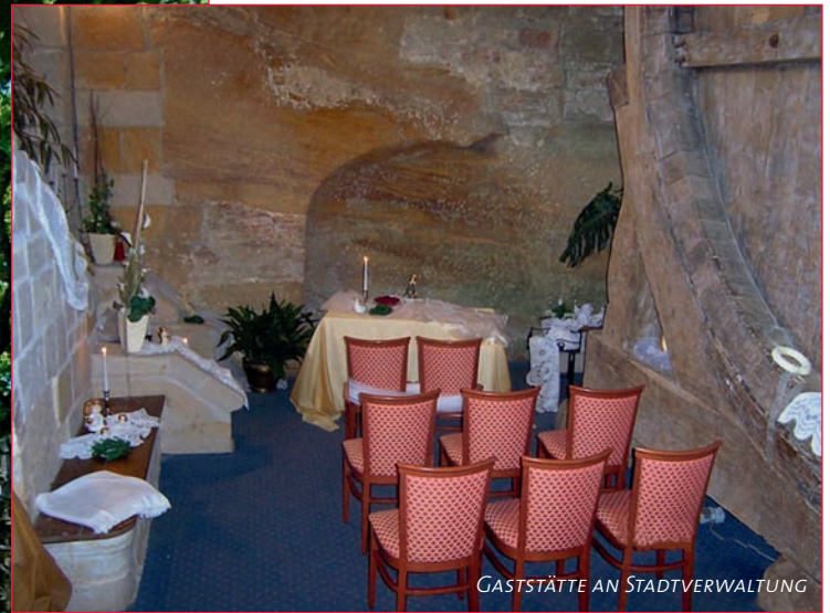
GASTSTÄTTE AN STADTVERWALTUNG