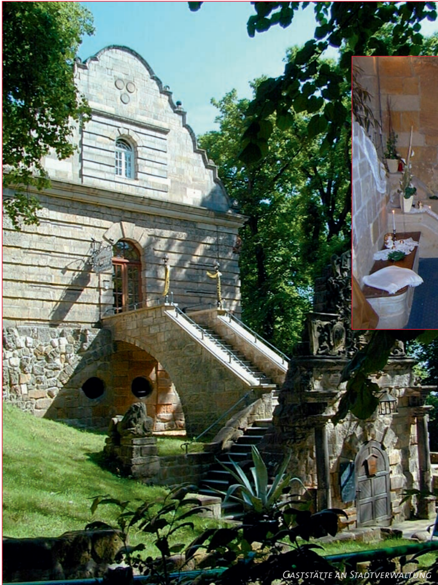
GASTSTÄTTE AN STADTVERWALTUNG