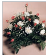
Autogesteck (auf Magnetplatte) aus Rosen, Nelken und Grün