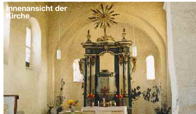
Innenansicht der Kirche

Die Dorfkirche von Meseberg steht auf einem Hügel. Ende des 12. Jh. wurde sie in Form eines dreiteiligen Backsteinbaus errichtet. Veränderungen am Ursprungsbau wurden vor allem im 18. Jh. vorgenommen. Der aufgesetzte Fachwerkturm mit barocker Haube und Laterne stammt von 1748. Eine Feuersbrunst im Jahre 1743 vernichtete das halbe Dorf, die Kirche, das Pfarrhaus und das Schulgebäude. Bei der Wiederherstellung wurden Chor und Apsis verändert. Sie wurde 1995 renoviert. Die Feldmark von Meseberg ist zum Teil Wischeland, zum Teil Geest und wird von der „Cossitte“ durchflossen. Die reizvolle Umgebung bietet ideale Bedingungen für Wanderer, Radler und Reiter. Neben vorhandener Gaststätte befindet sich ein Reitstützpunkt im Aufbau. Damit wird die Anmietung von Gastpferdeboxen möglich.