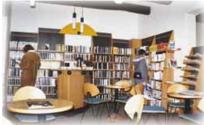
Stadt- und Kreisbibliothek

pandieren. In erster Linie geht es dabei um den Erhalt vorhandener und die Schaffung neuer Arbeitsplätze. Seit 1992 ist Osterburg im Städtebauförderungsprogramm des Landes Sachsen-Anhalt. Hiermit wurde es möglich, den Innenstadtbereich mit seiner denkmalpflegerisch wertvollen Bausubstanz zu erhalten. Standortpolitik und Gewerbeflächenpolitik der Stadt Osterburg sind durchdacht. Die Gewerbeflächenpolitik steht der Revitalisierung der Innenstadt nicht entgegen. Dem aufmerksamen Besucher werden die gut sanierten Gebäude auffallen (Ratskeller, Bibliothek, Museum).