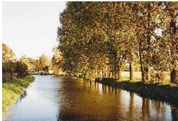
An der Biese

Neben der bekannten „Straße der Romanik“, welche in dieser Region nennenswerte Abstecher ermöglicht, sind drei der vom Fremdenverkehrsverband Altmark entwickelten Geschichtsrouten empfehlenswert, die „Fontane-, die Bismarck- und die Reformationsroute“. Die Mitarbeiter der Stadtinformation stehen hierbei gern beratend zur Verfügung.