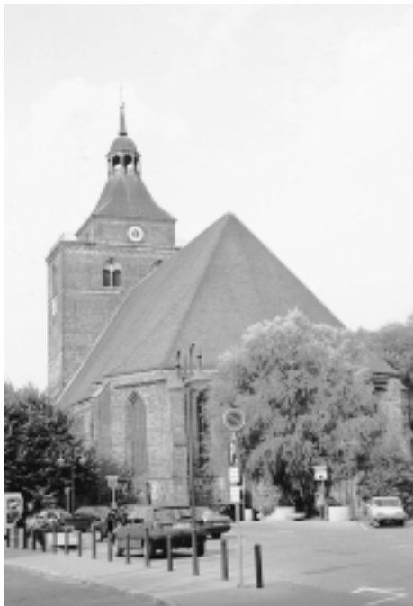
Kirche St. Nikolai Osterburg