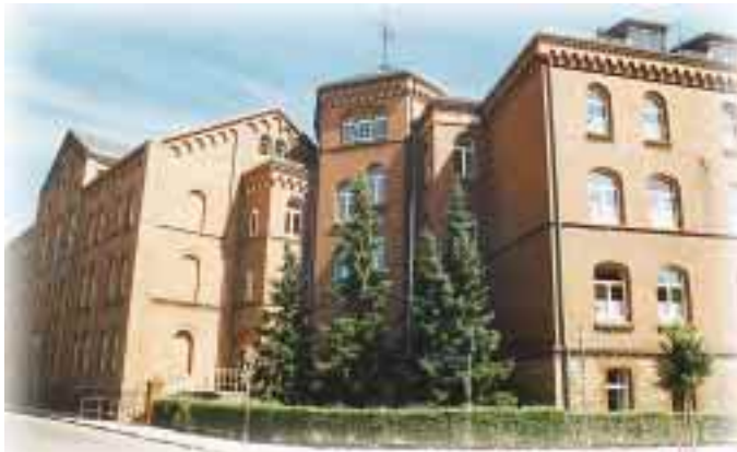
Gymnasium in Osterburg

Somit war es möglich, 12 Betriebe aus dem Innenstadtbereich in die Gewerbegebiete umzusiedeln sowie 5 neue Betriebe anzusiedeln. Diese Betriebe bekamen so die Chance, neue Produktionsstätten zu errichten und zu ex-