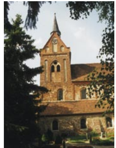
Stiftskirche St. Nikolaus

die Ländereien der benachbarten Orte Einwinkel und Kossebau grenzt, soll einst eine bedeutende heidnische Opferstätte gewesen sein. Die ersten Bewohner von Boock waren Slawen, ihnen folgten die Wenden und ab dem 12. Jahrhundert kamen die deutschen Kolonisten und Siedler in den Ort. Urkundlich erwähnt wurde der Ort erstmalig am 13.07.1315, unter dem Namen Buk. Zur Gemeinde Boock gehört der Ort Einwinkel. In der ersten urkundlichen Erwähnung 1238 heißt der Ort Niewinkel. Nachweislich gab es hier ein Rittergut, welches im Laufe der Geschichte mehrmals die Besitzer wechselte. Das Wappen der Ritter