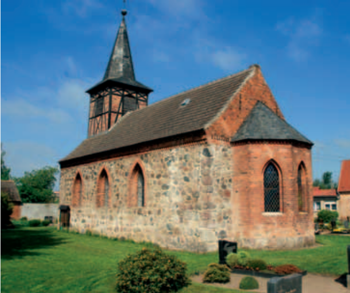
Kirche in Badel