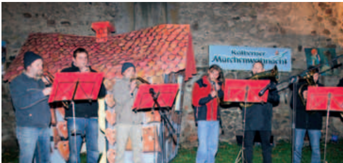
Burgweihnacht Kalbe (Milde)