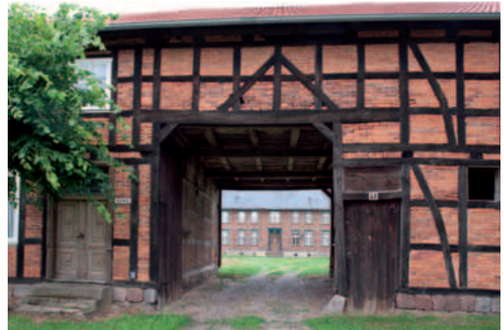
Fachwerkhaus in Mösenthin