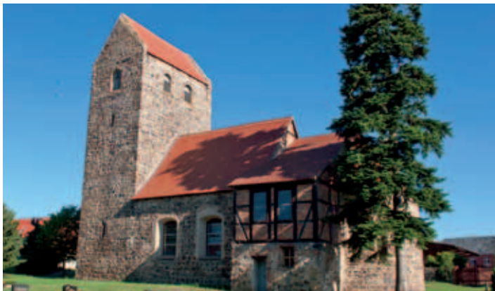
Kirche Engersen an der Straße der Romanik

WL Rainer Kepplinger, Tel.: über Stadt Kalbe (Milde) 039080 97120