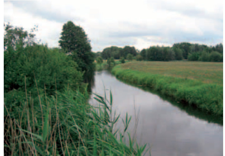
Fluß Biese bei Beese