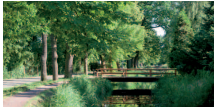
Kalbe (Milde) - Stadt der 100 Brücken

WL Jörg Kämpfer, Tel.: über Stadt Kalbe (Milde) 039080 97120