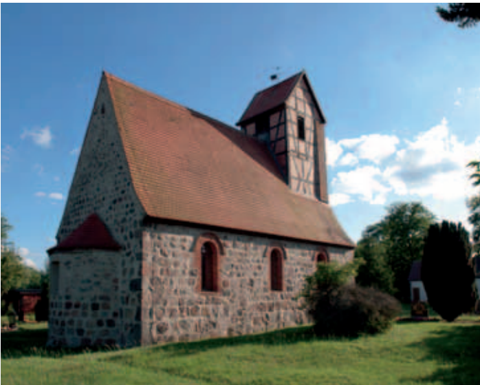
Kirche in Beese