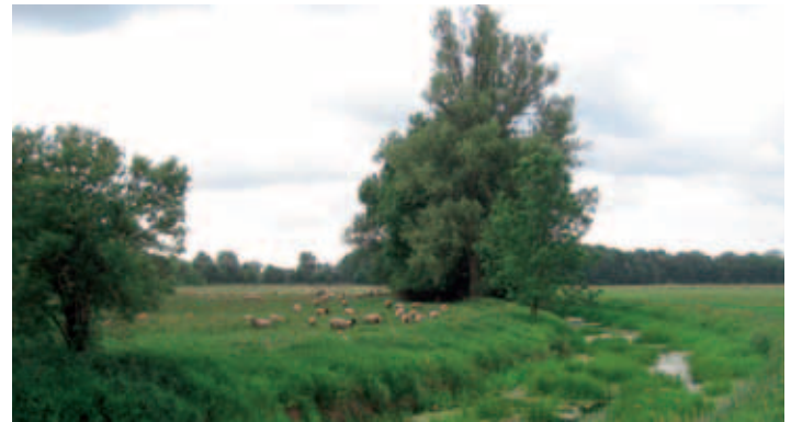
Milde bei Butterhorst