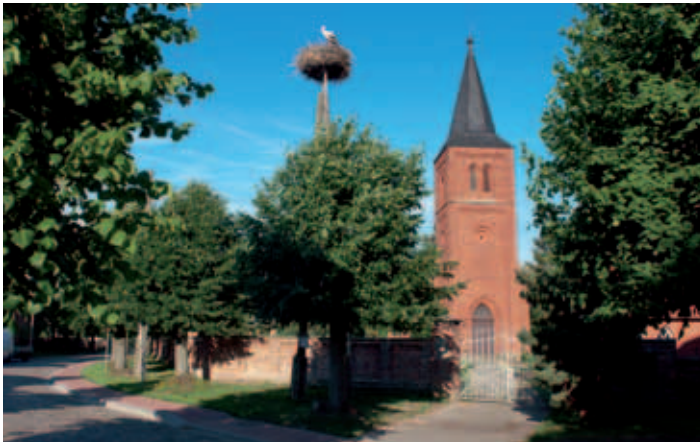
Storch in Hagenau