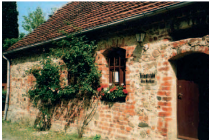
Altes Wachhaus an der Burgruine

Die Langobardenwerkstatt Zethlingen existiert seit 1991 und befindet sich in der Trägerschaft des Altmarkkreises Salzwedel. Am Rande von Zethlingen, auf dem Mühlenberg, befindet sich das museumspädagogische Zentrum des Danneil-Museums. Die vor ca. 2000 Jahren siedelnden Germanen legten an diesem Ort ein Bandgräberfeld mit Urnenbestattungen an. Die Besucher können hier den Alltag der Langobarden nacherleben und praktisch daran teilnehmen.