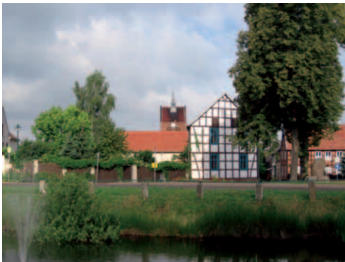
Karritz Blick zur Kirche

Karritz ist ein Ortsteil der Ortschaft Neuendorf am Damm und ein sogenanntes Rundlingsdorf. Zwischen dem Nachbarort Neuendorf am Damm und Karritz liegt der 50 Meter hohe Nelkenberg. Etwa 800 Meter von der Ortsmitte entfernt fließt der Secants- oder Königsgraben, weitere 500 Meter weiter fließt die Milde. In Karritz gibt es drei stehende Gewässer: den Dorfteich, den Rohrpfuhl und die Kieskuhle. Die Feldflur war schon in der mittleren Stein- und Bronzezeit besiedelt. Im Stendaler Museum befindet sich eine in Karritz gefundene Feuerstein-Lanzenspitze. Neben einer Bronzeschwertspitze fand man im Moor ein bronzenes Hängebecken. Das Dorf soll von Slawen nach dem Jahr 800 gegründet worden sein. Die Bezeichnung Karritz (karicz) bedeutet „Kuhdorf“ oder „Rödung“, ein Hinweis auf ausgedehnte Viehzucht.