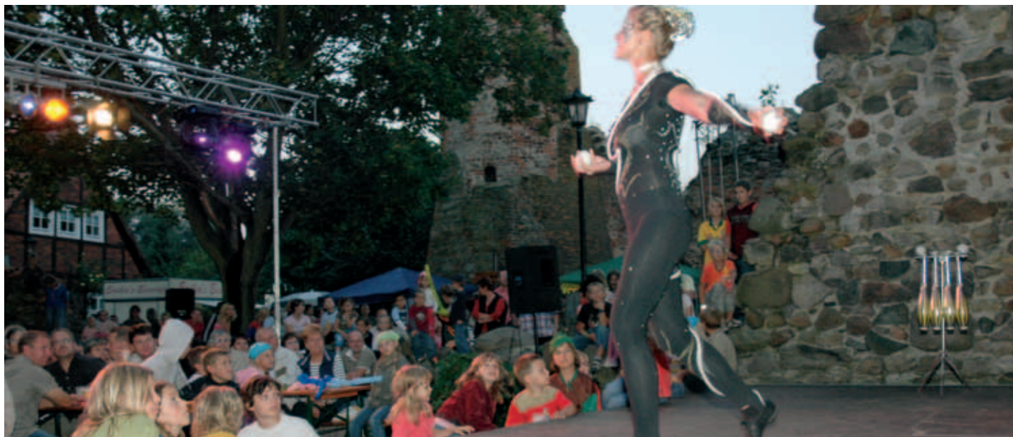
Burgfest 2010 Kalbe (Milde)

Außerdem fand die zweite Kalbenser Burgmesse der Gewerbetreibenden der Region um Kalbe statt. Am Abend sorgte die Liveband Pop Fit aus Salzwedel bei Jung und Alt für Unterhaltung. Den Abschluss bildete am Sonntag schließlich das Ritterfrühstück beim Kalbenser Angelsportverein „Mildeufer 1935“ e.V. und das erste Kalbenser Entenrennen.