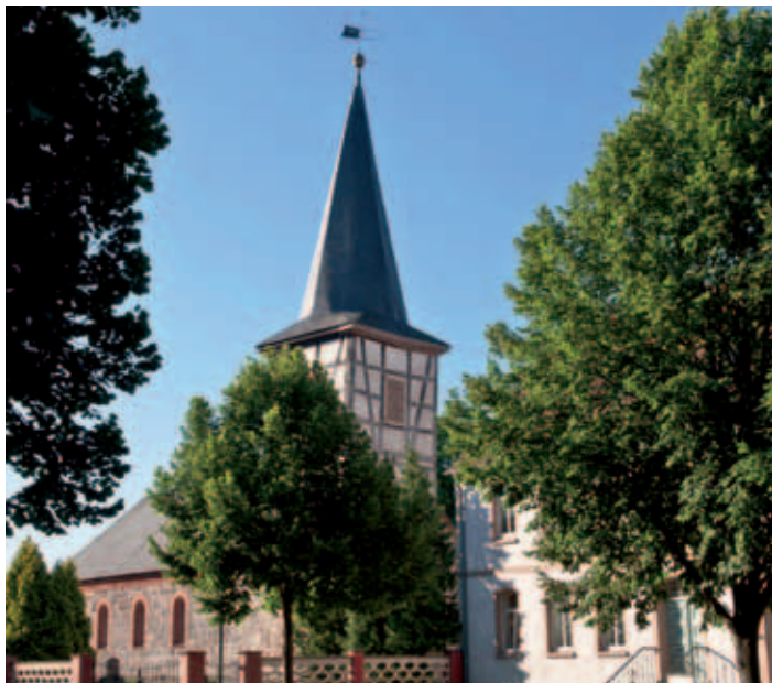
Kirche Neuendorf am Damm