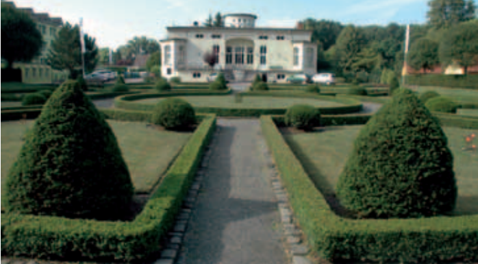
Buchsbaumgarten Kalbe (Milde)