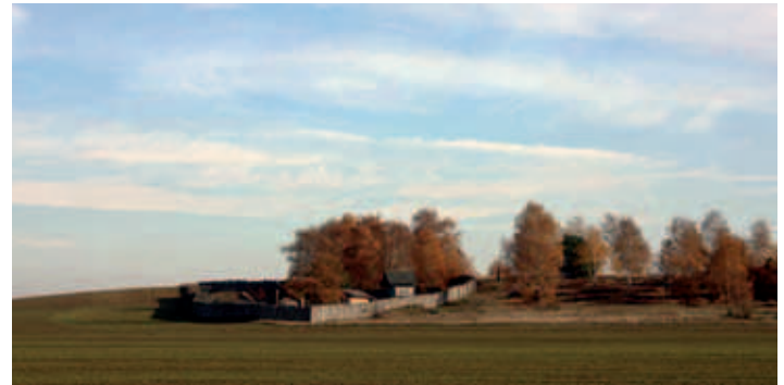
Langobardenwerkstatt am Mühlenberg Zethlingen