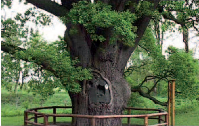
Historische Eiche ind Jemmeritz

Die Landschaft um Kalbe (Milde) ist eiszeitlich geprägt. Grund- und Endmoränen des Kalbeschen Werders, der Hellberge und der Bismarker Hochfläche umschließen die Niederungen des Mildetals.