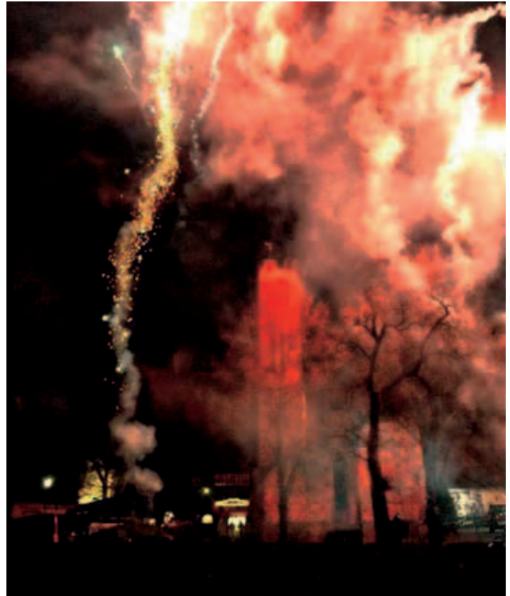
Burgweihnacht Kalbe (Milde)