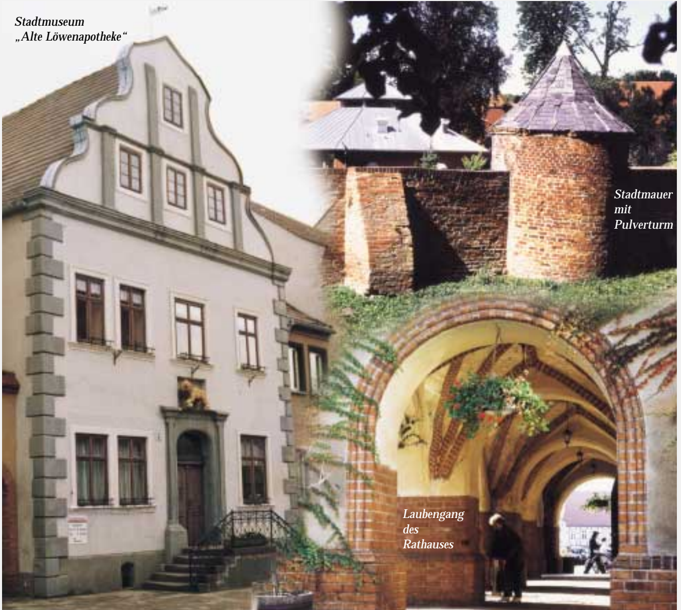
Stadtmauer mit Pulverturm