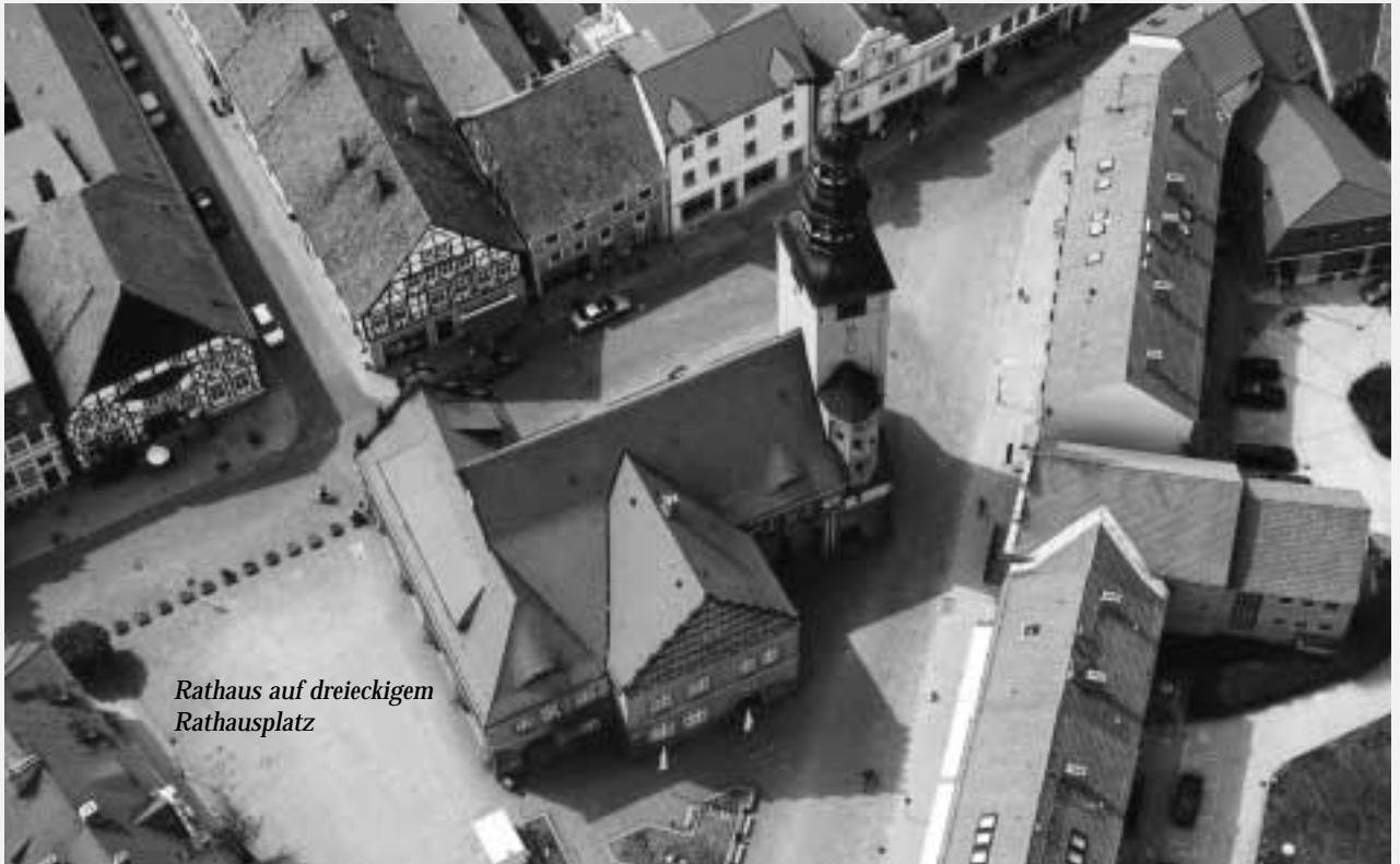
Rathaus auf dreieckigem Rathausplatz