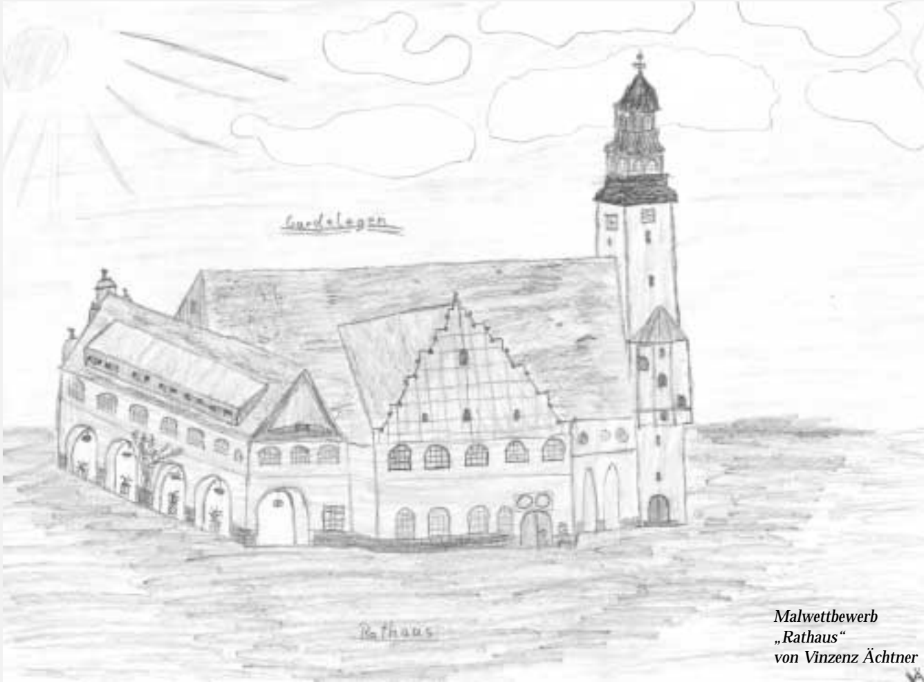
Malwettbewerb „Rathaus“ von Vinzenz Ächtner

Stadt Gardelegen, Hauptamt Rathausplatz 1, 39638 Gardelegen Tel. 716-217/223