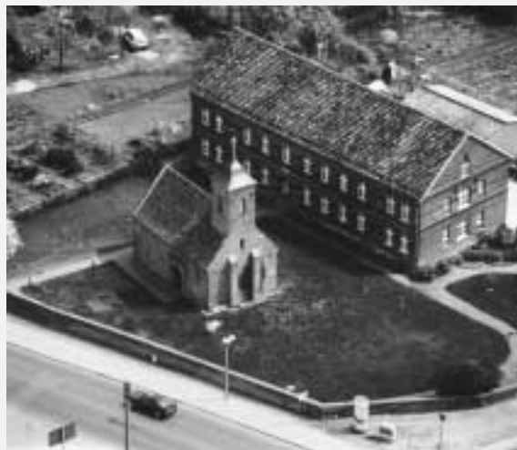
Galerie St. Georg

Avacon AG Philipp-Müller-Str. 20 39638 Gardelegen Tel. (03907) 7290