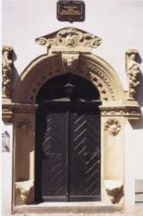
Portal an der Musikschule

In der Sandstraße befinden sich drei Sandsteinportale. Bei genauerem Hinsehen sind sie teilweise durch Aus- und Umbauten unwesentlich verändert. Die Präzision der Bögen ist beeinflusst. Es ist anzunehmen, dass die Sandsteinportale in der Zeit der Hanse in Gardelegen entstanden sind. So ist das älteste Portal um 1546 und das jüngste Portal um 1623 entstanden. So ist es in historischen Mitteilungen gesagt. Bei der Betrachtung der Sandsteinportale muss man aber auch einen Blick auf