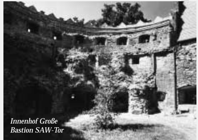
Innenhof Große Bastion SAW-Tor