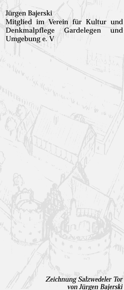
Zeichnung Salzwedeler Tor von Jürgen Bajerski

Mitglied im Verein für Kultur und Denkmalpflege Gardelegen und Umgebung e. V