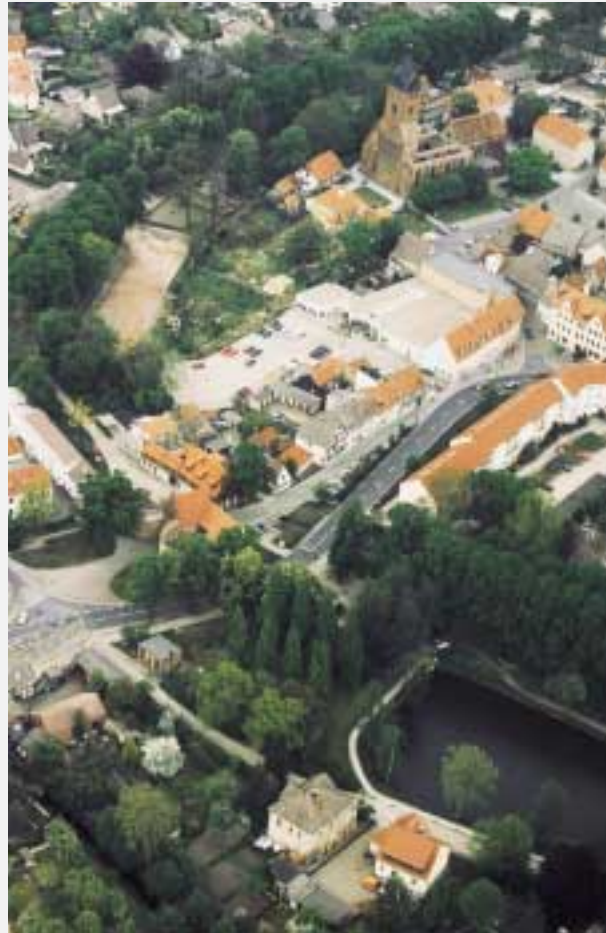
Luftaufnahme Bereich Salzwedeler Tor

Gleichgewicht und fiel unsanft in ein Beet. Mühsam rappelte er sich auf und ritt weiter auf sein Ziel zu. Als er ankam war das Tor jedoch vollständig verschlossen und so blieb es für alle Zeiten.