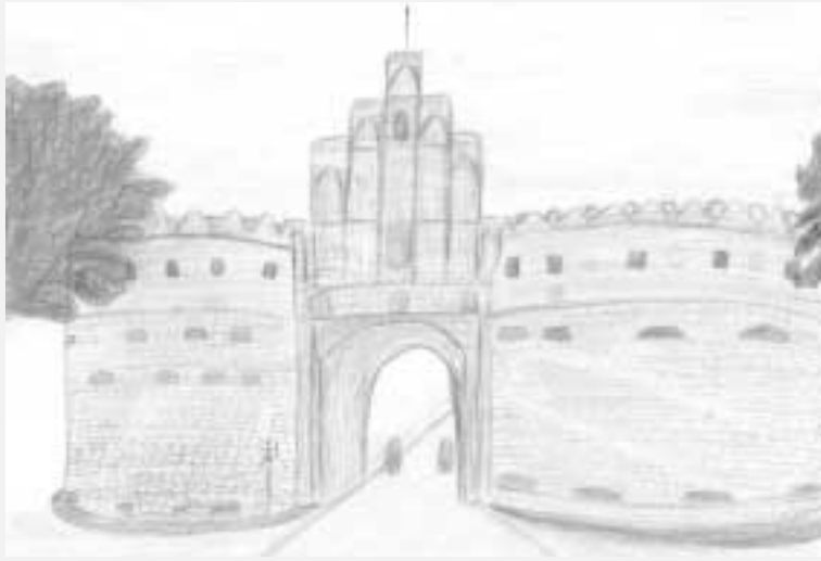
Malwettbewerb „Salzwedler-Tor“ von Nicole Fischer