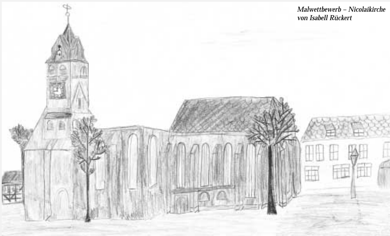
Malwettbewerb – Nicolaikirche von Isabell Rückert