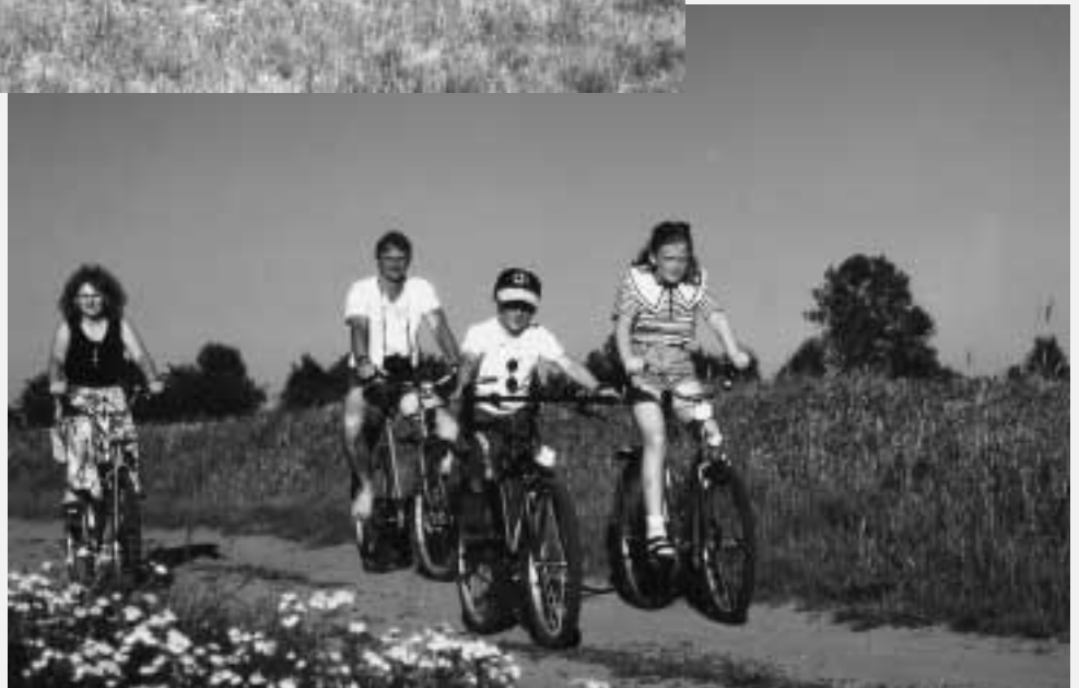
Radwanderer in der schönen Umgebung Gardelegens