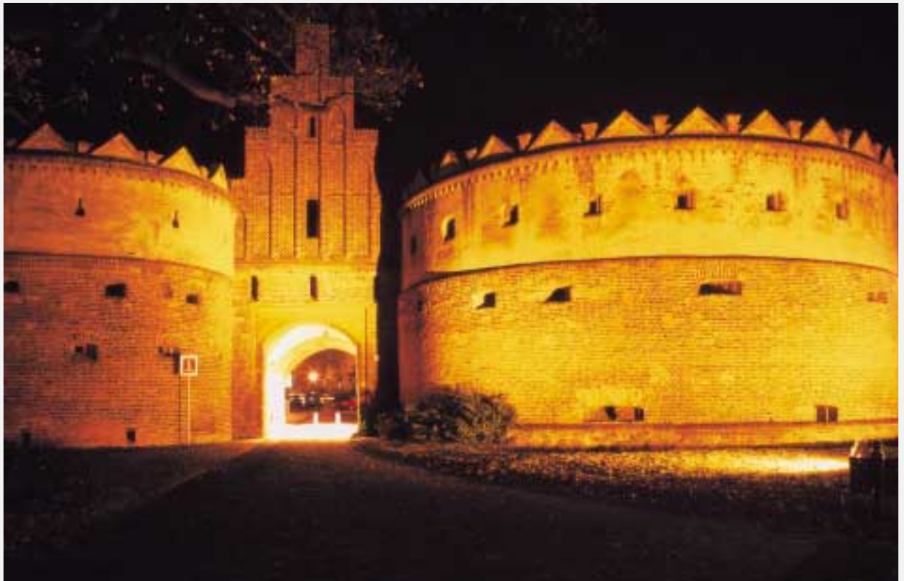
Das Salzwedeler Tor bei Nacht

Durch den Bau der Salzwedeler Tormühle mußte nachweislich Mitte des 13. Jahrhunderts die alte, aus dem Jahre 1155 stammende Stadtaufahrt, erneuert werden. Wann die hölzernen