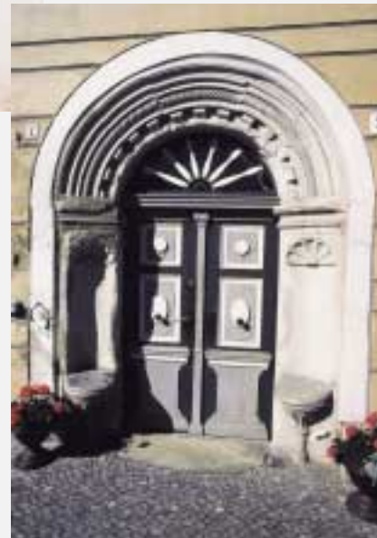
Portal Nikolaistraße 5