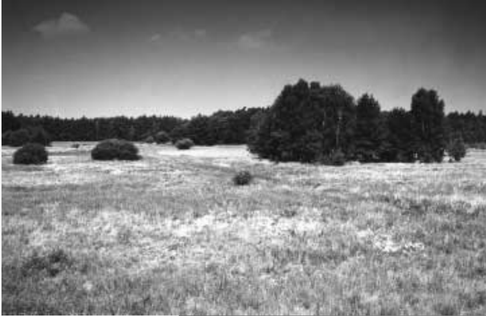
Heideblüte im Kämmereiforst