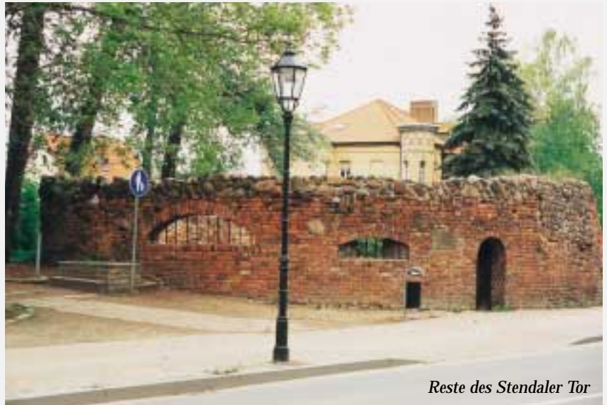
Reste des Stendaler Tor

Wer als Besucher nach Gardelegen kommt, sieht nicht gleich die kleinen Dinge an den Häusern und historischen Bauten, die die mittelalterliche Denk- und Lebensweise widerspiegeln. In Stein gehauene und in Holz geschnittene Mitteilungen, die über Jahrhunderte die Menschen ansprechen, sind auch heute noch von historischer Bedeutung. In den Balken von Fachwerkhäusern eingeschnittene Mitteilungen sagen aus, wer in dem Haus gewohnt hat und auch was die Beweggründe für den Bau des Hauses waren. Steinerne Hausmarken geben die Familienwappen der Hauseigentümer wieder. Das Haus Marktstraße 2 hat an seinem Giebel zum Rathaus hin gleich drei interessante Dinge. Eine Hausmarke zeigt das Familienwappen der Erbauer. Eine lange Inschrift sagt aus, dass das Haus mehrmals abgebrannt ist und wann es wieder von wem aufgebaut wurde. Am interessantesten ist aber eine plattdeutsche Inschrift in den acht Stützbalken des Dachgeschosses. "Glove,Leve,Trüe, Ehre Slopen leider Alle Vere" wird hier verkündet. Im Jahre 1685 wurde dies Haus errichtet. Viele Menschen haben sich schon Gedanken dazu gemacht, an wen wohl diese Botschaft gerichtet war. Am Nebenhaus, dem "Deutschen Haus" sind nicht nur die Inschrift, sondern auch mythische Symbole zu entdecken. Der "Wilde Mann", ein vierfach gekreuztes Diagonalkreuz, soll das Haus vor Unbilden und Feuer schützen. Am kleinen Erker über der