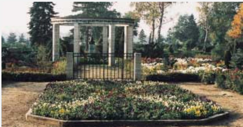
Reutter Grabmal auf dem städtischen Friedhof

Um die Jahrhundertwende war er der gefragteste Couplet-Sänger im deutschsprachigen Raum. Vorzugsweise trat er jedoch immer wieder im Berliner Wintergarten auf und wird daher noch heute als Berliner Original angesehen. Dennoch ließ er keine Gelegenheit aus, seine Heimatstadt