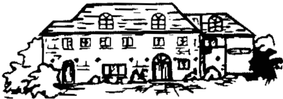
Haus Sodekamp-Dohmen Haus der Gastlichkeit und guter Küche

Das ideale Haus für Ihre Familien- oder Hochzeitsfeier im schönen, festlichen Ambiente