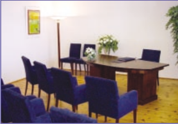
Trauraum von Hückelhoven

Eins ist sicher: Sie können gar nicht früh genug mit den Vorbereitungen beginnen. Dass es am Ende möglicherweise trotzdem hektisch wird, steht auf einem anderen Blatt. Aber so ein bisschen Spannung sollte schon sein, wie erfahrene Hochzeiter zu berichten wissen.