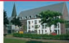
Martinistift Wesel Martinistraße 6-8