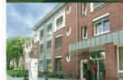
St. Christophorus Voerde-Friedrichsfeld Wilhelmstraße 4