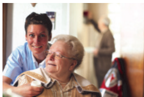
Ambulante Pflege zu Hause

Viele sprechen vom Helfen. Wir tun es. Für Sie!