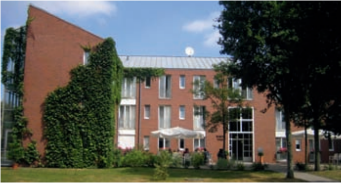
Bossow - Haus Frontansicht