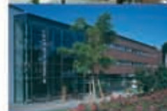
Nikolaus-Stift Wesel Wilhelm-Ziegler-Str. 21