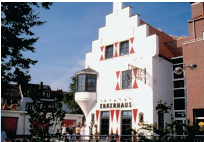
Gaststätte „Erkerhaus“, Auf dem Dudel

Sprechzeiten: jeden 2. Mittwoch im Monat 14.00–16.00 Uhr