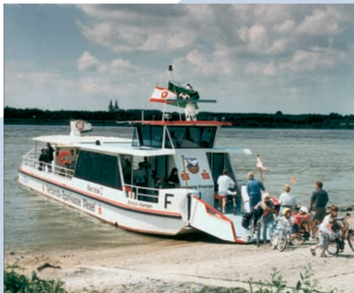
Personen- und Fahrradfähre „Kehr Tröch II“

Sprechzeiten: Mo., Di., Fr. 10.00–13.00 Uhr 14.00–17.00 Uhr Do. 10.00–13.00 Uhr 16.00–18.00 Uhr Mi. nach Vereinbarung