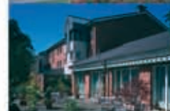
St. Elisabeth Voerde-Spellen Elisabethstraße 10